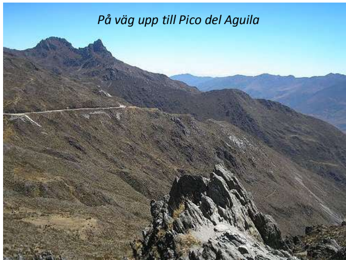
På väg upp till Pico del Aguila

Ni fortsätter idag på morgonen er färd på höglandet (privat transfer även denna dag) och når snart till andernas "paramo", en klimatzon på högt liggande platåer mellan 3 000 m ö h och snögränsen. Vegetationen som kantar sluttningarna består framförallt av "frailejones", ett grässlåg som ni kommer att se mycket av i detta område. Vid lagunen Macubaji börjar er vandring till Laguna Negra – Den svarta lagunen. Det är en behaglig vandring på små stigar som vindlar sig genom det gröna landskapet. Ni når snart lagunen som ändrar färg efter väder och säsong, allt från mörkt blå till mjölkigt