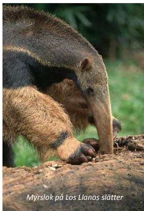
Myrslok på Los Llanos slätter

Hato El Cedral (3*). Frukost, lunch, middag.