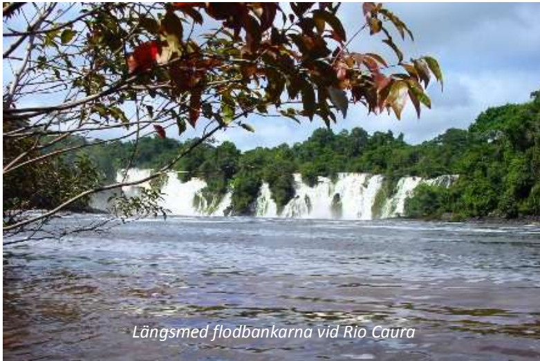
Längsmed flodbänkarna vid Rio Caura

Ni börjar dagen med en båtfärd uppströms för en av Orinocos biflöden, Rio Negro. Floden sträcker sig till stora delar längs orörda regnskogsområden och är viktig för Makritareindianerna och andra indianstammar som länge har levt utan större influenser från civilisationen. Ni fortsätter en bit på floden och passerar ett antal mindre vattenfall tills ni når Cerro Cangrejo. Härifrån utgår en vandringsled, där ni under ca två timmar tar er genom lummig