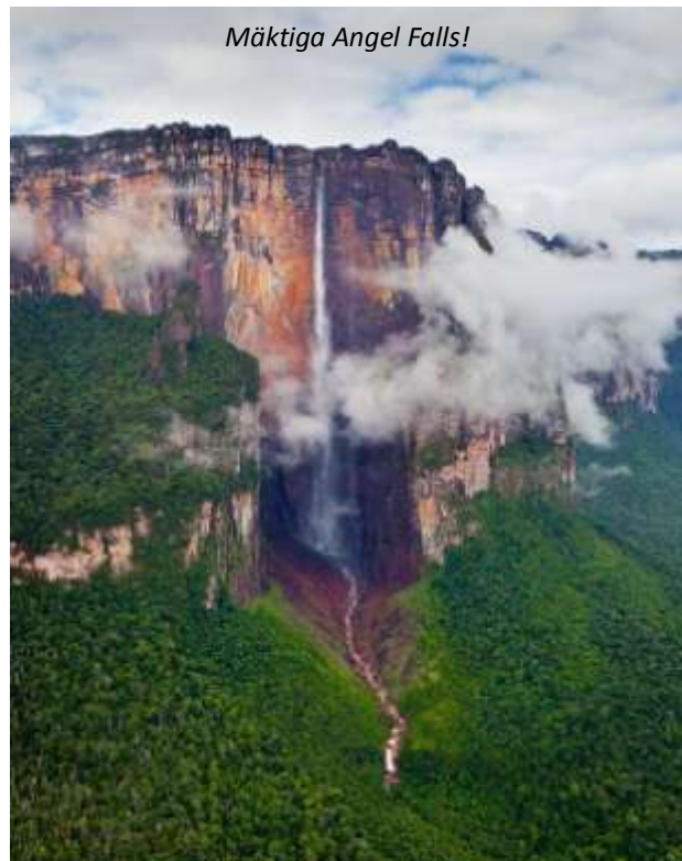
Mäktiga Angel Falls!

Tupay Lodge (3*). Frukost, lunch, middag.