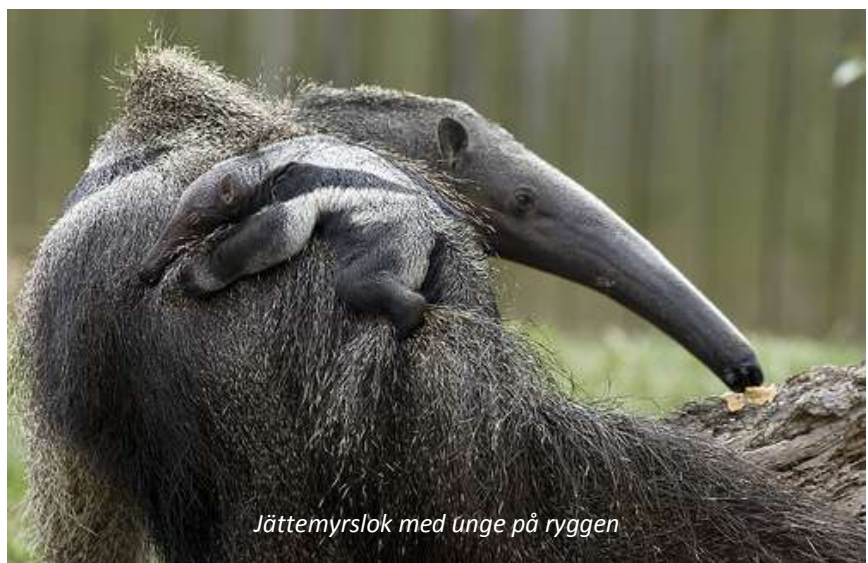
Jättemyrslök med unge på ryggen

Dagens aktiviteter är flexibla beroende på väder och vattenstånd. På morgonen är dock en utflykt planerad ut på de böljande gräsmarkerna i närheten av lodgen för att skåda efter jättemyrslök - som namnet antyder är detta den största arten av de fyra myrslökarna och kan väga upp emot 40 kilo. Området runt Karanambu är en av de bästa platserna att se detta säregna djur, som lever helt och hållet på myror och termiter. De gräver hål i termitstackarna där de sedan