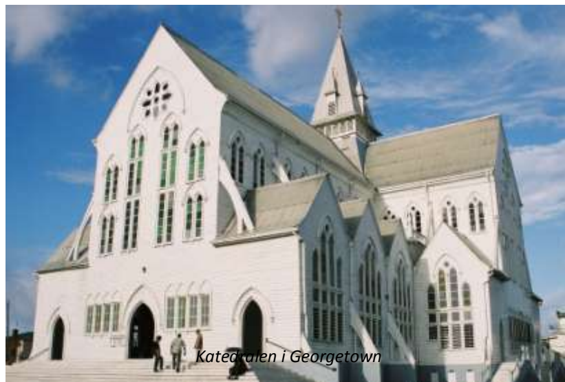
Katedralen i Georgetown

Ni hämtas på hotellet tidigt på morgonen och körs till flygplatsen för att flyga västerut till Georgetown, huvudstad i grannlandet Guyana. Här möts ni och körs till ert mycket centralt belägna hotell, som är stadens mest anrika då det byggdes redan på 1840-talet. Georgetown har idag cirka 240 000 invånare, inklusive förorter, och är Guyanas enda större stad. Namnet Guyana kommer från ett indianskt ord som betyder "vattnens land", vilket stämmer alldeles förträffligt då Guyana är ett av världens tio vattenrikaste länder.