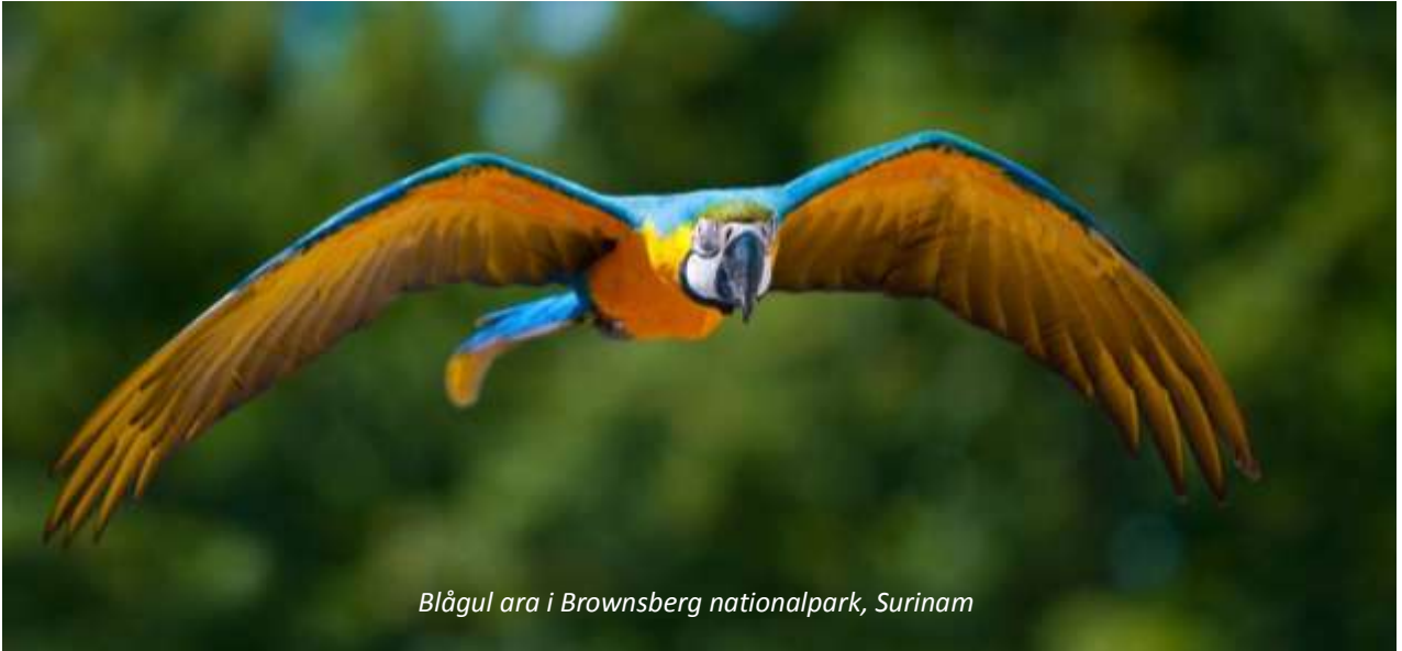
Blågul ara i Brownsberg nationalpark, Surinam