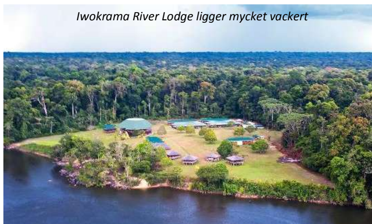
Iwokrama River Lodge ligger mycket vackert

Tidigt på morgonen hämtas ni på hotellet och körs till flygplatsen för att flyga söderut till det lilla flygfältet i Fairview. Härifrån har ni en kort resa till Iwokrama River Lodge. Området runt Iwokrama är unikt, här har man inlett