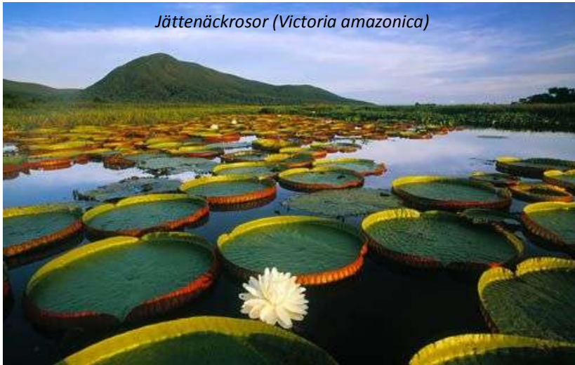
Jättenäckrosor (Victoria amazonica)

I gryningen tar ni en promenad vid foten av Pakaraimabergen längs den så kallade Panoramaleden. Stigen gör skäl för sitt namn, utsikten över savannen och byarna nedanför när solen går upp är oförglömlig! Ni har goda möjligheter att se många fågelarter, som till exempel Finchs euphonia, rosteremit, gulnäbbad jakamar och rostbukig myrsmyg, samt höra vrålapornas kraftiga rop. Ni kommer tillbaka till lodgen för frukost innan ni reser vidare mot Ginep Landing, där ni går ombord på en båt som kommer att ta er till