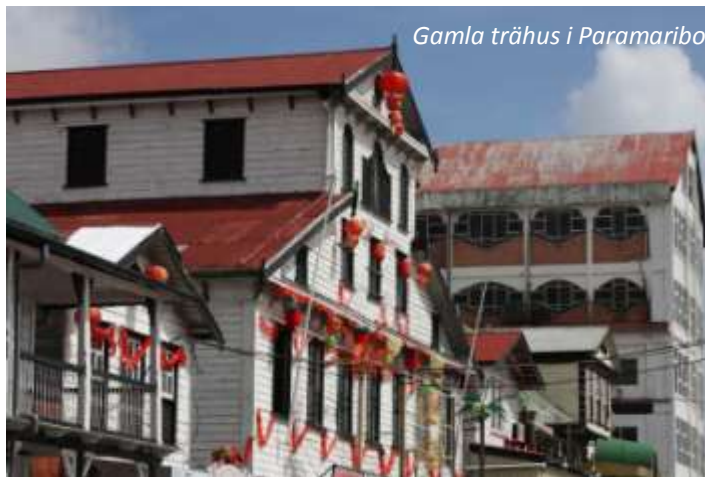
Gamla trähus i Paramaribo

Commewijnedistriktet och ser längs vägen flera gamla plantager från kolonialtiden, varav de flesta idag är övergivna. Ni stannar vid en av de äldsta, Peperpot. Denna är fortfarande i näst intill ursprungsskick och ni tar en tur i den gamla gårdsbyggnaden samt på ägorna, där ni ser kaffe- och kakaobuskar. Besöket här ger en fascinerande inblick i hur livet såg ut på 1700- och 1800-talen, då stora mängder slavar fördes från Afrika hit för att arbeta under hemska förhållanden på plantagerna. När slaveriet avskaffades på senare hälften av 1800-talet, kom istället många arbetare från andra holländska kolonier, framför allt Indonesien, vilket ledde till att Surinam idag har en världens mest mångkulturella befolkning. Dagens nästa stopp gör ni vid Marienburg, en före detta sockerrörsplantage som idag har gjorts om till museum. Efter lunch fortsätter ni till platsen där floderna Suriname och Commewijne möts, där vi ser det imponerande fortet Nieuw Amsterdam som byggdes mellan 1734 och 1747. Eco Resort Inn (3*). Frukost, lunch.