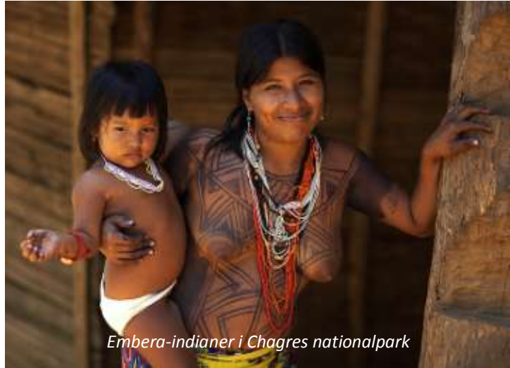
Embera-indianer i Chagres nationalpark