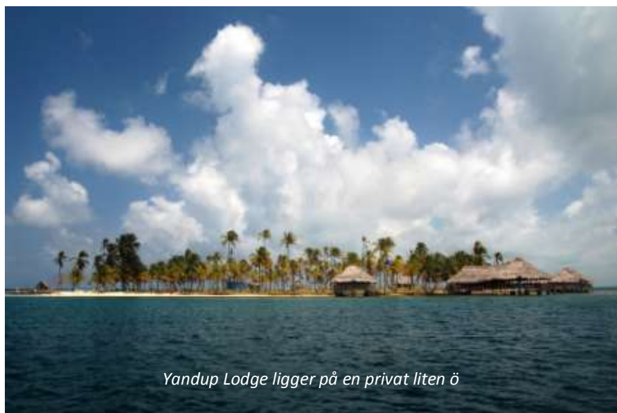
Yandup Lodge ligger på en privat liten ö

Ni hämtas på hotellet mycket tidigt på morgonen och körs till flygplatsen för att flyga till Playón Chico. Ni befinner er nu i Kuna Yala, mer känt som San Blas-öarna. Dessa öar är ett autonomt område och kulturen är mycket speciell, då människorna här lever i ett matriarkat. Under era dagar här så har ni helpension inkluderad och ert hotell har ett antal utflykter av vilka ni