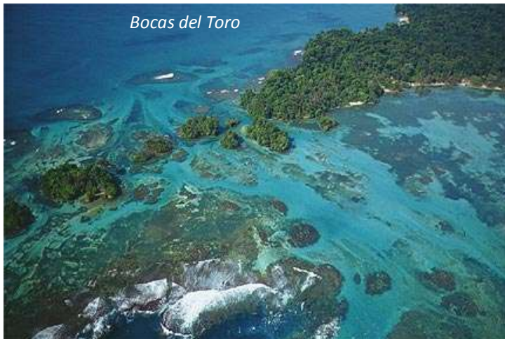
Bocas del Toro

Ni hämtas på hotellet och körs till flygplatsen för att flyga till Panamas nordvästligaste provins, Bocas del Toro. Det var här som Christoffer Columbus steg iland 1502 och brittiska pirater hade sin bas här på 1800- och 1900-talen. Än idag är engelska det dominerande språket här. Idag är provinsen mest känt för sin vackra natur, härliga stränder och utmärkta snorkling och dykning. Ni möts vid ankomsten och körs den korta sträckan till ert hotell, som ligger precis vid vattnet. Från balkongen på