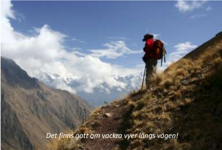
Det finns gott om vackra vyer längs vägen!

Ni går upp runt 6.00 och efter frukost lämnar ni Wayllabamba för att börja den svåraste delen av Inkaleden, som består av en brant stigning som varar ca nio km. Under denna stigning så förändras naturen, från sierran till punan , högländsterräng bestående av gult ichugräs och låga, vindpinade buskar. På vägen till det första bergspasset, Abra Warmihuañusca (den döda kvinnans pass), kommer ni att se domesticerade lamor och alpackor betades av ichugräset. Ni kommer också att vandra igenom molnskog, som karakteriseras av mångfalden av