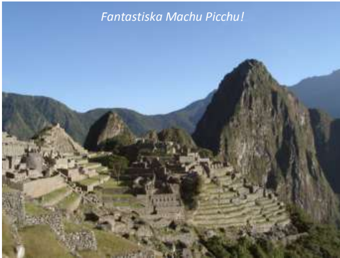
Fantastiska Machu Picchu!

Denna fjärde och sista dag går ni upp klockan 4.00 och lämnar Wiñaywayna en timme senare för den avslutande vandringen till solporten, Inti Punku, som tar cirka en timme. Härifrån kommer ni att se soluppgången över de fantastiska ruinerna nedanför – Machu Picchu! Efter en knapp timmes vandring till kommer ni fram till denna mytomspunna plats. Ni går först och registrerar er och lämnar era ryggsäckar (kostnad cirka 3 USD) för att njuta av ruinerna utan dessa på ryggen. Direkt därpå följer en guidad tur av Machu Picchu som tar ungefär två timmar. Därefter har ni ledig tid för att vandra runt på egen hand; då ni kommer att bo i Aguas Calientes, som ligger i en dalgång nedanför