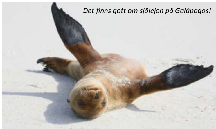
Det finns gott om sjölejon på Galápagos!

Galápagos är ett av de resmål som nästan alla har hört talas om och många drömmer sig till. Varför är inte så svårt att förstå – det är verkligen så som man tror att det är. För att gå iland måste man kliva över sjölejon som ligger och sover på klipporna, man måste gå runt ruvande fåglar på stigarna; Galápagos är ett unikt resmål för dig som är intresserad av djur och natur. Det mesta man ser runt sig är endemiskt, det vill säga finns bara här, och ingen annanstans i världen kommer man så nära djuren!