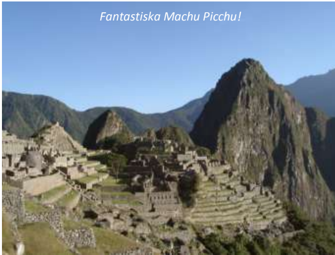
Fantastiska Machu Picchu!

Denna fjärde och sista dag går ni upp klockan 4.00 och lämnar Wiñaywayna en timme senare för den avslutande vandringen till solporten, Inti Punku, som tar cirka en timme. Härifrån kommer ni att se soluppgången över de fantastiska ruinerna nedanför – Machu Picchu! Efter en knapp timmes vandring kommer ni fram till denna mytomspunna plats. Ni går först och registrerar er och lämnar era ryggsäckar (kostnad cirka 3 USD) för att njuta av ruinerna utan dessa på ryggen. Direkt därpå följer en guidad tur av Machu Picchu som tar ungefär två timmar. Därefter har ni ledig tid för att vandra runt på egen hand; då ni kommer att bo i Aguas Calientes, som ligger i en dalgång nedanför