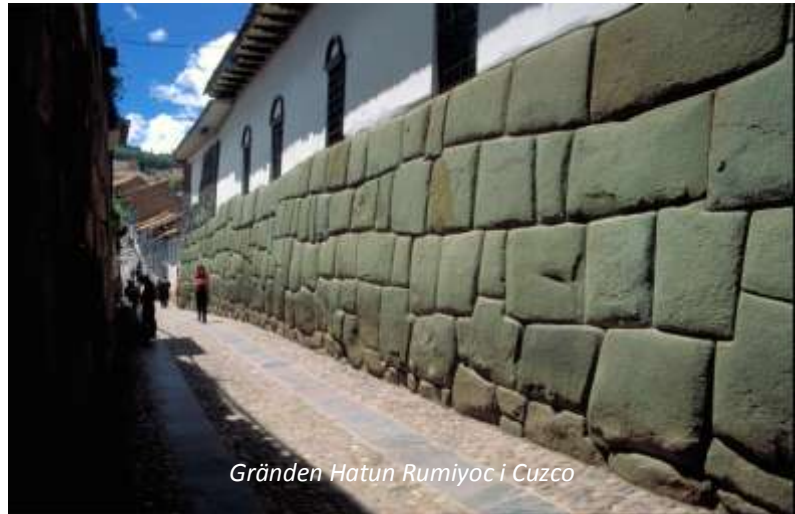
Gränden Hatun Rumiyoq i Cuzco

På morgonen körs ni till flygplatsen för att flyga till inkarikets gamla huvudstad, Cuzco. Vid ankomsten möts ni och körs till ert hotell. Resten av dagen är ledig för att på egen hand ströva runt i den underbara staden och vänja er vid den tunna luften. Tänk på att ta det lugnt denna första dag på hög höjd, Cuzco ligger på hela 3 310 meters höjd. Den bästa medicinen för att aklimatisera sig är att ta det lugnt med såväl alkoholhaltiga drycker som tobak, dricka mycket vatten och gärna vila ett par timmar efter ankomsten. På eftermiddagen rekommenderar vi ett besök vid huvudtorget Plaza de Armas och den närbelägna gränden Hatun Rumiyoq, där ni kan se den berömda 12-kantiga stenen! Här i närheten ligger även de mycket charmiga hantverkskvarteren San Blas. Hotel Plaza San Francisco (3*). Frukost, måltid ombord på planet.