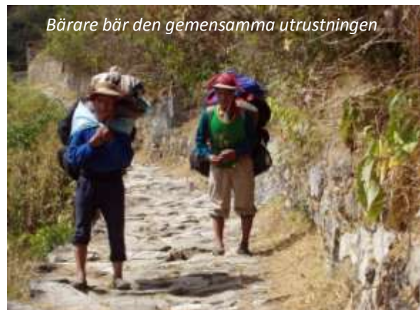
Bärare bär den gemensamma utrustningen