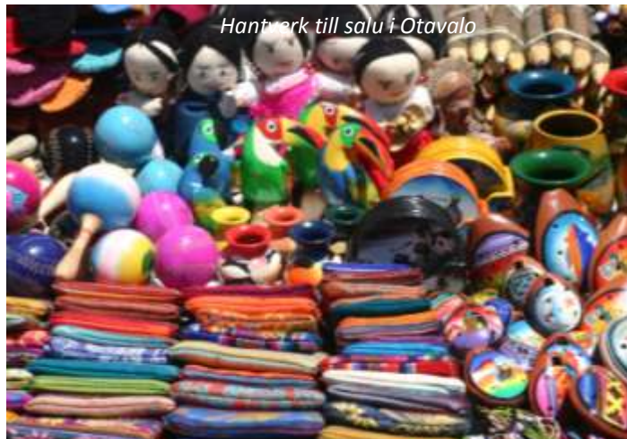
Hantverk till salu i Otavalo