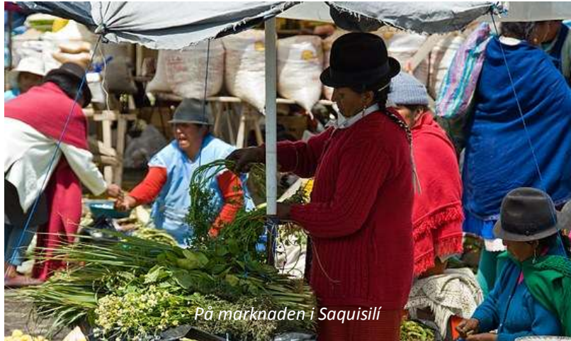
På marknaden i Saquisilí

Efter frukost körs ni den korta sträckan till byn Saquisilí. Här kan man njuta av den största indianmarknaden i hela Ecuador! Byn åtta torg och alla gator däremellan är fulla med folk som köper och säljer varor. Här säljs allt, från djur som lamor, grisar, kor och marsvin till grönsaker, tröjor, plasthinkar osv. Roligast av allt är ändå att se hur ursprungsbefolkningen köpslår och handlar som de alltid har