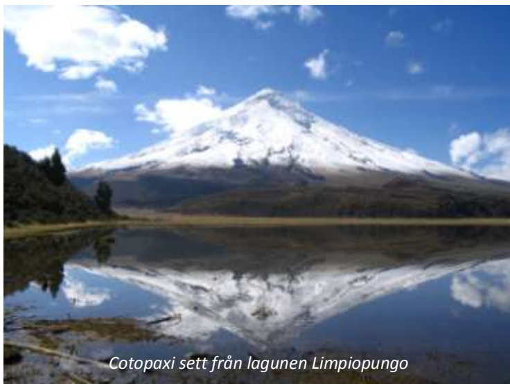
Cotopaxi sett från lagunen Limpiopungo

Ni reser idag tidigt på morgonen söderut längs det som Alexander von Humboldt kallade Vulkanernas Aveny, då Anderna här består av två parallella bergskedjor och ni färdas i dalen mellan dessa. Så småningom kommer ni fram till det lilla samhället Lasso, som fått sitt namn efter familjen med samma namn som en gång i tiden ägde hela detta område. Deras hacienda, La Cienega, byggdes i mitten av 1600-talet och är en av Ecuadors vackraste och mest välbevarade haciendor. Idag fungerar detta magnifika hus som hotell och det är här ni kommer att bo i natt –