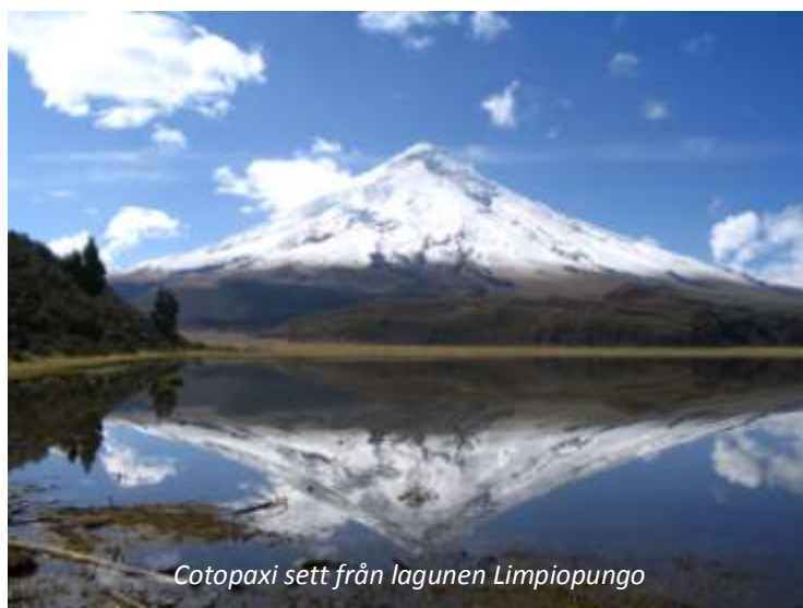
Cotopaxi sett från lagunen Limpiopungo

Ni reser idag tidigt på morgonen söderut längs det som Alexander von Humboldt kallade Vulkanernas Aveny, då Anderna här består av två parallella bergskedjor och ni färdas i dalen mellan dessa. Så småningom kommer ni fram till det lilla samhället Lasso, som fått sitt namn efter familjen med samma namn som en gång i tiden ägde hela detta område. Deras hacienda, La Cienega, byggdes i mitten av 1600-talet och är en av Ecuadors vackraste och mest välbevarade haciendor. Idag fungerar detta magnifika hus som hotell och det är här ni kommer att bo i natt –