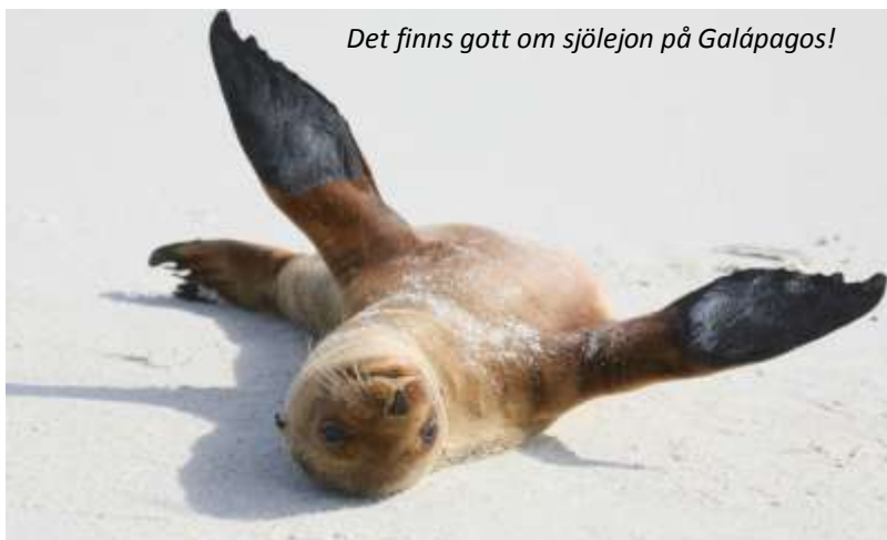
Det finns gott om sjölejon på Galápagos!

På alla båtar finns gratis dricksvatten, samt alkoholhaltiga drycker och läsk till försäljning. Snorkelutrustning finns på de flesta båtar, men ta gärna med snorkel och mask då kvaliteten är varierande och ofta dålig. Båtarna går de längre sträckorna på natten för att det ska bli så mycket tid som möjligt på öarna. Om du har anlag för sjösjuka, ta med tabletter eller plåster mot detta hemifrån. Särskilt under torrperioden maj-december kan det gå en hel del sjö, medan det är lugnare under regnperioden januari-april.