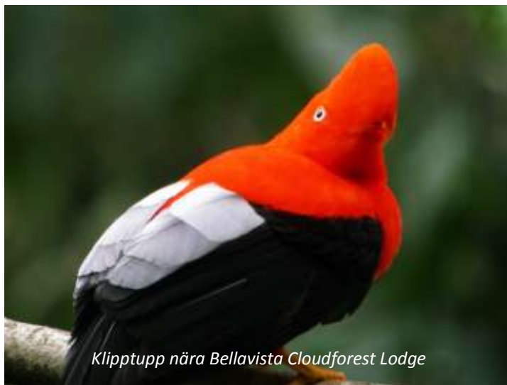
Klipptupp nära Bellavista Cloudforest Lodge

Idag åker ni västerut mot Mindo nationalpark. Resan tar bara cirka 1½ timme, men landskapet förändras dramatiskt under resans gång. Från högländerna åker ni nu neråt i höjd och når så småningom molnskogen i Mindo. Denna klimatzon kallas för molnskog då högländernas kalla luft möter lågländernas varmare och fuktigare luft, varför kondens bildas som särskilt på morgonen och kvällen ligger som en dimma över den täta skogen. Molnskog kännetecknas av den mångfald av epifyter som växer här, det vill säga växter som växer på andra växter. Orkidéer är ett av de