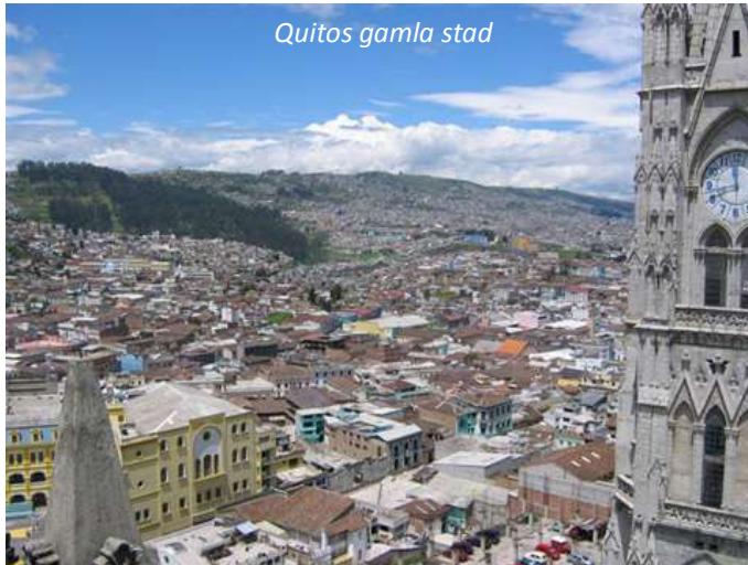
Quitos gamla stad

De gamla delarna i Quito är skyddade av Unesco och varför är lätt att förstå. De vindlande gränderna, de rikt utsmyckade vitkalkade husen och de fantastiska kyrkorna gör att det känns som om ni befinner er i en annan tid. Den mest berömda kyrkan i Quito är San Francisco-kyrkan, vars väggar är täckta av bladguld. Nära intill ligger La Compañía-kyrkan vilken också den är rikt utsmyckad. Efter besöket här så fortsätter ni 22 kilometer norrut till det som är världens största ekvatormonument, Mitad del Mundo. Ekvatorn går rakt genom landet och har också gett Ecuador dess namn. Här