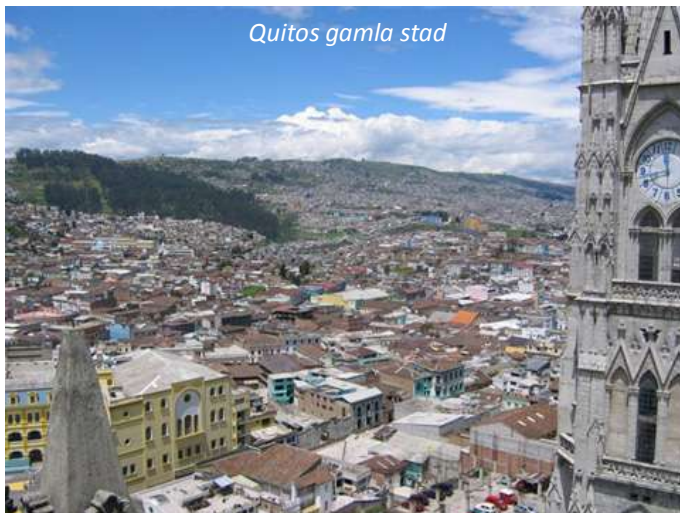
Quitos gamla stad

De gamla delarna i Quito är skyddade av Unesco och varför är lätt att förstå. De vindlande gränderna, de rikt utsmyckade vitkalkade husen och de fantastiska kyrkorna gör att det känns som om ni befinner er i en annan tid. Den mest berömda kyrkan i Quito är San Francisco-kyrkan, vars väggar är täckta av bladguld. Nära intill ligger La Compañía-kyrkan vilken också den är rikt utsmyckad. Efter besöket här så fortsätter ni 22 kilometer norrut till det som är världens största ekvatormonument, Mitad del Mundo. Ekvatorn går rakt genom landet och har också gett Ecuador dess namn. Här