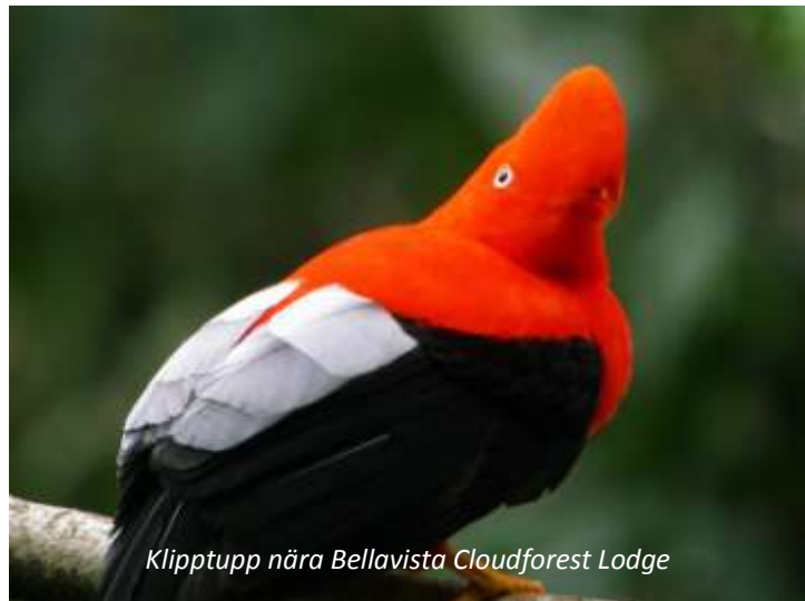
Klipptupp nära Bellavista Cloudforest Lodge

Idag åker ni västerut mot Mindo nationalpark. Resan tar bara cirka 1½ timme, men landskapet förändras dramatiskt under resans gång. Från högländerna åker ni nu neråt i höjd och når så småningom molnskogen i Mindo. Denna klimatzon kallas för molnskog då högländernas kalla luft möter lågländernas varmare och fuktigare luft, varför kondens bildas som särskilt på morgonen och kvällen ligger som en dimma över den täta skogen. Molnskog kännetecknas av den mångfald av epifyter som växer här, det vill säga växter som växer på andra växter. Orkidéer är ett av de