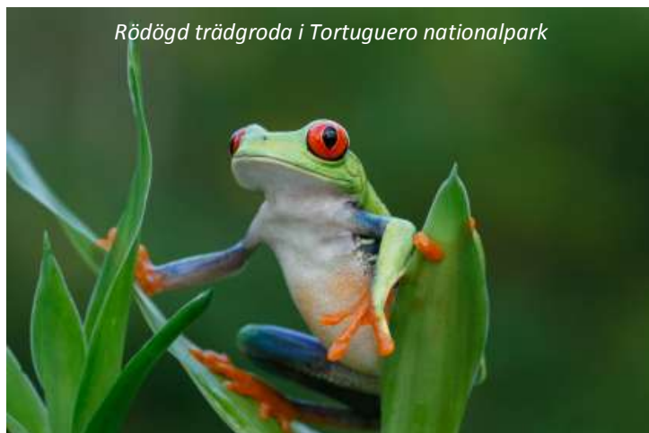
Rödögd trädgroda i Tortuguero nationalpark

Mawamba Lodge (3*). Frukost, lunch, middag.