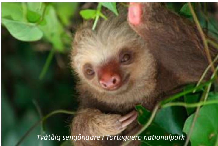
Tvåårig sengångare i Tortuguero nationalpark

Tidigt på morgonen hämtas ni på hotellet och körs österut mot en av Costa Ricas mest intressanta nationalparker, Tortuguero. Resan går genom den spektakulära regnskogen i Braulio Carillo nationalpark, bara 30 minuter från San José. Efter ett par timmars resa byter ni till båt som tar er genom de slingrande kanalerna fram till er lodge. Under båtresan har ni er första möjlighet att njuta av denna nationalparks fantastiska flora och fauna. Tortuguero är endast 312 km 2