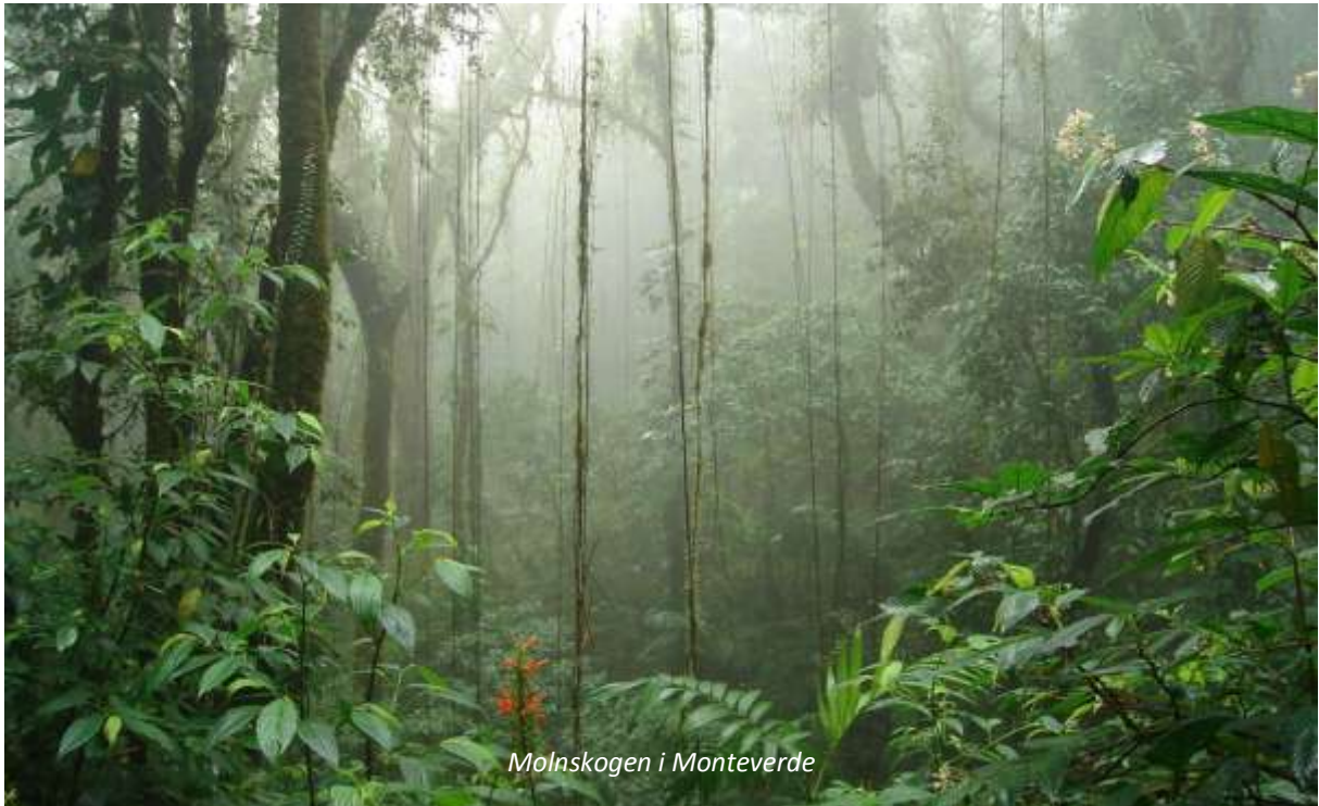
Molnskogen i Monteverde