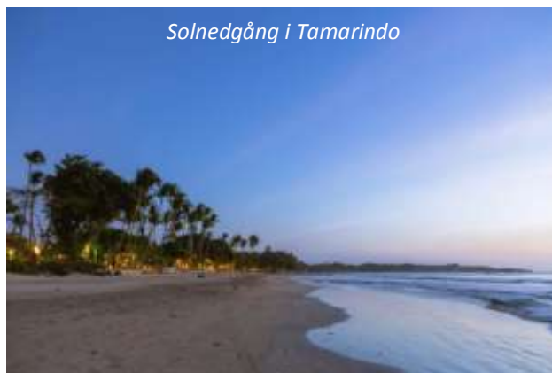
Solnedgång i Tamarindo