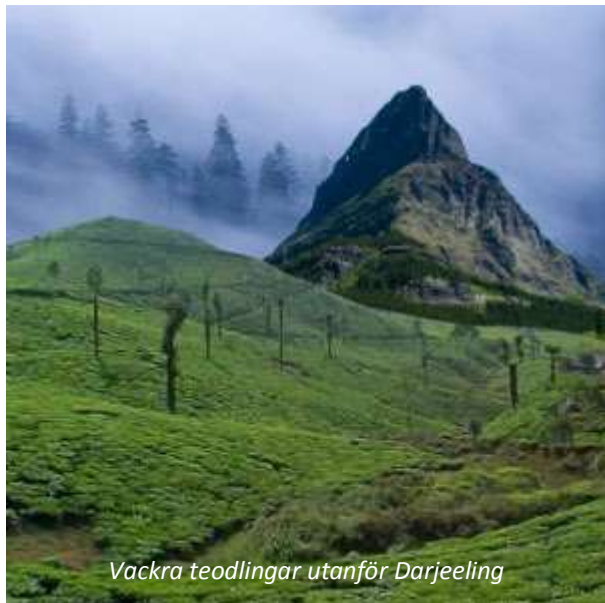
Vackra teodlingar utanför Darjeeling

Ni hämtas på hotellet på morgonen och körs till flygplatsen. Härifrån flyger ni norrut till den lilla staden Bagdogra, där ni möts och körs längs en vacker väg kantad av många teodlingar till Darjeeling. Resten av dagen är ledig för egna strövtåg i denna charmiga stad. Britternas närvaro sedan mitten av 1800-talet och den därefter expanderande teproduktionen har haft en framstående roll i utvecklingen av distriktet. Darjeelingteerna är berömda världen över för sin utmärkta kvalitet och mångskiftande smak.