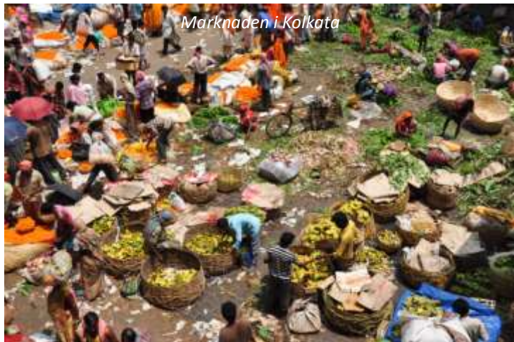
Marknaden i Kolkata

Efter en tidig frukost hämtas ni för att köras till flygplatsen i Paro varifrån ni flyger åter över gränsen till Indien och Kolkata. Passa på att njuta av Bhutan från ovan där vyerna är rent magiska; när ni flyger över bergskammen ut från Parodalen ser ni de många vackra husen klättra längs de gröna sluttningarna. Vid ankomsten möts ni och körs till ert hotell. Resten av dagen är ledig för egna promenader i denna jättestad.; besök gärna marknaden som är en orgie i färger och lukter!