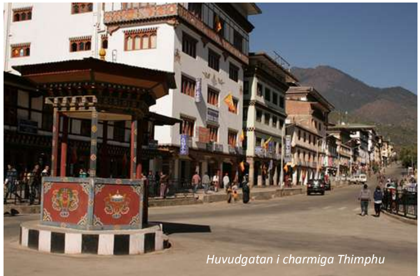
Huvudgatan i charmiga Thimphu

Hotel Dorji Elements (3*). Frukost, lunch, middag.