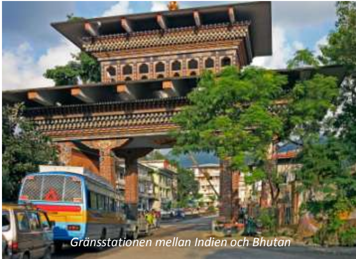
Gränsstationen mellan Indien och Bhutan

staden också ett viktigt centrum för tibetansk kultur. På eftermiddagen gör ni en stadsrundtur, där ni ser de viktigaste sevärdheterna. Snittblommor har blivit en viktig industri för denna del av Indien och ni gör ett besök i ett av växthusen för att få en förklaring till hur denna rätt komplicerade industri fungerar.