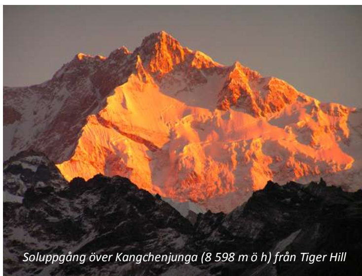
Soluppgång över Kangchenjunga (8 598 m ö h) från Tiger Hill

den 2 600 meter höga toppen åker ni smalspårigt ånglokståg, den sk Darjeeling Himalayan Railway , till Ghoomklostret. Under cirka en timmes färd bjuds ni på spektakulära vyer innan ni når slutstationen och klostret som ligger på sträckans högst belägna punkt. Tåget som har fått smeknamnet "leksakståget" är av UNESCO listat som världsarv. Utsikten är oförglömlig – ni ser flera av världens högsta toppar, bland annat Mount Everest. I klostret, som uppfördes av en mongolisk munk och astrolog år 1875, bevaras värdefulla buddhistiska skrifter och byggnaden är det största av de tre i samhället Ghoom. Ni återvänder till Darjeeling i fyrhjulsdrivet fordon och på eftermiddagen besöker ni självhjälpscentrat för tibetanska flyktingar. De flyktingar som slog sig ner här startade centret, vilket är en av de äldsta i sin genre. Här driver man skolor för tibetanska barn, odlar organiska grödor, förestår klosterskolor och håller hantverkstraditioner levande, bland annat genom tibetansk mattillverkning.