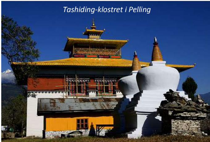
Tashiding-klostret i Pelling