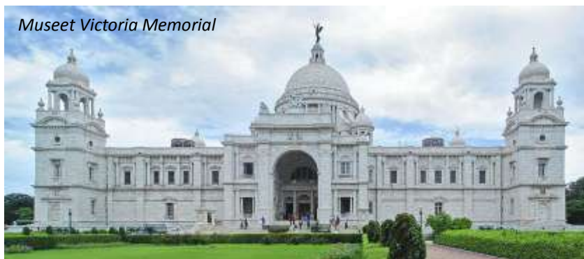
Museet Victoria Memorial

Efter lunch hämtas ni för en kortare stadsrundtur i det tätbefolkade och pulserande Kolkata, kanske mer känd som Calcutta vilket staden ju hette tidigare. Staden är huvudstad i delstaten Västbengalen och har cirka fem miljoner invånare. Kolkata är därmed Indiens tredje största stad. Ni kommer först att besöka det marmorklädda och imponerande Victoria Memorial; ett