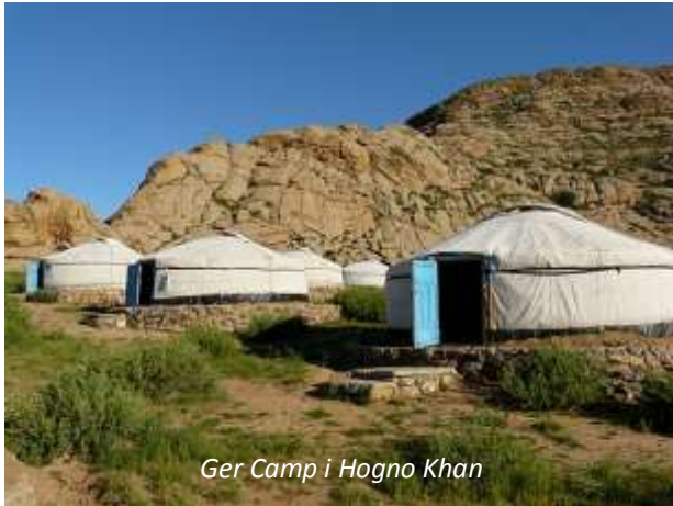
Ger Camp i Hogno Khan

Ni lämnar Terelj efter frukost och kör mot Hogno Khan-bergen. Ni kommer fram till er ger camp på eftermiddagen. Denna ligger väldigt vackert vid foten av de pittoreska bergen. På eftermiddagen ger ni er ut på en kortare vandring där ni bland annat besöker ruinerna efter Ovgon-klostret.