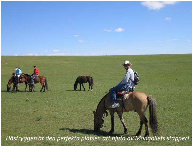
Hästryggen är den perfekta platsen att njuta av Mongoliets stäpper!

Ni fortsätter er ridtur på den enorma stäppen. Hann ni inte med att besöka en nomadfamilj igår, så kan ni göra det idag istället. Eftersom de konstant flyttar runt, så är det svårt att veta var man kommer att träffa dem. Gästfrihet är mycket viktigt för dessa nomader, vilket är förståeligt; under sommaren är det varmt och skönt men på vintern blir det stundtals ner mot 30-40 minusgrader och då krävs det samarbete för att överhuvudtaget kunna överleva. När man blir inbjuden till en ger, så är det antal regler som måste