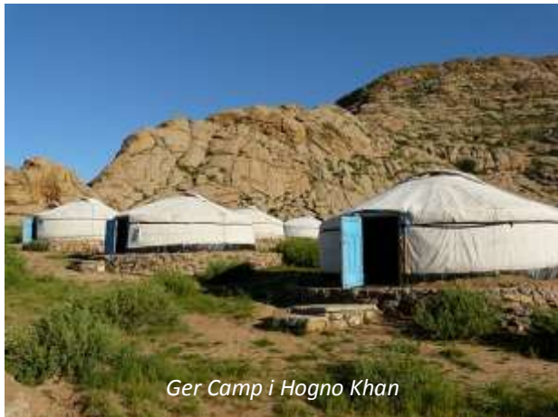
Ger Camp i Hogno Khan

Ni lämnar Terelj efter frukost och kör mot Hogno Khan-bergen. Ni kommer fram till er ger camp på eftermiddagen. Denna ligger väldigt vackert vid foten av de pittoreska bergen. På eftermiddagen ger ni er ut på en kortare vandring där ni bland annat besöker ruinerna efter Ovgon-klostret.