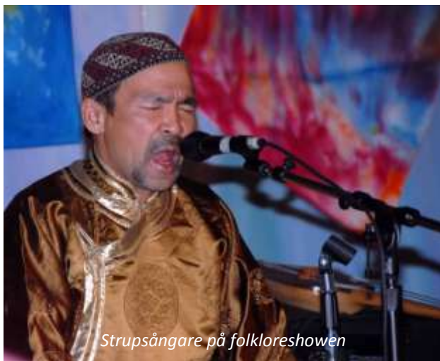
Strupsångare på folkloreshowen

Efter frukost åker ni tillbaka till Ulan Bator. Eftermiddagen är ledig för egna aktiviteter och på kvällen väntar en riktig höjdpunkt, en folkloreshow där ni kommer att få se och höra en mongolisk specialitet; strupsång! Det går inte att beskriva hur det låter, det måste upplevas.