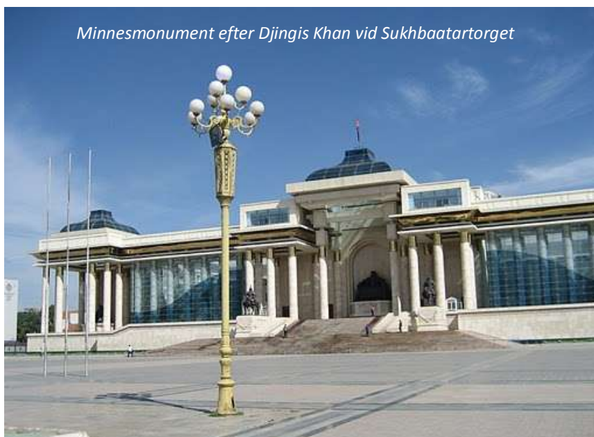
Minnesmonument efter Djingis Khan vid Sukhbaatarorget

Ni landar i Ulan Bator, Mongoliets huvudstad, på morgonen. Ni möts vid ankomsten och körs till ert hotell, som ligger mycket centralt. Efter ett par lediga timmar för att ta igen er efter den långa resan, hämtas ni för en stadsrundtur vid lunchtid. Ni börjar med att åka upp till berget Zaisan, för att njuta av den vackra utsikten över huvudstaden, och fortsätter sedan ner till huvudtorget Sukhbaatar och avslutar på det naturhistoriska museet,