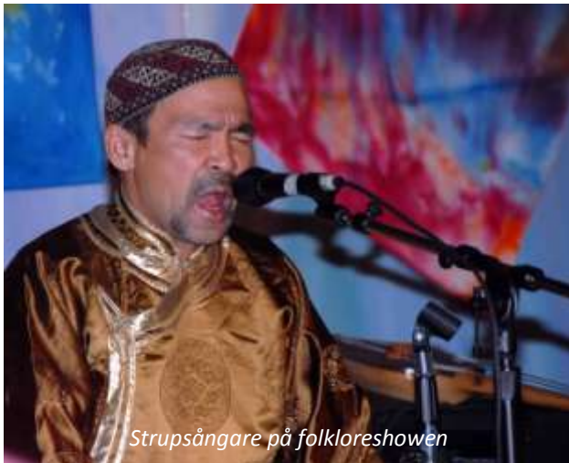
Strupsångare på folkloreshowen

Efter frukost åker ni tillbaka till Ulan Bator. Eftermiddagen är ledig för egna aktiviteter och på kvällen väntar en riktig höjdpunkt, en folkloreshow där ni kommer att få se och höra en mongolisk specialitet; strupsång! Det går inte att beskriva hur det låter, det måste upplevas.