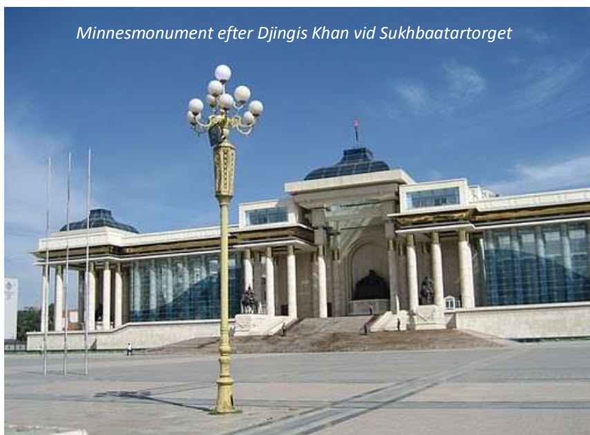
Minnesmonument efter Djingis Khan vid Sukhbaatarorget

Ni landar i Ulan Bator, Mongoliets huvudstad, på morgonen. Ni möts vid ankomsten och körs till ert hotell, som ligger mycket centralt. Efter ett par lediga timmar för att ta igen er efter den långa resan, hämtas ni för en stadsrundtur vid lunchtid. Ni börjar med att åka upp till berget Zaisan, för att njuta av den vackra utsikten över huvudstaden, och fortsätter sedan ner till huvudtorget Sukhbaatar och avslutar på det naturhistoriska museet,