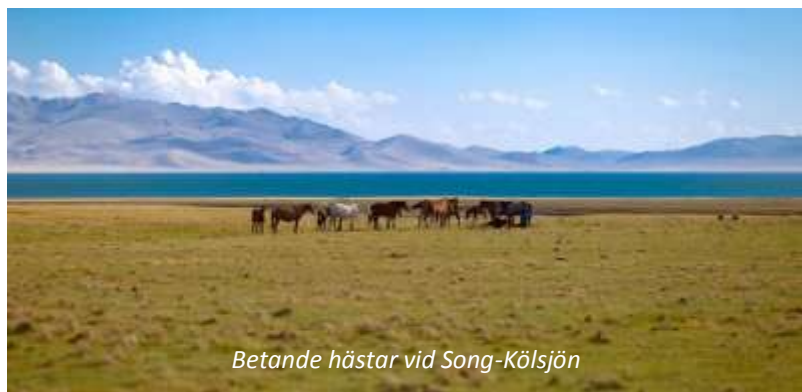
Betande hästar vid Song-Kölsjön

Ledig dag för att utforska de vackra omgivningarna runt sjön. Vi rekommenderar att göra detta från hästryggen, då det är det bästa sättet att uppleva naturscenerierna - och, förstås, dessutom det mest traditionella! Kostnaden för hyra av häst är cirka 120 kronor för en halv dag. Ni befinner er 3 016