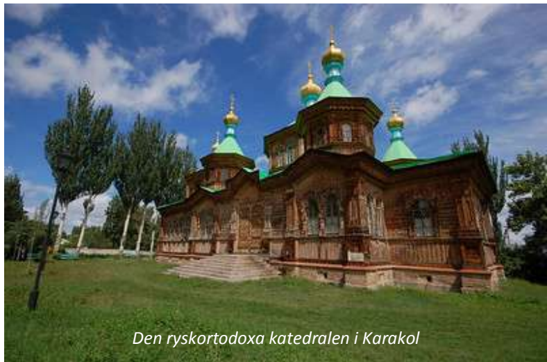
Den ryskortodoxa katedralen i Karakol

På förmiddagen väntar en stadsrundtur i Karakol, en stad med cirka 70 000 invånare framför allt känt för sina äppelodlingar, men även för sin ryskortodoxa katedral som stod färdig 1895. Karakol är en bördig trädgårdsstad med små bruna trähus och gator kantade av popplar. Här besöker ni även andra intressanta sevärdheter, bland annat Dunganmoskén, en vacker byggnad som mer ser ut som ett buddhisttempel än en moské. Den färdigställdes 1910