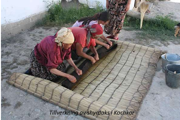
Tillverkning av shyrdaks i Kochkor

Ni lämnar idag Song-Kölsjön och körs österut mot Kochkor. Denna stad är känd för sina vackra shyrdaks , de traditionella tovade ullmattorna; även ak-kalpak , de hattar som många kirgiziska män bär, tillverkas på samma sätt. Ni får se hur man tillverkar dessa vackra mattor och lägger in mönster i olika färger. Den färdiga mattan pressas sedan ihop i en bastmatta och utsätts för hård behandling; ofta binder man fast paketet efter en häst. När den sedan rullas ut igen hängs den på