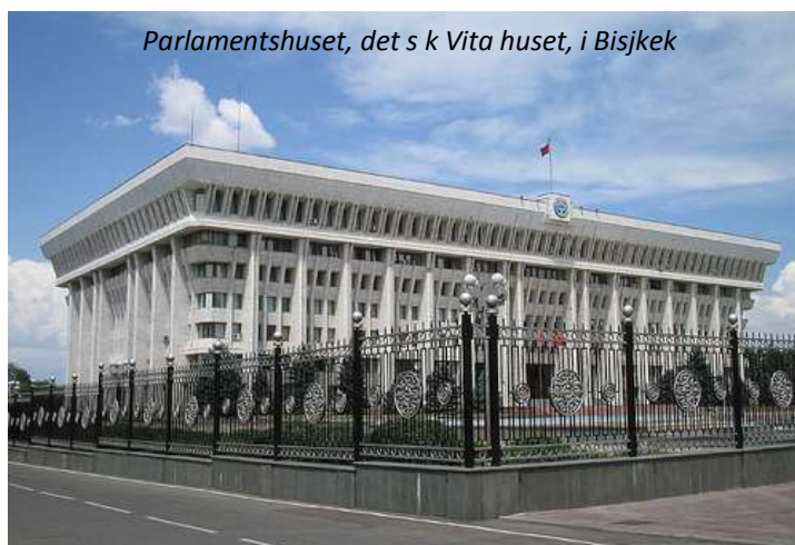
Parlamentshuset, det s k Vita huset, i Bisjkek

Ni landar på natten, möts vid ankomsten och körs till ert centralt belägna hotell. Vi har lagt in kostnaden för tidig incheckning i resans pris. Förmiddagen är sedan ledig för att ta igen er efter resan och på eftermiddagen hämtas ni på hotellet för en stadsrundtur. Staden hette Frunze under sovjettiden, men man tog efter självständigheten tillbaka det kirgiziska namnet. Här finns breda gator, myllrande basarer och gröna parker. Trots det har staden starka spår av sovjettiden och är en av de få