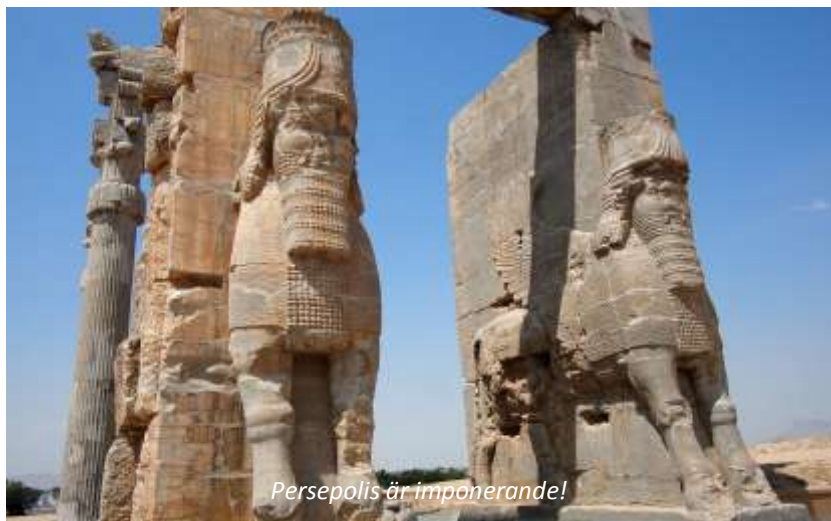
Persepolis är imponerande!

Dareios I, flyttade den till Persepolis. Parsagadae är sedan 2004 uppsatt på Unescos världsarvslista och det 1,6 km 2 stora arkeologiska området innehåller bland annat en byggnad som man tror är