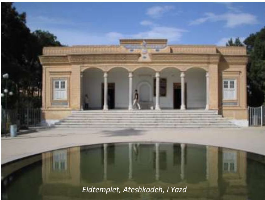
Eldtemplet, Ateshkadeh, i Yazd

Idag väntar en stadsrundtur i Yazd, som är en av Irans mest intressanta städer. Yazd har alltid varit ett centrum för zoroastrismen, en av världens äldsta monoteistiska religioner. I zoroastrismen spelar elden en stor roll och ni börjar dagen med att besöka eldtemplet Ateshkadeh; elden som brinner här sägs ha brunnit oavbrutet sedan 400-talet e Kr. Ni fortsätter till en av Yazds verkliga pärlor; Jamehmoskén, som byggdes redan på 1100-talet men som byggdes om