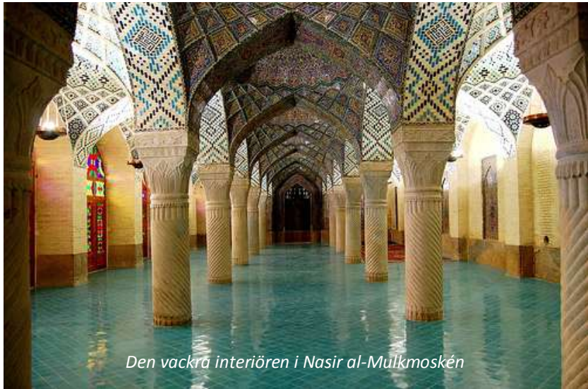
Den vackra interiören i Nasir al-Mulkmoskén