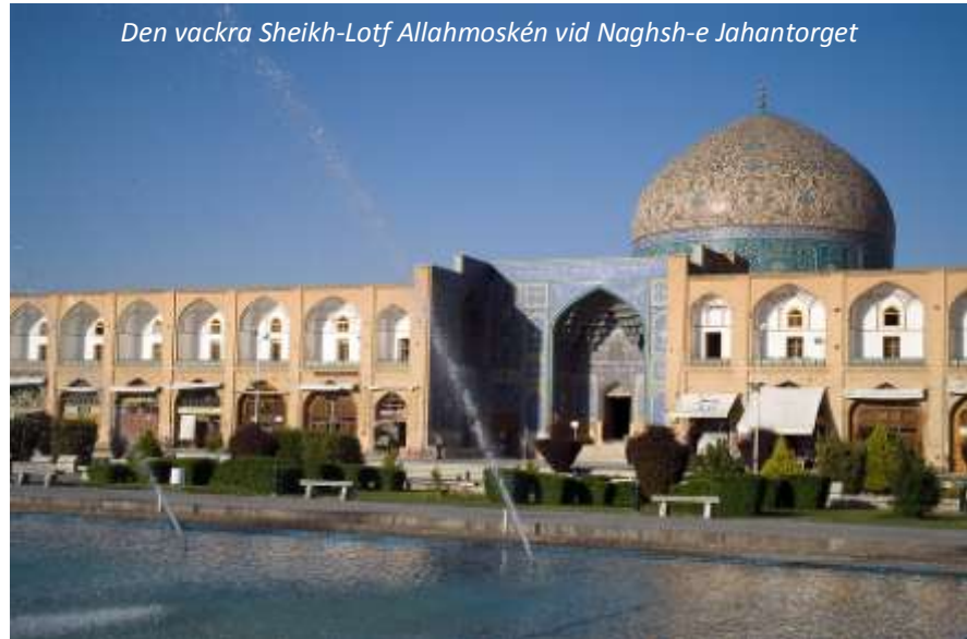
Den vackra Sheikh-Lotf Allahmoskén vid Naghsh-e Jahantorget

Ni kommer idag att göra en stadsrundtur i denna vackra stad. Isfahan är utan tvekan den stad som bäst representerar persisk arkitektur och hantverk. "Isfahan är halva världen" lyder ett gammalt talesätt som visar på stadens betydelse, dels som persisk huvudstad under safaviderna och dels för det strategiska läget vid den gamla karavanvägen mellan Persiska viken och Teheran. Dessutom