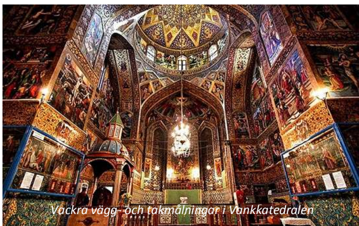
Vackra vägg- och takmålningar i Vankkatedralen

Er stadsrundtur i Isfahan fortsätter på morgonen då ni först besöker Vankkatedralen i stadsdelen Djolfa. Denna katedral uppfördes under Kung Shah Abbas I till förmån för de många armeniska immigranter som varit på flykt efter Ottomanska kriget, 1603-1605. Armenierna har full frihet att utöva sin kristna religion mitt inne i det annars islamska Iran. Katedralen är en blandning av islamisk-persisk och kristen-europeisk stil och de dekorativa interiörerna är magnifika!