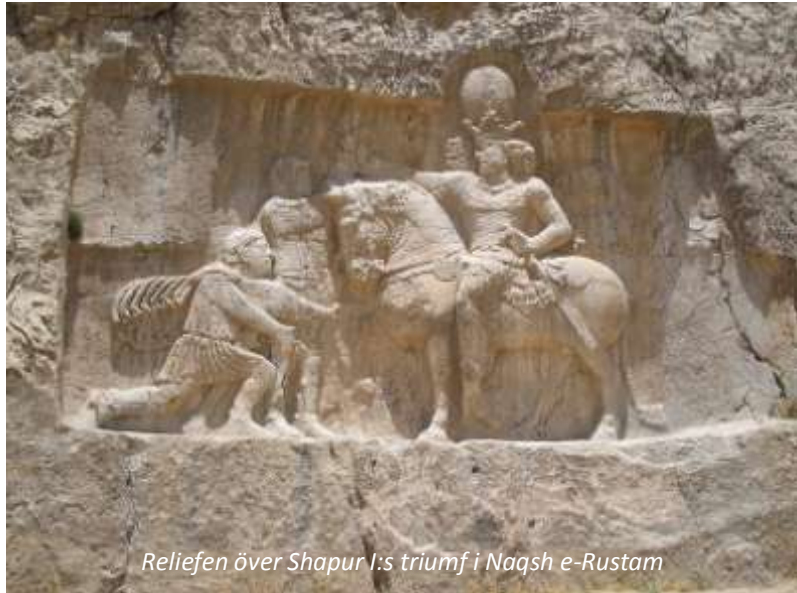
Reliefen över Shapur I:s triumf i Naqsh e-Rustam

Kyros II:s mausoleum, fästningen Toll-e Takht och lämningarna efter två kungliga palats och deras trädgårdar. Härifrån fortsätter ni färden till en av resan absoluta höjdpunkter; den närliggande staden Persepolis, också den uppsatt på Unescos världsarvslista. Persepolis blev aldrig helt klart och byggandet höll på ända fram till att perserriket erövrades 331 f Kr av Alexander den Store, som delvis lät förstöra staden. De arkeologiska lämningarna från det stora palatskomplexet och, framför allt, de många