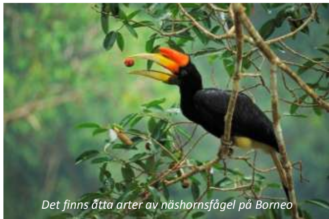
Det finns åtta arter av näshornsfågel på Borneo

Ännu en dag i denna fantastiska nationalpark! Ni stävar längre in än de flesta kommer och därför är också möjligheterna att se såväl orangutanger som andra arter större än annars. Ni gör flera stopp för vandringar i regnskogen under dagen. Under dagarna här kommer ni verkligen att se att Borneo kan uppvisa en av världens största biologiska mångfald. Enligt Världsnaturfonden så har ön sju ekoregioner, omkring 15 000 växtarter varav 3 000 trädarter, 221 arter landdäggdjur och 420 arter av häckande fåglar – nästan dubbelt så många som i Sverige! Det finns flera endemiska eller halvendemiska (endemisk är en art om den endast lever inom ett begränsat område) arter; orangutang samt mycket sällsynta arter som trädleoparden, asiatisk elefant och Sumatranoshörning.