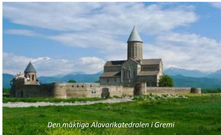
Den mäktiga Alavarikatedralen i Gremi

Efter frukost åker ni till det antika Gremi som var huvudstad under 1500- och 1600-talet i det dåvarande kungadömet Kakheti. Den var känd som en livlig handelsplats och en del av dåtida Sidenvägen, innan den förstördes av perserna 1615 för att därefter aldrig återfå sin betydelse som viktig knutpunkt i regionen. Gremiborgen och Ärkeänglarnas kyrka ligger vackert på en höjd med utsikt över de många vingårdarna som ligger tätt i landskapet nedanför. Ni ser även