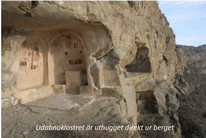
Udabnoklostret är uthugget direkt ur berget

Vi törs lova att dagens första attraktion kommer att bli en av resans absoluta höjdpunkter: David Gareja-klostret. Detta magnifika kloster grundades av en man med samma namn, en av de 13 syriska fäderna, på 500-talet. De högs ut ur kalkstensklipporna vilket ger hela klosterområdet en närmast överklig känsla. Strax efter grundandet så blev David Gareja ett viktigt pilgrimsmål, då det sades att en tredjedel av Jerusalems andliga skatter förvarades här. Även om David Gareja i sig är imponerande, så väntar det bästa på