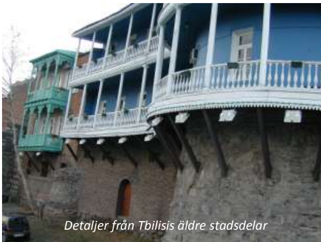
Detaljer från Tbilisis äldre stadsdelar

Ni landar i Tbilisi, Georgiens huvudstad, på natten. Ni möts vid ankomsten och körs till ert hotell, som ligger mycket centralt. Efter några välbehövliga timmars morgonvila hämtas ni för en stadsrundtur i denna intressanta och mycket charmiga stad. Det är förvånande att så mycket finns kvar av Tbilisis äldre stadsdelar; staden har plundrats och erövrats runt 30 gånger de senaste 1 500 åren. Tbilisi, som var en viktig knutpunkt längs Sidenvägen, ligger väldigt vackert, i en dalgång med floden Mtkvari rinnande genom staden. Ni kommer att se både de moderna och gamla stadsdelarna, samt besöka historiska museet