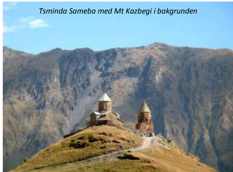
Tsminda Sameba med Mt Kazbegi i bakgrunden

Ni lämnar Tbilisi bakom er och körs norrut. Efter bara en halvtimmes resa når ni Mtskheta, Georgiens gamla huvudstad, som ligger där floderna Mtkvari och Aragvi möts. Staden är nästan 4 000 år gammal och är en av världens äldsta kontinuerligt bosatta städer. Mtskheta var huvudstad mellan 500 f Kr och 500 e Kr, då Tbilisi tog över denna roll. Staden är dock fortfarande något av Georgiens religiösa huvudstad och ni besöker landets viktigaste katedral, Sveti-Tskhoveli, som byggdes i början av 1000-talet. Här ligger många av