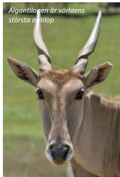
Älgantilopen är världens största antilop

Mihingo Lodge (3*). Frukost, lunch, middag.