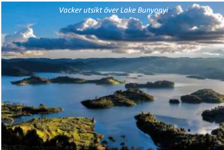
Vacker utsikt över Lake Bunyonyi

Lake Bunyonyi, som betyder sjön med många små fåglar , gör skäl för sitt namn. Denna sjö, som är Ugandas djupaste med ett maxdjup på hela 900 meter enligt sägen, är också enligt många landets vackraste. Den ligger på nästan 2 000 meters höjd nära gränsen till Rwanda och har flera mindre öar. Den mest kända av dessa är Punishment Island, där ogifta, gravida kvinnor brukade lämnas som straff. Antingen dog de av hunger eller drunknade när de försökte fly från ön. Män som inte hade råd att