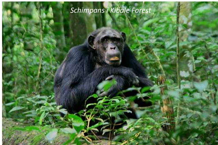
Schimpans i Kibale Forest

På förmiddagen väntar en av resans höjdpunkter; ni ger er av med en erfaren guide för att leta efter någon av nationalparkens schimpansgrupper. Totalt finns mer än 500 schimpanser i Kibale, men det kan ändå ta ett tag innan ni hittar dem. Men det är mödan värt; när man sitter vid dessa fascinerande djur, våra närmaste släktingar, förundras man över deras intelligens, lekfullhet och sociala förmåga. På eftermiddagen gör ni en utflykt till de närbelägna våtmarkerna vid Bigodi som har ett fantastiskt fågelliv; glöm inte kikaren! Ni letar också efter flera primatarter, som den vackra östliga svartvita guerezan och den sällsynta L'Hoests apa. Om ni har tur ser ni också den endemiska, det vill säga den finns bara här, fågelarten Prirogrine's trast.