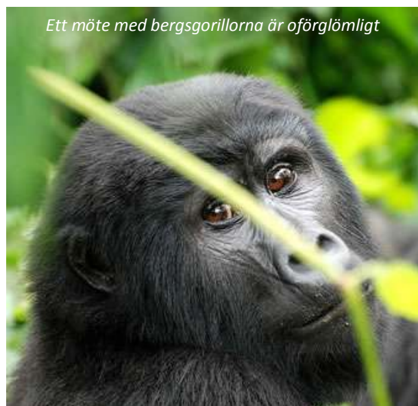
Ett möte med bergsgorillorna är oförglömligt

På morgonen ger ni er ut på en ny game drive. Förutom de trädklättrande lejonet så är Ishasha känt för sina stora hjordar med afrikansk buffel samt Ugandakob. Lake Edward i området har den största flodhästpopulationen i världen och även vattenbock, buskbock och topi ses ofta. Ni körs sedan vidare till Bwindi Impenetrable nationalpark, en resa på cirka 63 km som tar ungefär 2½ timme. Bwindi är en fantastisk nationalpark; inte särskilt stor, bara 331 km 2 , men med en enorm mångfald som kommer sig av att höjden i parken varierar mellan 1 160 och 2 607 m ö h. Här finns hela 90 däggdjursarter och imponerande 23 endemiska fågelarter. Men orsaken till varför man kommer hit är framför allt en; högländsgorillorna. Uganda och grannländerna Rwanda och Kongo-Kinshasa är de enda platserna i världen där man kan se dessa primater. När ni kommer fram har ni resten av eftermiddagen ledig.