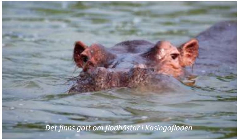
Det finns gott om flodhästar i Kazingafloden

Hela dagen är vikt åt denna 1 995 km 2 stora nationalpark. På förmiddagen ger ni er ut på en game drive och ni kommer åter till er lodge för lunch. De bästa timmarna för att se djuren är före klockan 10 och efter klockan 16, så efter lunchen har ni ett par timmar ledigt. På eftermiddagen ger ni er sedan ut på en båttur på Kazingakanalen. Här finns goda möjligheter att se många arter av fåglar samt flodhäst och krokodil!