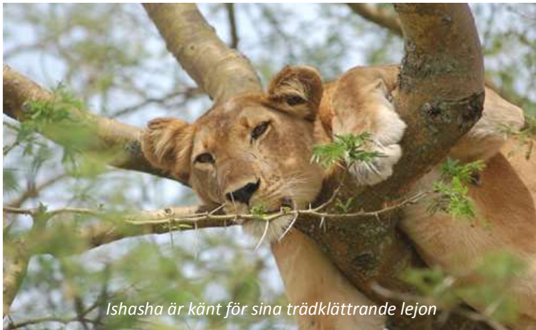
Ishasha är känt för sina trädklättrande lejon

Ni åker idag söderut genom denna magnifika nationalpark och gör game drive på vägen. Naturen skiljer sig åt avsevärt mellan olika delar av parken, vilket ni märker när ni så småningom når Ishasha i den sydvästra delen av nationalparken (cirka 97 km, ungefär tre timmars resa). Ishasha karakteriseras av savann, så möjligheterna att se djuren här är ännu bättre än i övriga Queen Elizabeth. På eftermiddagen gör ni en game drive och håller framför