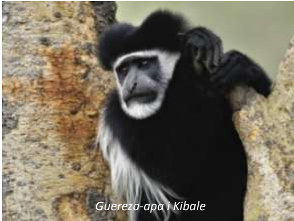
Guereza-apa i Kibale

Efter frukost hämtas ni på hotellet och körs västerut till en av Ugandas, och Afrikas, främsta nationalparker: Kibale Forest. Resan är på totalt 358 km och tar cirka sex timmar, men ni gör stopp längs vägen. Denna 766 km 2 stora nationalpark är mest känd för sina primater; faktiskt är detta den nationalpark i världen som har störst antal primater per km 2 ! Här finns 12 arter, men det är chimpanserna som är den största attraktionen. Utöver detta finns ett rikt fågelliv; på dessa 766 km 2 finns minst 340 arter, vilket är mer än i hela Sverige. På eftermiddagen har ni möjlighet att göra en promenad längs