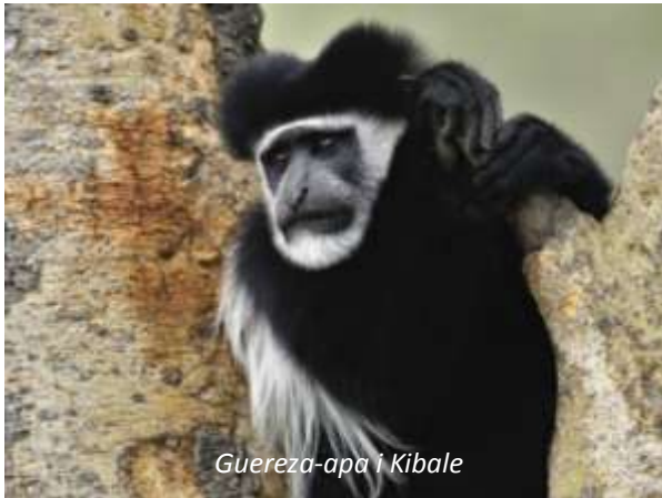
Guereza-apa i Kibale

Efter frukost hämtas ni på hotellet och körs västerut till en av Ugandas, och Afrikas, främsta nationalparker: Kibale Forest. Resan är på totalt 358 km och tar cirka sex timmar, men ni gör stopp längs vägen. Denna 766 km 2 stora nationalpark är mest känd för sina primater; faktiskt är detta den nationalpark i världen som har störst antal primater per km 2 ! Här finns 12 arter, men det är chimpanserna som är den största attraktionen. Utöver detta finns ett rikt fågelliv; på dessa 766 km 2 finns minst 340 arter, vilket är mer än i hela Sverige. På eftermiddagen har ni möjlighet att göra en promenad längs