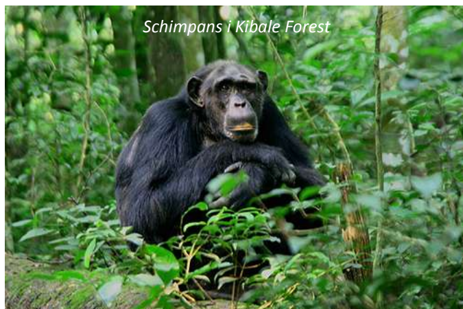
Schimpans i Kibale Forest

På förmiddagen väntar en av resans höjdpunkter; ni ger er av med en erfaren guide för att leta efter någon av nationalparkens schimpans-grupper. Totalt finns mer än 500 schimpanser i Kibale, men det kan ändå ta ett tag innan ni hittar dem. Men det är mödan värt; när man sitter vid dessa fascinerande djur, våra närmaste släktingar, förundras man över deras intelligens, lekfullhet och sociala förmåga. På eftermiddagen gör ni en utflykt till de närbelägna våtmarkerna vid Bigodi som har ett fantastiskt fågelliv; glöm inte kikaren! Ni letar också efter flera primatarter, som den vackra östliga svartvita guerezan och den sällsynta L'Hoests apa. Om ni har tur ser ni också den endemiska, det vill säga den finns bara här, fågelarten Prirogrine's trast.