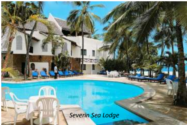
Severin Sea Lodge

Ni lämnar idag Masai Mara, men passar naturligtvis på att spana efter djur och fåglar på väg ut genom nationalparken. Ni körs sedan direkt till flygplatsen utanför Nairobi, varifrån ni flyger till Mombasa vid kusten. Ni möts vid ankomsten och körs direkt till Bamburi Beach, som ligger 20 km från flygplatsen och 12 km norr om Mombasa. Här väntar er några härliga avkopplande dagar vid den kritvita stranden!