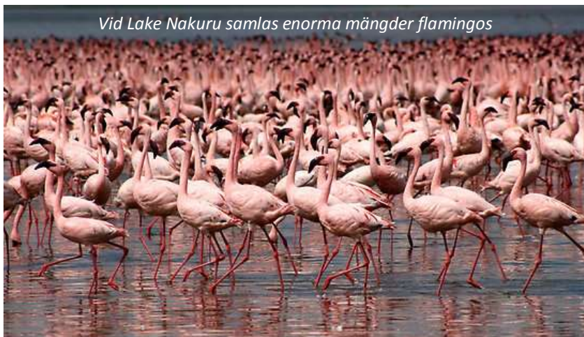
Vid Lake Nakuru samlas enorma mängder flamingos

Ni hämtas på hotellet efter frukost och körs västerut till er lodge som ligger i den vackra nationalparken Lake Nakuru. Denna sjö är, tillsammans med två närliggande sjöar, uppsatt på Unescos världsarvslista sedan 2011. På vägen stannar ni för att ta in de mäktiga vyerna över Great Rift Valley, dvs den stora förkastningsspricka som löper genom den västra