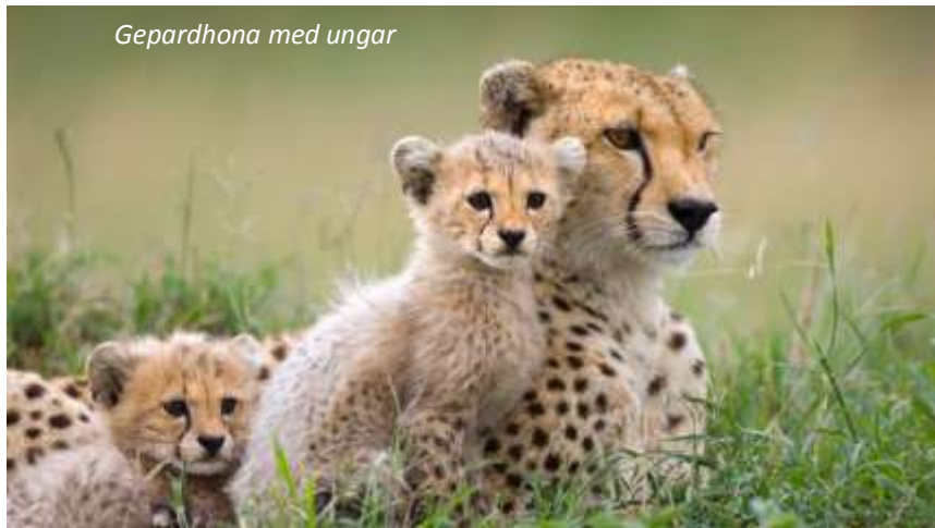
Gepardhona med ungar

Dagens första gamedrive i Masai Maras nationalpark startar i gryningen, då djur och fåglar är som mest aktiva, och ni kommer att få uppleva möten med ett flertal däggdjursarter från er safarijeep. Två permanenta floder skär genom landskapet: Marafloden och Talekfloden. Längs Marafloden finns ett antal platser där de vandrande hjordarna