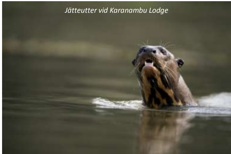
Jätteuttrar vid Karanambu Lodge