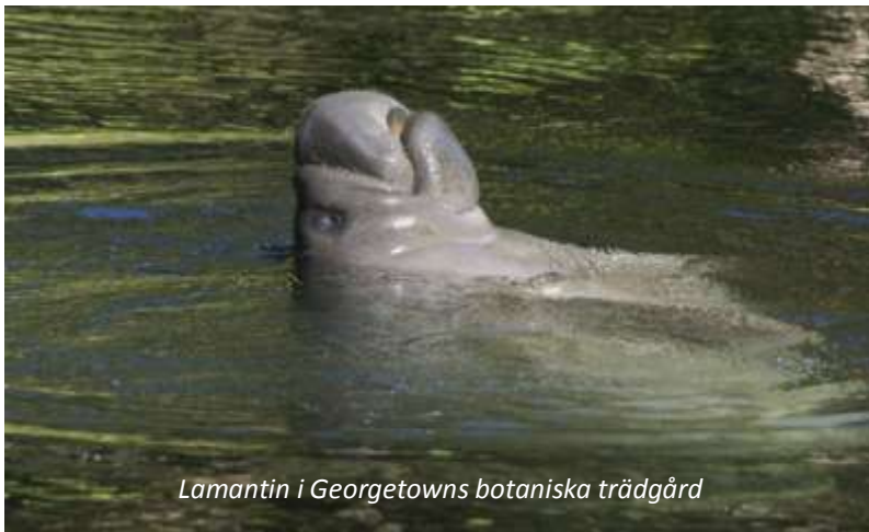
Lamantin i Georgetowns botaniska trädgård

Vi åker ut till flygplatsen efter en tidig frukost för att flyga västerut till Georgetown, huvudstad i grannlandet Guyana. Här möts vi och körs till vårt mycket centralt belägna hotell, som är stadens mest anrika då det byggdes redan på 1840-talet. Georgetown har idag cirka 240 000 invånare, inklusive förorter, och är Guyanas enda större stad. Namnet Guyana kommer från ett indianskt ord som betyder "vattnens land", vilket stämmer alldeles förträffligt då Guyana är ett av världens tio vattenrikaste länder.