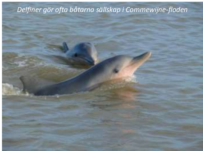
Delfiner gör ofta båtarna sällskap i Commewijne-floden

Vi ger oss idag ut för att utforska Paramaribos vackra omgivningar. Vi åker österut till Commewijnedistriktet och ser längs vägen flera gamla plantager från kolonialtiden, varav de flesta idag är övergivna. Vi stannar vid en av de äldsta, Peperpot. Denna är fortfarande i näst intill ursprungsskick och vi tar en tur i den gamla gårdsbyggnaden samt på ägor, där vi ser kaffe- och kakaobuskar. Besöket här ger en fascinerande inblick i hur livet såg ut på 1700- och 1800-talen, då stora mängder slavar fördes från Afrika hit för att arbeta under hemska förhållanden på plantagerna. När slaveriet avskaffades på senare hälften av 1800-talet, kom istället många arbetare från