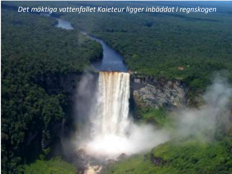
Det mäktiga vattenfallet Kaieteur ligger inbäddat i regnskogen

vackra fotografier. När vi kommer fram till Kaieteur så tar piloten en extra runda för att ge oss en oförglömlig utsikt över detta mäktiga vattenfall, som med sina 226 obrutna meter är ett av världens högsta - till exempel fem gånger högre än Niagarafallen och mer än dubbelt så högt som Victoriafallen. Minst lika imponerande är naturen runt omkring fallet, som består av primär regnskog (primär innebär att den aldrig har varit nedhuggen, sekundär att den är återupp vuxen efter att en gång ha huggits ner). Kaieteur ligger i en nationalpark med samma namn och denna har en av världens högsta