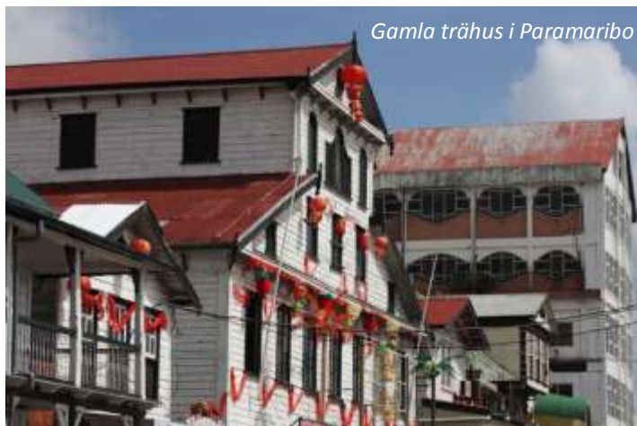
Gamla trähus i Paramaribo

Efter en ledig förmiddag så ger vi oss ut på en stadsrundtur i denna intressanta stad. Det var britterna som grundade staden 1630 och 1650 blev Paramaribo huvudstad för Brittiska Guyana. Området skiftade sedan styre många gånger mellan britterna och holländarna, men från 1815 och fram till självständigheten 1975 styrdes Surinam från Holland. Trots ett par stora eldsvådor under 1800-talet så finns många vackra trähus i typisk holländsk och brittisk kolonialstil kvar och 2002 sattes Paramaribos stadskärna upp på Unescos lista över världsarv. Vi utforskar staden både med bil och till fots och ser de främsta sevärdheterna, som Fort Zeelandia, presidentpalatset, självständighetstorget med mera. Eco Resort Inn (3*). Frukost.