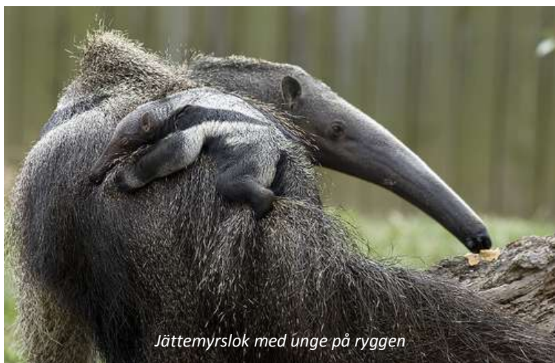
Jättemyrslok med unge på ryggen

På morgonen ger vi oss ut på de böljande gräsmarkerna i närheten av lodgen för att skåda efter jättemyrslok - som namnet antyder är detta den största arten av de fyra arterna av myrslokar och kan väga upp emot 40 kilo. Området runt Karanambu är en av de bästa platserna att se detta säregna djur, som lever helt och hållet på myror och termiter. De gräver hål i termitstackarna där de sedan stoppar in sin långa och klibbiga tunga som termiterna fastnar på. Hanarna kan faktiskt bli mer än två meter långa. Vi