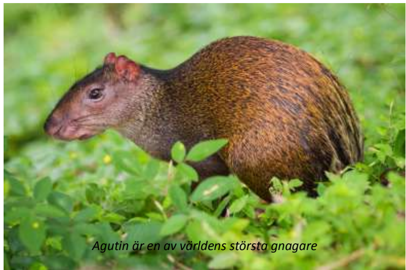
Agutin är en av världens största gnagare

Hela dagen är vikt för promenader med lodgens kunniga guider. Fågellivet här är fantastiskt och vi har möjlighet att se flera vackra och intressanta arter, som till exempel karmosintopas, guyanatukanett, svart hocko, rostbukad markgök och både grön och svarthalsad aracari - för att bara nämna några! Vi börjar dagen i gryningen vid hängbroarna för att se djungeln vakna till liv. Vi kommer sedan åter till lodgen och har tid för att med någon av lodgens utmärkta guider gå längs någon av de många väl utmärkta leder som omger Atta. För den som är intresserad av floran finns plaketter med förklaring av de arter som ni ser, mångfalden i regnskogen är imponerande. Längs dessa leder har vi möjlighet att bland annat se aguti, som är en av världens största gnagare. För dig som är ornitolog så rekommenderar vi att se noga i snårskogen där det finns chans att se den hett eftertraktade rostvingade markgöken. På kvällen har vi möjlighet att ta en promenad för att bland annat spana efter den fantastiskt välkamouflerade vitvingade poton.