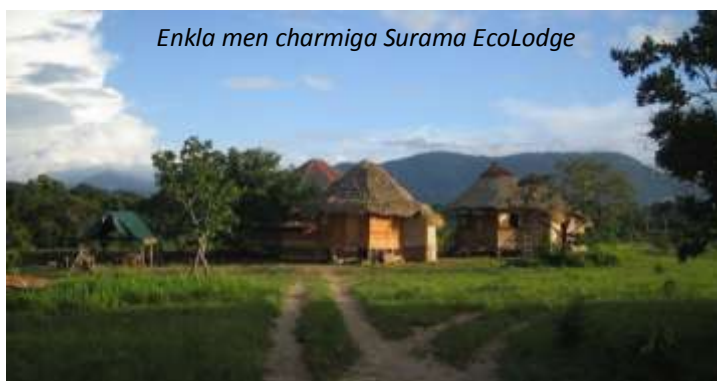
Enkla men charmiga Surama EcoLodge

I gryningen tar vi en promenad vid foten av Pakaraimabergen längs den så kallade Panoramaleden. Stigen gör skäl för sitt namn, utsikten över savannen och byarna nedanför när solen går upp är oförglömlig! Vi har goda möjligheter att se många fågelarter, som till exempel Finchs euphonia, rosteremit, gulnäbbad jakamar och rostbukig myrsmyg, samt höra vrålapornas kraftiga rop. Efter frukost på lodgen fortsätter vi till byn Surama, som ligger på ett litet savannområde omgivet av tät regnskog. 1812 passerade den brittiske forskaren Charles Waterton genom Surama i jakt efter hemligheten runt curare , det gift som indianerna använder till sina pilar. Han skrev senare i en bok att "inte ens den finaste parken i England kan tävla med detta områdes skönhet". Suramas