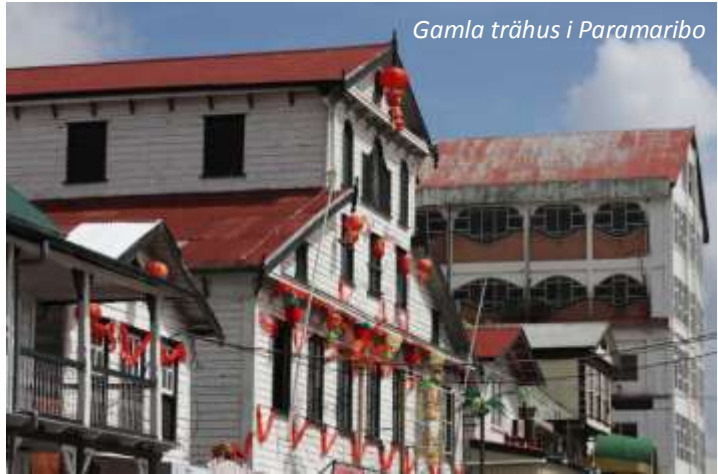
Gamla trähus i Paramaribo

Efter en ledig förmiddag så ger vi oss ut på en stadsrundtur i denna intressanta stad. Det var britterna som grundade staden 1630 och 1650 blev Paramaribo huvudstad för Brittiska Guyana. Området skiftade sedan styre många gånger mellan britterna och holländarna, men från 1815 och fram till självständigheten 1975 styrdes Surinam från Holland. Trots ett par stora eldsvådor under 1800-talet så finns många vackra trähus i typisk holländsk och brittisk kolonialstil kvar och 2002 sattes Paramaribos stadskärna upp på Unescos lista över världsarv. Vi utforskar staden både med bil och till fots och ser de främsta sevärdheterna, som Fort Zeelandia, presidentpalatset, självständighetstorget med mera. Eco Resort Inn (3*). Frukost.