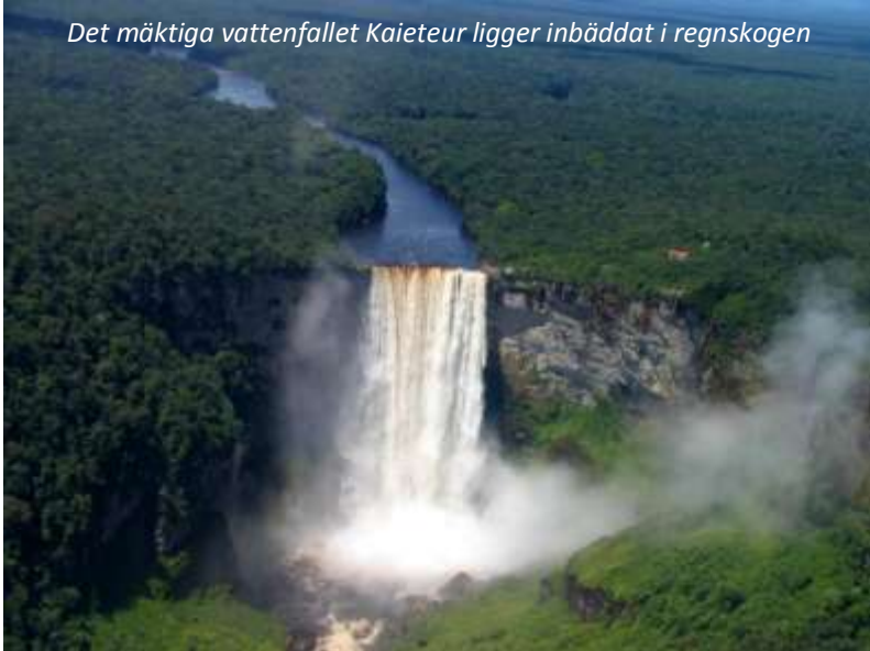
Det mäktiga vattenfallet Kaieteur ligger inbäddat i regnskogen

vackra fotografier. När vi kommer fram till Kaieteur så tar piloten en extra runda för att ge oss en oförglömlig utsikt över detta mäktiga vattenfall, som med sina 226 obrutna meter är ett av världens högsta - till exempel fem gånger högre än Niagarafallen och mer än dubbelt så högt som Victoriafallen. Minst lika imponerande är naturen runt omkring fallet, som består av primär regnskog (primär innebär att den aldrig har varit nedhuggen, sekundär att den är återupp vuxen efter att en gång ha huggits ner). Kaieteur ligger i en nationalpark med samma namn och denna har en av världens högsta