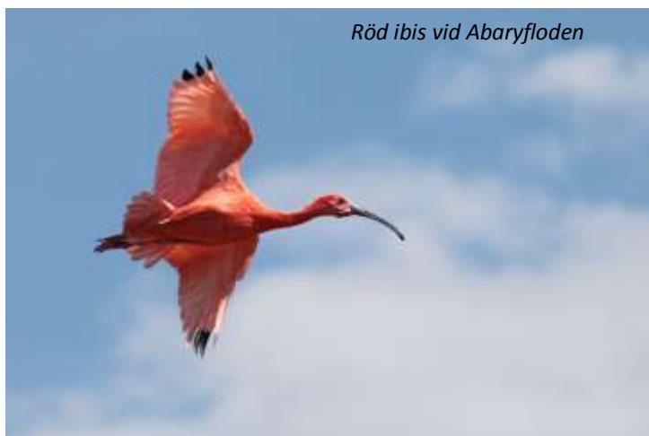
Röd ibis vid Abaryfloden

Efter frukost lämnar vi huvudstaden och reser österut till Abaryfloden, känt för sitt rika fågelliv. Detta är ett av de bästa områdena att se blodspetten, en hackspettsart som endast lever i en smal remsa längsmed Sydamerikas norra kust. Vi har även möjligheter att se andra eftertraktade arter, som till exempel krabbvråk och den vitbukade dvärgspetten. På vägen tillbaka till Georgetown så stannar vi vid ett område med några lerpölar för att se flera arter av vadarfåglar, bland annat den mycket vackra röda ibisen, amerikansk saxnäbb, brun pelikan och praktfregattfågel.