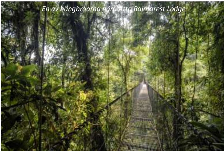
En av hängbroarna nära Atta Rainforest Lodge

Vi går upp tidigt på morgonen för att ta en båtutflykt längs floden. Vi spanar efter jätteuttrar, svarta kajmaner och färgglada tukaner bland mycket annat! Vi kommer sedan åter till lodgen för frukost. Sedan lämnar vi Iwokrama och fortsätter resan mot Atta - håll ögonen öppna under resan då denna sträcka är känd för att vara en av de bästa i Guyana för att se jaguar. Naturligtvis krävs det dock mycket tur för att se detta magnifika kattdjur då de är skygga och huvudsakligen nattaktiva. Området runt Atta Rainforest lodge är också en av de bästa platserna i