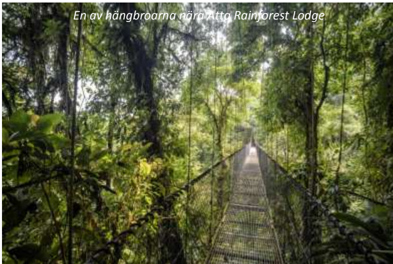
En av hängbroarna nära Atta Rainforest Lodge

Vi går upp tidigt på morgonen för att ta en båtutflykt längs floden. Vi spanar efter jätteuttrar, svarta kajmaner och färgglada tukaner bland mycket annat! Vi kommer sedan åter till lodgen för frukost. Sedan lämnar vi Iwokrama och fortsätter resan mot Atta - håll ögonen öppna under resan då denna sträcka är känd för att vara en av de bästa i Guyana för att se jaguar. Naturligtvis krävs det dock mycket tur för att se detta magnifika kattdjur då de är skygga och huvudsakligen nattaktiva. Området runt Atta Rainforest lodge är också en av de bästa platserna i