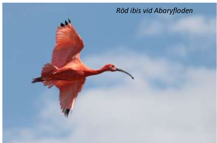
Röd ibis vid Abaryfloden

Efter frukost lämnar vi huvudstaden och reser österut till Abaryfloden, känt för sitt rika fågelliv. Detta är ett av de bästa områdena att se blodspetten, en hackspettsart som endast lever i en smal remsa längsmed Sydamerikas norra kust. Vi har även möjligheter att se andra eftertraktade arter, som till exempel krabbvråk och den vitbukade dvärgspetten. På vägen tillbaka till Georgetown så stannar vi vid ett område med några lerpölar för att se flera arter av vadarfåglar, bland annat den mycket vackra röda ibisen, amerikansk saxnäbb, brun pelikan och praktfregattfågel.