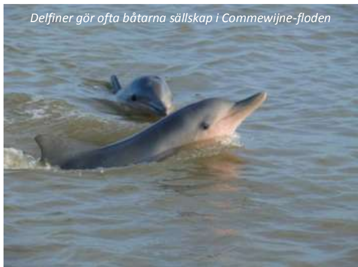
Delfiner gör ofta båtarna sällskap i Commewijne-floden

Vi ger oss idag ut för att utforska Paramaribos vackra omgivningar. Vi åker österut till Commewijnedistriktet och ser längs vägen flera gamla plantager från kolonialtiden, varav de flesta idag är övergivna. Vi stannar vid en av de äldsta, Peperpot. Denna är fortfarande i näst intill ursprungsskick och vi tar en tur i den gamla gårdsbyggnaden samt på ägor, där vi ser kaffe- och kakaobuskar. Besöket här ger en fascinerande inblick i hur livet såg ut på 1700- och 1800-talen, då stora mängder slavar fördes från Afrika hit för att arbeta under hemska förhållanden på plantagerna. När slaveriet avskaffades på senare hälften av 1800-talet, kom istället många arbetare från