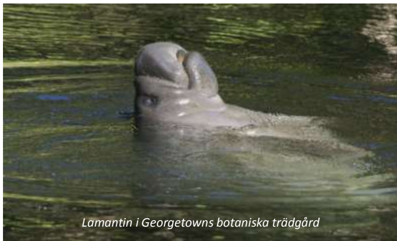
Lamantin i Georgetowns botaniska trädgård

Vi åker ut till flygplatsen efter en tidig frukost för att flyga västerut till Georgetown, huvudstad i grannlandet Guyana. Här möts vi och körs till vårt mycket centralt belägna hotell, som är stadens mest anrika då det byggdes redan på 1840-talet. Georgetown har idag cirka 240 000 invånare, inklusive förorter, och är Guyanas enda större stad. Namnet Guyana kommer från ett indianskt ord som betyder "vattnens land", vilket stämmer alldeles förträffligt då Guyana är ett av världens tio vattenrikaste länder.