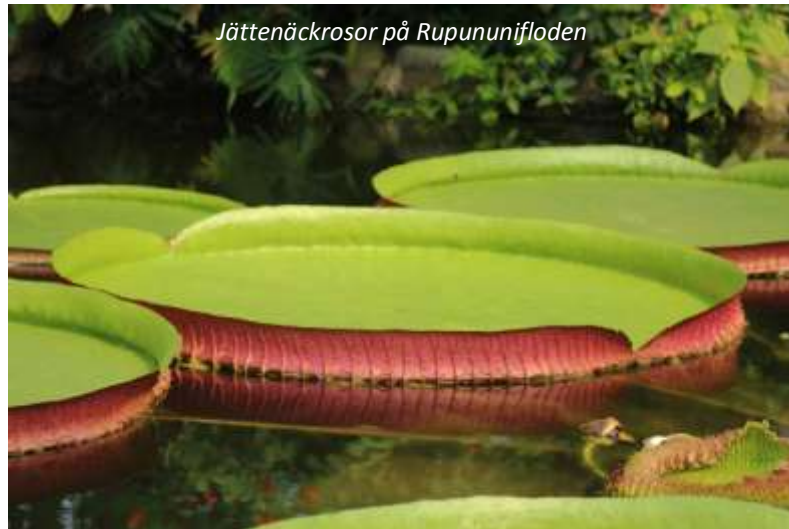
Jättenäckrosor på Rupununifloden