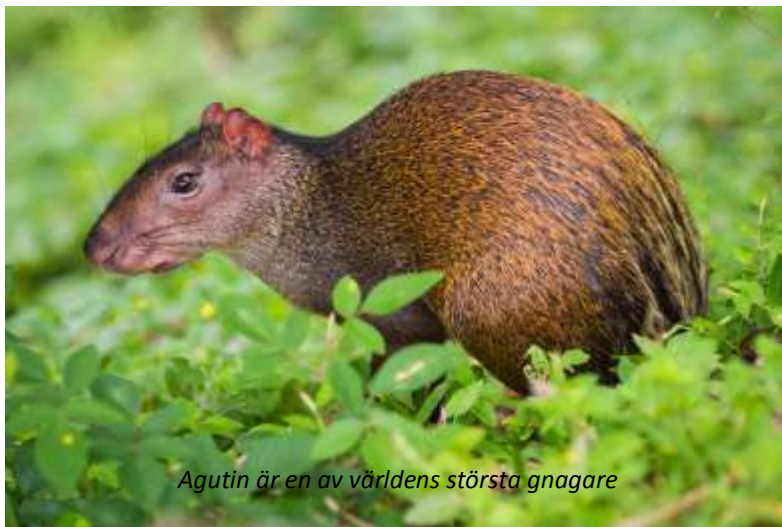
Agutin är en av världens största gnagare

Hela dagen är vikt för promenader med lodgens kunniga guider. Fågellivet här är fantastiskt och vi har möjlighet att se flera vackra och intressanta arter, som till exempel karmosintopas, guyanatukanett, svart hocko, rostbukad markgök och både grön och svarthalsad aracari - för att bara nämna några! Vi börjar dagen i gryningen vid hängbroarna för att se djungeln vakna till liv. Vi kommer sedan åter till lodgen och har tid för att med någon av lodgens utmärkta guider gå längs någon av de många väl utmärkta leder som omger Atta. För den som är intresserad av floran finns plaketter med förklaring av de arter som ni ser, mångfalden i regnskogen är imponerande. Längs dessa leder har vi möjlighet att bland annat se aguti, som är en av världens största gnagare. För dig som är ornitolog så rekommenderar vi att se noga i snårskogen där det finns chans att se den hett eftertraktade rostvingade markgöken. På kvällen har vi möjlighet att ta en promenad för att bland annat spana efter den fantastiskt välkamouflerade vitvingade poton.