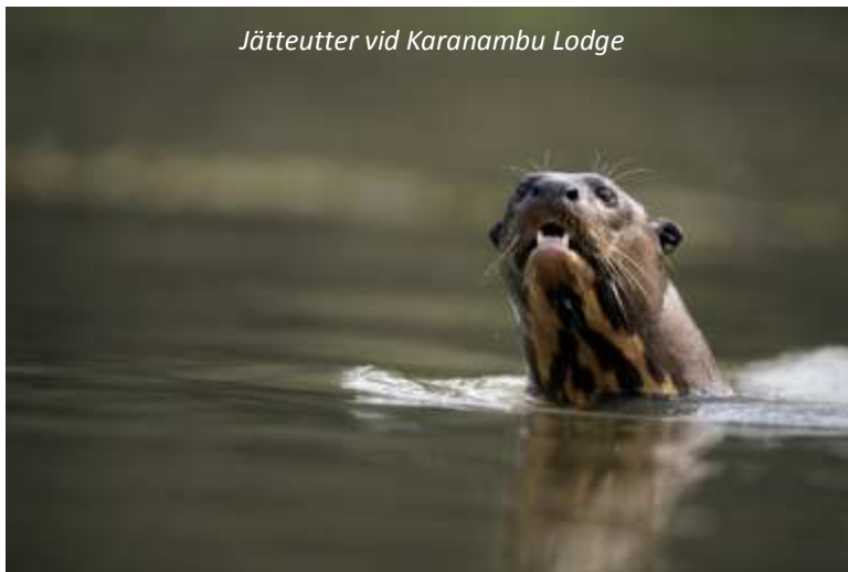
Jätteuttrar vid Karanambu Lodge