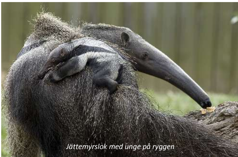
Jättemyrslok med unge på ryggen

På morgonen ger vi oss ut på de böljande gräsmarkerna i närheten av lodgen för att skåda efter jättemyrslok - som namnet antyder är detta den största arten av de fyra arterna av myrslokar och kan väga upp emot 40 kilo. Området runt Karanambu är en av de bästa platserna att se detta säregna djur, som lever helt och hållet på myror och termiter. De gräver hål i termitstackarna där de sedan stoppar in sin långa och klubbiga tunga som termiterna fastnar på. Hanarna kan faktiskt bli mer än två meter långa. Vi