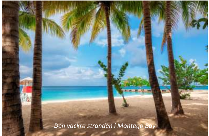
Den vackra stranden i Montego Bay