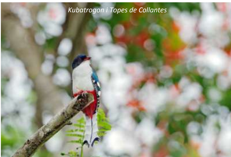
Kubatrogon i Topes de Collantes

Idag kommer vi att göra en utflykt till naturreservatet Topes de Collantes nära Trinidad. Detta område av ön är känt för sitt utmärkta kaffe och vi kommer att besöka Casa del Café, för att lära oss mer om odlingen av denna populära bönor och hur kaffet blir till. Vi kommer också att gå en vacker vandring genom den orörda naturen med en kunnig guide för att eventuellt få se Kubas nationalfågel, Kubatrogonen. Har vi inte sett bikolibrin tidigare så har vi möjlighet att se den här liksom andra vackra fåglar som den endemiska kubatodin