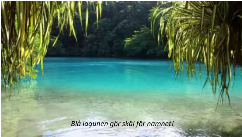
Blå lagunen gör skäl för namnet!

Resan fortsätter österut mot Port Antonio i nordost. På vägen stannar vi vid en plantage, där vi kan ta en färskpressad juice på någon tropisk frukt i säsong medan vi beundrar kolibriernas aktivitet när de suger nektar från de många blommorna. Port Antonio grundades redan 1723 och är en av Jamaicas största sevärdheter, både för sin historia och sina spektakulära omgivningar, men också på grund av sin avslappnade atmosfär. Stadens storhetstid började på 1880-talet