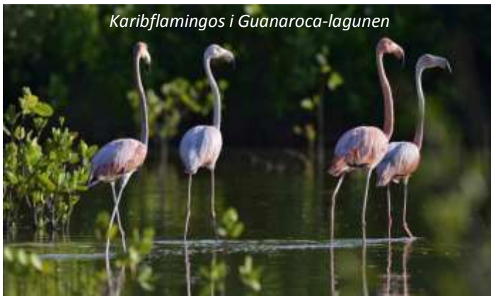
Karibflamingos i Guanaroca-lagunen

Dagens resa är cirka 120 km lång och tar oss österut till staden Cienfuegos. Efter att vi har checkat in ger vi oss ut på en stadsrundtur till fots i staden, vars arkitektur till stor del karakteriseras av palats och residens. Staden visar en för Karibien anmärkningsvärd blandning av stilar från såväl tidigt 1800-tal till 1900-tal. Cienfuegos historiska stadskärna sattes 2005 upp på världsarvslistan som det bästa kvarvarande exemplet på spanska upplysningstidens genomförda stadsplaneringar vid tiden för koloniseringen av nya