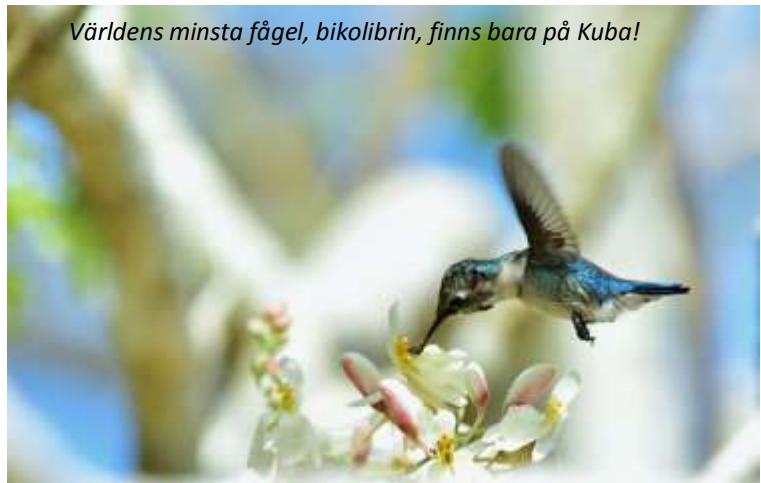
Världens minsta fågel, bikolibrin, finns bara på Kuba!

Vi går upp tidigt för att göra en utflykt till den spektakulära nationalparken Ciénaga de Zapata, känt för att vara en av världens bästa platser för fågelskådning. Här finns mer än 175 fågelarter och 22 av Kubas totalt 30 endemiska arter har påträffats i nationalparken. Några av de mest spektakulära arterna vi har möjlighet att se är landets nationalfågel, den vackra kuba-trogonen, världens minsta fågel, den endast cirka 5-6 centimeter långa bikolibrin som är endemisk för Kuba, den vackra papegojarten Kubaamazon, den endemiska Kubaparakiten och många fler.