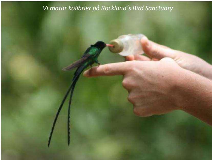
Vi matar kolibrier på Rockland's Bird Sanctuary

Idag kommer vi att upptäcka Montego Bays vackra omgivningar, som präglas av kuperad och lummig natur. Vi kommer att besöka en by för att komma vardagslivet nära och även en liten gård, där vi lär oss mer om de lokala grödorna. Till lunch väntar Jamaicas nationalrätt, jerk chicken , på Barbecue Centre. Om man skulle utse något som är typiskt för denna charmiga ö så är det just denna rätt - och reggae förstås! Det är få andra platser i världen som känns så avslappnade och vänliga som Jamaica. Överallt möts man av ett "power" eller "hey mon" och en utsträckt knytnäve till hälsning. Vi