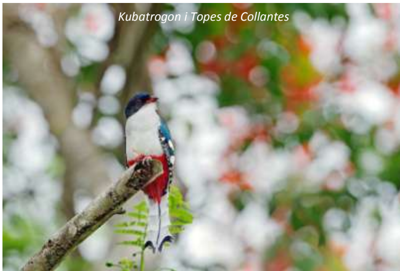
Kubatrogon i Topes de Collantes

Idag kommer vi att göra en utflykt till naturreservatet Topes de Collantes nära Trinidad. Detta område av ön är känt för sitt utmärkta kaffe och vi kommer att besöka Casa del Café, för att lära oss mer om odlingen av denna populära bön och hur kaffet blir till. Vi kommer också att gå en vacker vandring genom den orörda naturen med en kunnig guide för att eventuellt få se Kubas nationalfågel, Kubatrogonen. Har vi inte sett bikolibrin tidigare så har vi möjlighet att se den här liksom andra vackra fåglar som den endemiska kubatodin