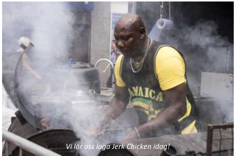
Vi lär oss laga Jerk Chicken idag!

Vi reser längsmed nordkusten till Geddes Great House, som ligger på en höjd med fantastisk utsikt över havet. Huset byggdes 1792 och att gå runt på ägorna här är som att ta ett steg tillbaka i tiden. Under vår guidning så kommer vi också att besöka fängelsehålorna där slaverna som jobbade på plantagen spärrades in efter en lång dag ute på fälten. Vi har smakat nationalrätten jerk chicken förut, men här kommer vi att få lära oss hur man gör den! Traditionellt så rökgrillas kycklingen i delade oljefat, vilket ger den en fantastisk saftighet. På vägen tillbaka till Ocho Rios så stannar vi vid Fern Gully, en plats där hela 300 arter av ormbunkar finns, samt vid hantverksmarknaden.