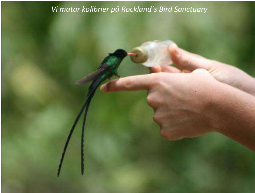
Vi matar kolibrier på Rockland's Bird Sanctuary

Idag kommer vi att upptäcka Montego Bays vackra omgivningar, som präglas av kuperad och lummig natur. Vi kommer att besöka en by för att komma vardagslivet nära och även en liten gård, där vi lär oss mer om de lokala grödorna. Till lunch väntar Jamaicas nationalrätt, jerk chicken , på Barbecue Centre. Om man skulle utse något som är typiskt för denna charmiga ö så är det just denna rätt - och reggae förstås! Det är få andra platser i världen som känns så avslappnade och vänliga som Jamaica. Överallt möts man av ett "power" eller "hey mon" och en utsträckt knytnäve till hälsning. Vi