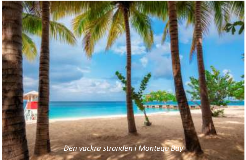
Den vackra stranden i Montego Bay