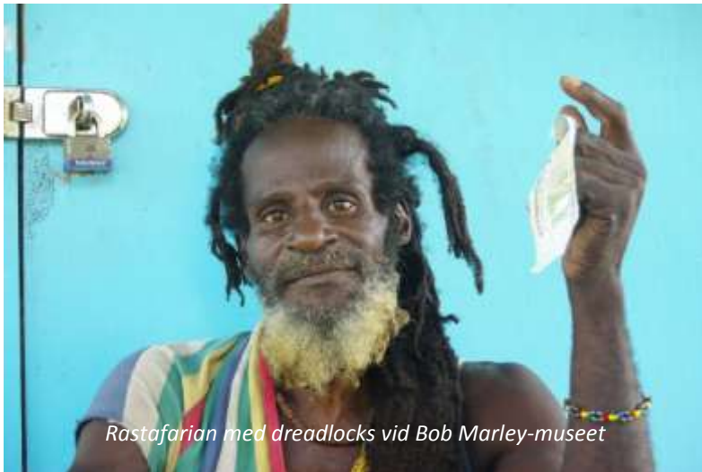
Rastafarian med dreadlocks vid Bob Marley-museet

Om du skulle nämna en person som du förknippar med Jamaica så skulle svaret säkerligen bli Bob Marley! Under våra dagar här så har du redan märkt att hans musik spelas överallt och naturligtvis är inget besök på Jamaica komplett utan ett besök i hans forna hem i Kingston, som idag är museum. Vi lämnar sedan huvudstaden bakom oss. På vägen längs den vackra södra kusten stannar vi vid de många fruktständer utanför Mandeville - en höjdpunkt med ett besök på Jamaica är de många exotiska frukterna. I Alligator Pond, som är känt för sina fantastiska fisk-