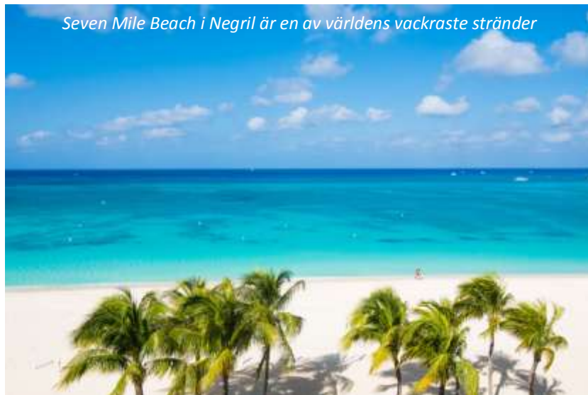
Seven Mile Beach i Negril är en av världens vackraste stränder

Vi fortsätter vår resa västerut från Treasure Beach på förmiddagen. Första stoppet idag gör vi vid YS Falls, kanske Jamaicas vackraste vattenfallsområde. Här finns hela sju vattenfall, flera av dem med en naturlig pool vid foten där vi kan bada, så glöm inte badkläder! Dessutom kantas fallen av en grön och lummig natur och här finns goda möjligheter att se flera arter av kolibrier. Nästa stopp gör vi vid Bamboo Avenue, där vägen kantas av upp emot tio meter höga bambuträd i fyra kilometer. Denna aveny planterades på 1700-talet av