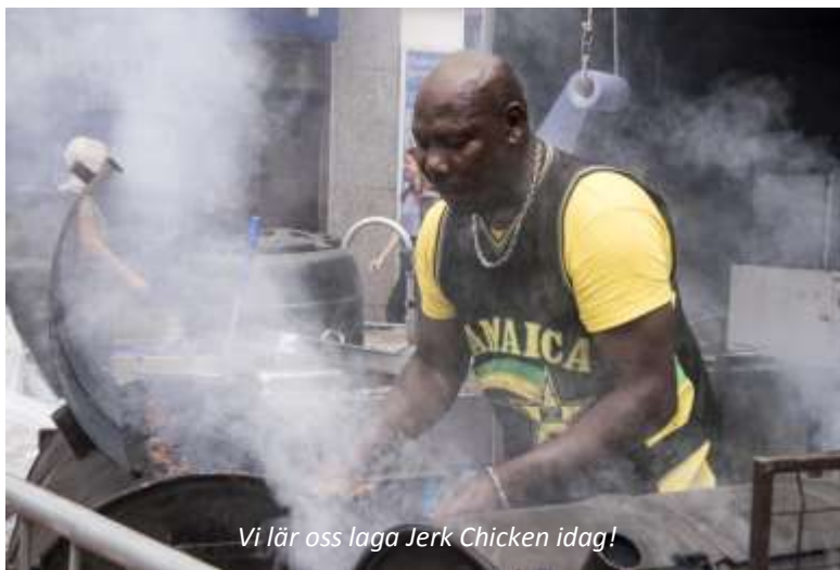
Vi lär oss laga Jerk Chicken idag!

Hibiscus Lodge (3*). Frukost, lunch, middag.