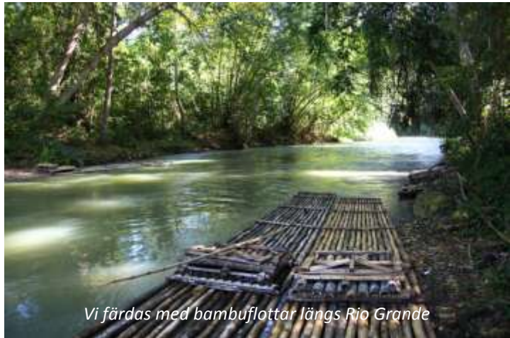
Vi färdas med bambuflottar längs Rio Grande

När vi idag reser söderut mot huvudstaden Kingston väntar en minst sagt storslagen natur, när vi kör över Blue Mountains. Detta område är uppsatt på Unescos världsarvslista, både för sitt kulturella värde då bergen var en tillflyktsort för förrymda slavar, så kallade maroons , och urbefolkningen taíno , men även för dess biologiska mångfald. Blue Mountains är också känt för sitt kaffe, som av många kännare anses som världens bästa. Naturligtvis kommer vi under dagen att få prova detta och även få tillfälle att träffa ättlingar till maroons för att lära oss mer om