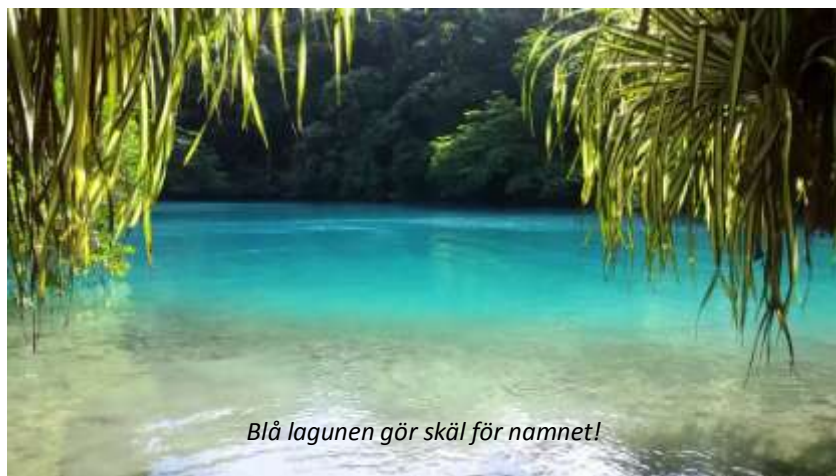
Blå lagunen gör skäl för namnet!

Resan fortsätter österut mot Port Antonio i nordost. På vägen stannar vi vid en plantage, där vi kan ta en färskpressad juice på någon tropisk frukt i säsong medan vi beundrar kolibriernas aktivitet när de suger nektar från de många blommorna. Port Antonio grundades redan 1723 och är en av Jamaicas största sevärdheter, både för sin historia och sina spektakulära omgivningar, men också på grund av sin avslappnade atmosfär. Stadens storhetstid började på 1880-talet