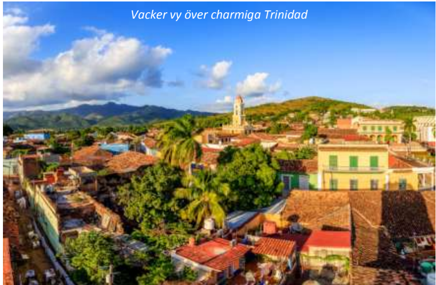
Vacker vy över charmiga Trinidad

Vi fortsätter vår resa österut till en av de bäst bevarade koloniala städerna i världen – Trinidad. Staden med den omgivande dalgången Valle de los Ingenios sattes upp på Unescos världsarvslista redan 1988 och atmosfären och byggnaderna ger verkligen en beskrivande bild av svunna tider då sockerrörshandel och slavhandel stod på sin absoluta höjdpunkt i denna region. På vägen till Trinidad ser vi lämningar efter forna plantager och stannar vid gården Manaca Iznaga där ägarens hus, ett torn