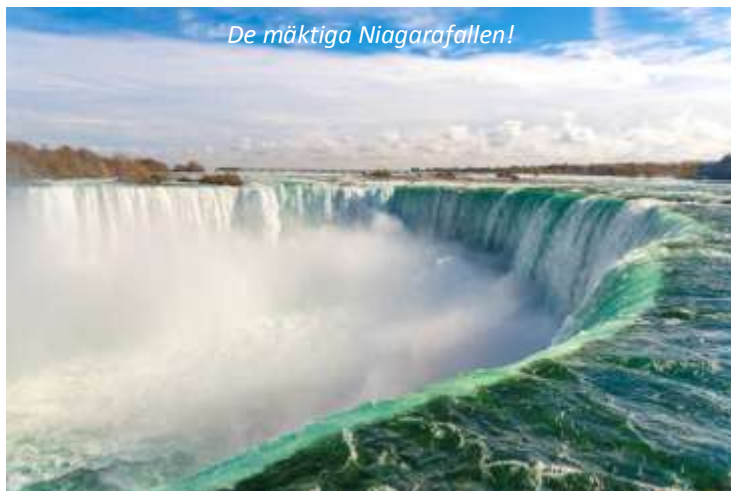
De mäktiga Niagarafallen!

En spännande utflykt väntar idag då vi lämnar Toronto efter frukost och reser mot Niagarafallen! På vägen gör vi ett stopp i den lilla staden Niagara-on-the-Lake. 1792 utsågs denna stad till huvudstad i Övre Kanada, men under kriget 1812 så jämnades staden med marken av brittiska styrkor innan de drog sig tillbaka, och huvudstaden flyttades till Toronto. Britterna återuppbyggde senare staden och idag har den mycket av sin historia charm i behåll. Niagara-on-the-Lake sägs av många vara den vackraste staden i Kanada och är idag en stor turistattraktion. De mäktiga