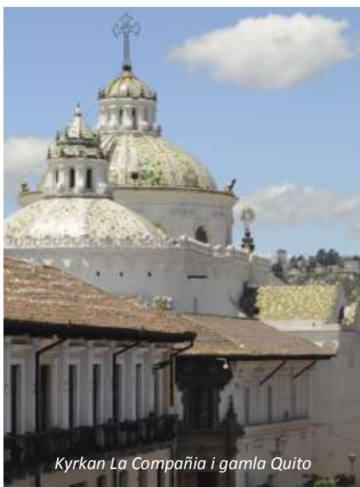
Kyrkan La Compañía i gamla Quito