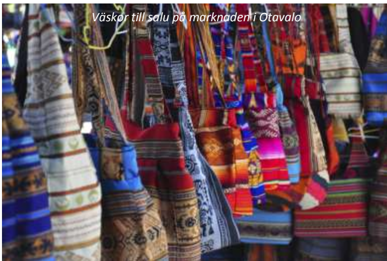
Väskor till salu på marknaden i Otavalo

Den mest berömda marknaden i Ecuador bjuder på en mängd attraktioner. Dels de traditionellt klädda Otavaloindianerna och dels den mängd kläder, väggbonader, instrument mm som finns att köpa. Det är en njutning för alla sinnen att gå omkring i detta enorma vimmel. Vi börjar med att besöka djurmarknaden och går sedan tillsammans den korta sträckan till huvudmarknaden, där vi har förmiddagen ledig för att på egen hand gå runt på denna färgsprakande marknad. På eftermiddagen kommer vi att göra en utflykt i stadens vackra