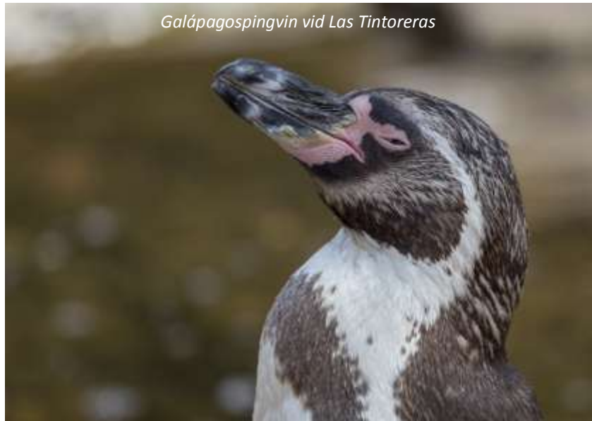
Galápagospingvin vid Las Tintoreras

På morgonen kommer vi att besöka den lilla ön Las Tintoreras. Här finns en liten kanal som stängs till under lågvatten och är en populär viloplats för vitfenade revhajar, men här finns även Galápagossjölejon och endemiska havsleguaner. Las Tintoreras är en mycket viktig plats framför allt för de sistnämnda, då de här kan föröka sig utan påverkan av introducerade djur vilket är ett problem på många andra platser. Med lite tur har vi även möjlighet att se Galápagospingviner, som är världens näst minsta pingvinart och den enda som lever norr om