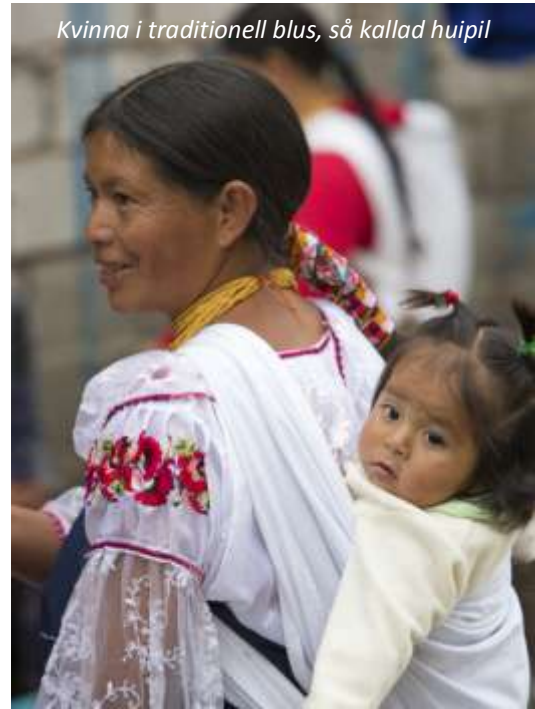
Kvinna i traditionell blus, så kallad huipil

vi 22 kilometer norrut till det som är världens största ekvatormonument, Mitad del Mundo. Ekvatorn går rakt genom landet och har också gett Ecuador dess namn. Här besöker vi ett experimentcentrum, där man kan se hur vattnet i toaletter snurrar åt olika håll på de båda halvkloten! Här finns också möjlighet att prova Ecuadors nationalrätt; grillat marsvin! Vi fortsätter på eftermiddagen till Otavalo som ligger ett par timmars resa norr om Quito. Nu befinner vi oss i provinsen Imbabura och ursprungsbefolkningen här är de som lyckats bäst av alla Latinamerikas indiagrupper. Detta på grund av deras skicklighet i vävning och annat hantverk, vilket verkligen märks på den lilla stadens gator och, framför allt, på lördagsmarknaden. Otavaloindianerna reser både till Nordamerika och Europa och säljer sitt vackra hantverk. I och med framgången har man också lyckats behålla sina gamla traditioner och kläder på ett helt annat sätt än på många andra platser i Sydamerika. Till exempel bär männen, framför allt de äldre, fortfarande de traditionella kläderna som är typiska för Otavalo: djupblå poncho, vita trekvartsbyxor, vita sandaler, hatt samt det långa håret i fläta. Vi bor här på ett trevligt hotell som ligger mycket centralt. Hotel El Indio Inn (3*). Frukost.