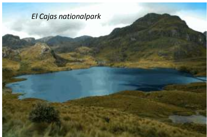
El Cajas nationalpark

Bara 30 km från Cuenca ligger en av Ecuadors vackraste nationalparker, El Cajas. Detta är den bästa platsen i landet för att se den majestätiska kondoren, av vilka det uppskattningsvis endast finns cirka 80 kvar av i hela Ecuador. Vegetationen varierar från de lägre delarnas molnregnskog till den glest beväxta högplatån, páramo. De växter som klarar de tuffa förhållandena på hög höjd är dock unika - hela 19 arter är endemiska för El Cajas! På vägen västerut reser vi genom nationalparken och fascineras över den vackra naturen med sina många sjöar och med lite tur kan vi få se mycket