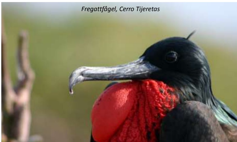
Fregattfågel, Cerro Tijeretas

Under sex fantastiska dagar kommer vi att resa runt bland de olika öarna i Galápagosarkipelagen. Vi kommer att gå efter annan slås av den enorma variationen både vad gäller djur- och växtliv. Men, naturligtvis, höjdpunkten för de flesta är djuren. Dessa djur som i många fall inte finns någon annanstans och som bara ligger framför fötterna på oss - helt orädda. Den som har lekt med sjölejon i