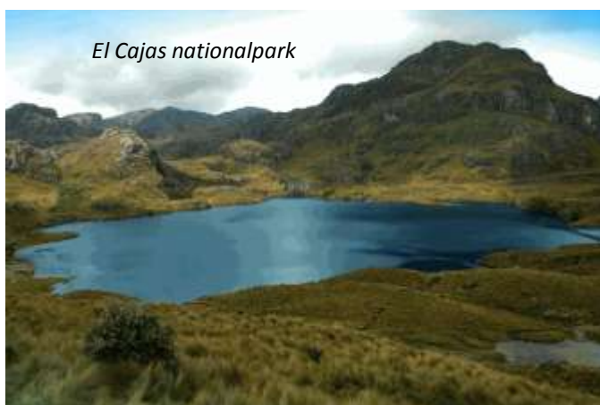
El Cajas nationalpark

Bara 30 km från Cuenca ligger en av Ecuadors vackraste nationalparker, El Cajas. Detta är den bästa platsen i landet för att se den majestätiska kondoren, av vilka det uppskattningsvis endast finns cirka 80 kvar av i hela Ecuador. Vegetationen varierar från de lägre delarnas molnregnskog till den glest beväxta högplatån, páramo. De växter som klarar de tuffa förhållandena på hög höjd är dock unika - hela 19 arter är endemiska för El Cajas! På vägen västerut reser vi genom nationalparken och fascineras över den vackra naturen med sina många sjöar och med lite tur kan vi få se mycket