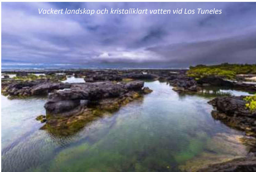
Vackert landskap och kristallklart vatten vid Los Tuneles

Att Galápagos består av en mängd vulkaniska öar kommer vi verkligen att se på nära håll under förmiddagens utflykt då vi färdas med båt längsmed kusten till Los Tuneles. Med lite tur ser vi världens största rocka, mantan eller djävulsrockan, under båtresan - dessa magnifika djur kan bli upp till sex meter mellan vingspetsarna! Los Tuneles, som betyder tunnlarna, gör skäl för namnet. Dessa tunnlar bildades när flytande magma från den närbelägna vulkanen strömmade ner till havet och vattnet sedan