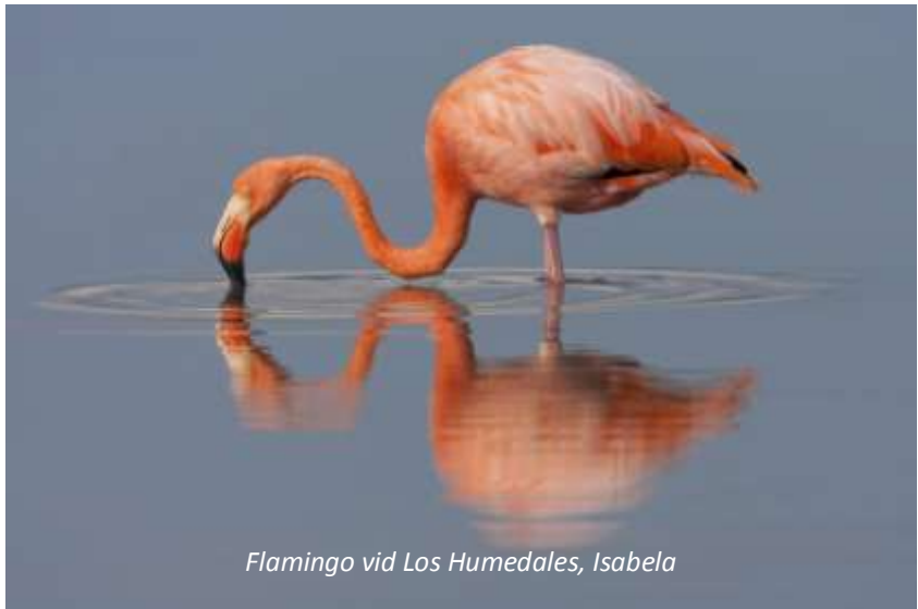
Flamingo vid Los Humedales, Isabela

Efter frukost åker vi till flygplatsen för att flyga till Galápagos största ö Isabela. Vi börjar vårt besök här med att besöka området Los Humedales, som ordagrant betyder våtländerna. Här finns en serie klippiga stränder, sandstränder och mangrove och detta gör området mycket intressant för den som är intresserad av fåglar. Vi har till exempel goda möjligheter att se flamingos, mindre beckasinsnäppa, blåvingad årta och kustpipare för att bara nämna några. Mangroven utgör även en viktig