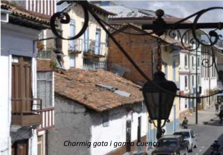
Charmig gata i gamla Cuenca

På förmiddagen tar vi en promenad i den gamla stadskärnan, under vilken vi njuter av de många vackra byggnaderna från kolonialtiden som till exempel den gamla och nya katedralen, stadshuset och den imponerande Santo Domingo-kyrkan. Cuenca grundades 1557 och många av de byggnader vi ser är från slutet av 1500- och 1600-tal. Det är en ren njutning att gå runt på de kullerstensbeklädda gatorna med sina många trevliga restauranger, barer och affärer i de historiska byggnaderna i typisk spansk kolonialstil. Vi besöker också det intressanta museet Conceptas, som ligger i ett gammalt kloster. Här ser vi