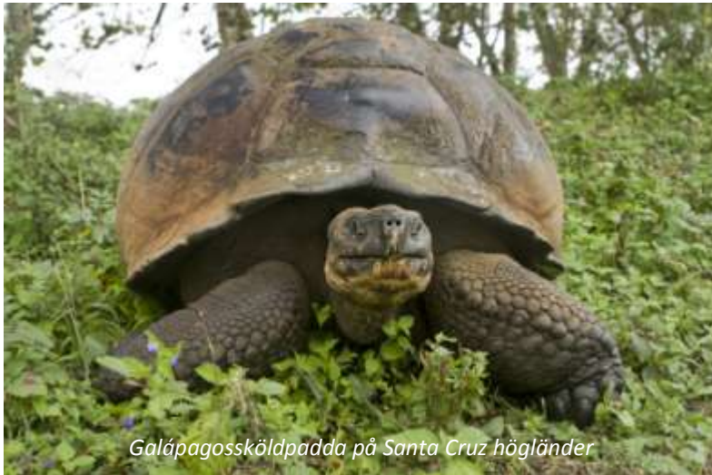
Galápagosköldpadda på Santa Cruz högländer

Vi börjar dagen med ett besök i Santa Cruz gröna högländer. Här ser vi en nästan regnskogsliknande vegetation, detta då här faller betydligt mer nederbörd än på de flesta andra platser på Galápagos. Denna plats är speciell även på andra sätt - detta är en av de två platser där man kan se Galápagosköldpaddor i vilt tillstånd, övriga platser är stängda för besökare. Underarten som lever här är en av de större och skillnaden mellan dessa och de vi till exempel såg tidigare på Isabela är enorm - det är svårt att tänka sig att de en gång var en och samma art med