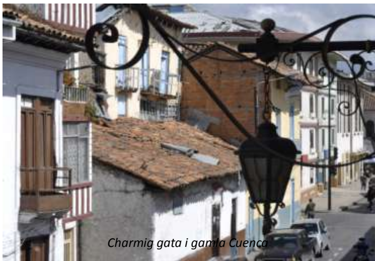
Charmig gata i gamla Cuenca

På förmiddagen tar vi en promenad i den gamla stadskärnan, under vilken vi njuter av de många vackra byggnaderna från kolonialtiden som till exempel den gamla och nya katedralen, stadshuset och den imponerande Santo Domingo-kyrkan. Cuenca grundades 1557 och många av de byggnader vi ser är från slutet av 1500- och 1600-tal. Det är en ren njutning att gå runt på de kullerstensbeklädda gatorna med sina många trevliga restauranger, barer och affärer i de historiska byggnaderna i typisk spansk kolonialstil. Vi besöker också det intressanta museet Conceptas, som ligger i ett gammalt kloster. Här ser vi