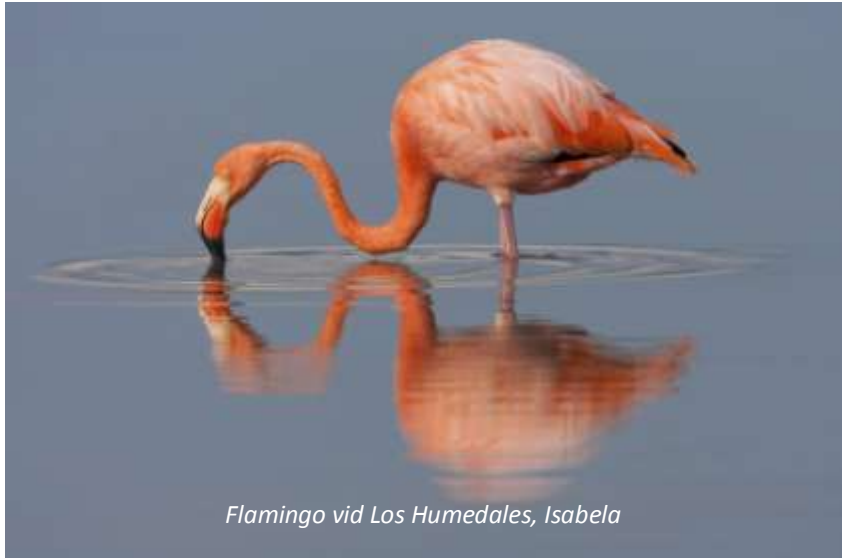
Flamingo vid Los Humedales, Isabela

Efter frukost åker vi till flygplatsen för att flyga till Galápagos största ö Isabela. Vi börjar vårt besök här med att besöka området Los Humedales, som ordagrant betyder våtländerna. Här finns en serie klippiga stränder, sandstränder och mangrove och detta gör området mycket intressant för den som är intresserad av fåglar. Vi har till exempel goda möjligheter att se flamingos, mindre beckasinsnäppa, blåvingad årta och kustpipare för att bara nämna några. Mangroven utgör även en viktig