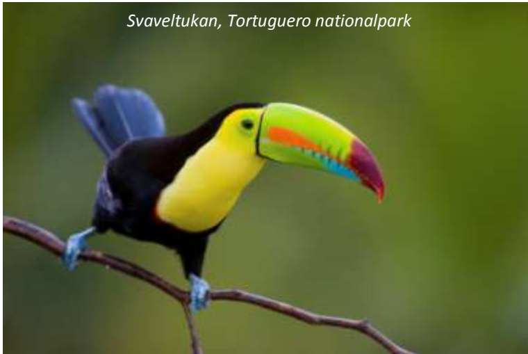
Svaveltukan, Tortuguero nationalpark

Hela dagen är vikt åt utflykter i nationalparken. Vår kunniga guide kommer att styra upplägget på dessa, så att vi får se så mycket som möjligt; vi kommer att åka båt längs kanalerna och även gå promenader, där vi kommer att få utförliga beskrivningar av den enorma mångfalden i regnskogens flora. I Tortuguero lever båda arterna av sengångare, tvåtåig och tretåig – vi kan i det närmaste lämna garanti att ni kommer att se dessa underliga djur som lever hela sina liv hängande upp och ner i träden. De enda gångerna de kommer ner till marken är när de ska utföra sina