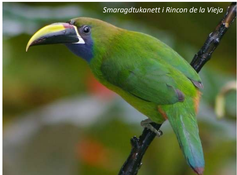
Smaragdtukanett i Rincon de la Vieja

Från molnen åker vi ner till lågländernas sol; i provinsen Guanacaste skiner den nästan alltid! Landskapet i denna Costa Ricas största provins är väldigt vackert med sina böljande gula fält och typiska träd. Dessa träd, som heter just guanacasteträd, är också Costa Ricas nationalträd. Detta för att hylla folket i denna region som var den sista att ansluta sig till landet vid självständigheten. Regionen är känt för sina boskapsrancher och här och var längs vägen kommer vi att passera en sabanero, Costa Ricas motsvarighet till den nordamerikanska cowboyn, ridande i lugnt tempo. På eftermiddagen åker vi den korta vägen