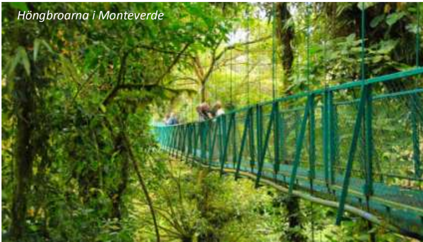
Höngbroarna i Monteverde

Vi går upp tidigt för att utforska molnskogen. Den skiljer sig mycket från regnskogarna nere på lågländerna, nästan varje träd är täckt med mossa och andra växter - det är en magisk upplevelse att gå omkring här! Om vi har riktig tur kan vi få se en glimt av den vackra quetzalen, en fågel som spelade en stor roll i de precolombianska civilisationerna. Monteverde är även känt för sina många arter av kolibrier och vi besöker en