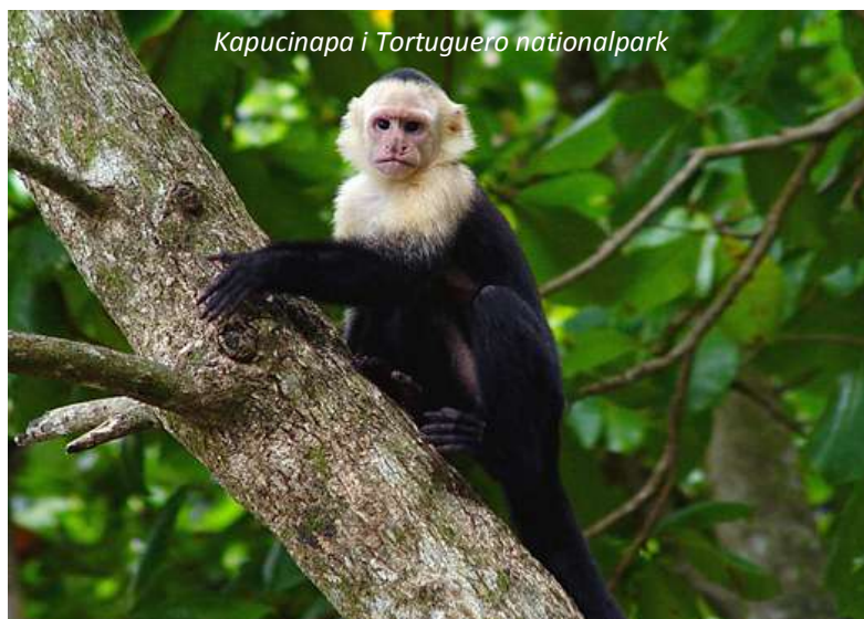
Kapucinapa i Tortuguero nationalpark

Resan går genom den spektakulära regnskogen i Braulio Carillo nationalpark, bara 30 minuter från San José.