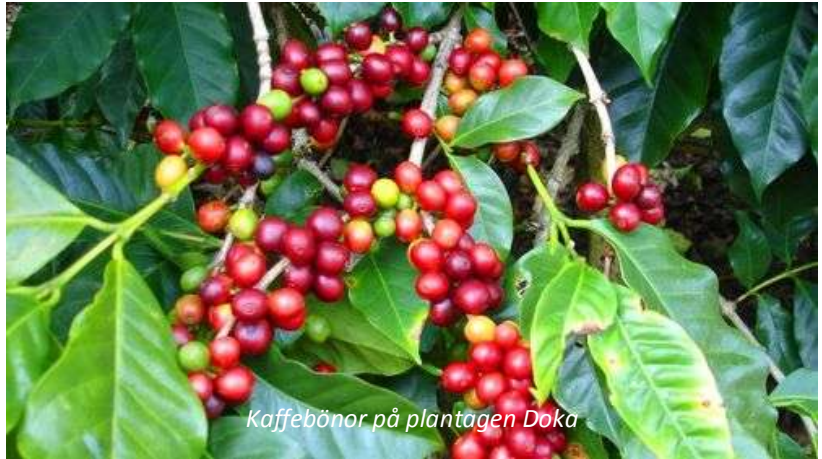
Kaffeböner på plantagen Doka

På förmiddagen gör vi en intressant utflykt till kaffeplantagen Doka. Plantagen ligger vackert beläget på vulkanen Poás sluttningar - kaffeplantan behöver relativt hög höjd för att trivas. Faktiskt så är Costa Rica det land i världen som producerar mest kaffe i förhållande till folkmängden! Vi får här en guidad rundtur på ägorna, där vi får lära oss mer om kaffets väg från liten planta till färdigt kaffe. Vi kommer naturligtvis att få prova några av