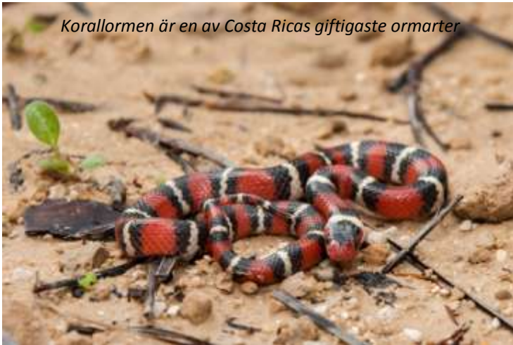
Korallormen är en av Costa Ricas giftigaste ormarter

bland annat den mycket vackra korallormen som är röd med svarta och gula ränder. I Serpentariet finns även sex grodarter och två arter av basilisködlor. Utflykten avslutas vid en utsiktspunkt, där vi kan njuta av en magnifik vy över de vackra omgivningarna som domineras av vulkanerna Rincón de la Vieja och Santa Maria. Faktiskt ser man hela vägen till Stilla havet härifrån! Hacienda Guachipelin (3*). Frukost.