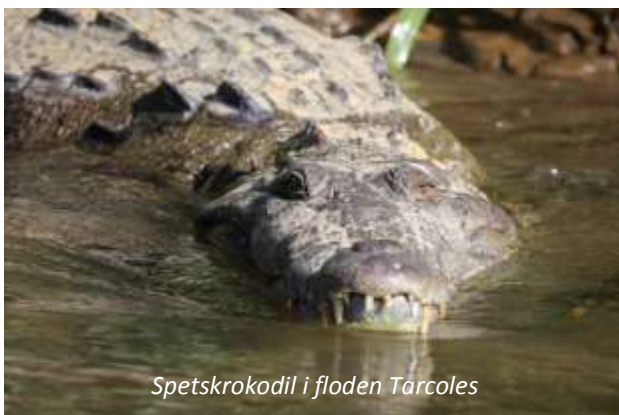
Spetskrokodil i floden Tarcoles

Vi reser idag tillbaka till huvudstaden, men stannar vid floden Tarcoles på vägen för en trevlig båttur. Tarcoles är framför allt känt för sitt goda bestånd av spetskrokodiler och vi kommer att komma mycket nära dessa enorma djur - denna art kan bli hela sex meter lång. Floden är också en utmärkt plats för fågelskådning och under utflykten är det inte ovanligt att se mer än 50 arter som till exempel mangrovekolibri, mangrovevireo och amerikansk pygmékungsfiskare. Vi kommer fram till hotellet i San José sent på eftermiddagen och färdledaren kommer att ta initiativ till en trevlig avskedsmiddag på kvällen.