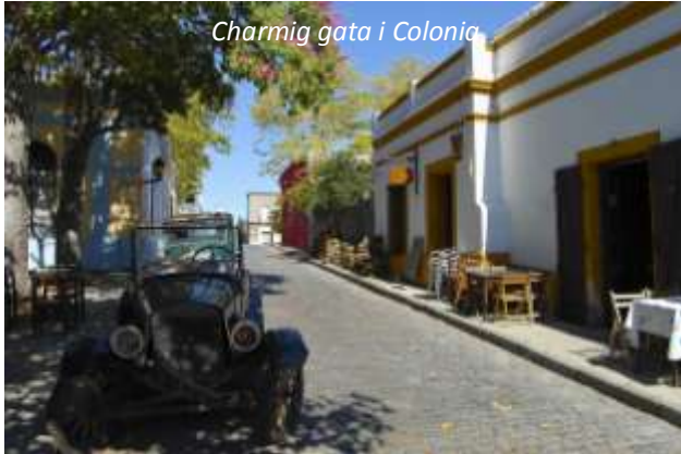
Charmig gata i Colonia

En spännande dag väntar där vi tar en snabbgående katamaran över Rio de la Plata, vilket betyder floden av silver, till grannlandet Uruguays främsta sevärdhet och landets enda världsarv på Unescos lista. Väl framme kommer vi att gå en guidad promenad för att upptäcka stadens vackra byggnader och rika historia. Colonia grundades 1680 av portugisen Manoel Lobo på grund av dess strategiska läge mitt emot Buenos Aires, men stadens främsta inkomst var smuggelgods. På den tiden hade Spanien monopol på handel till och från den sydamerikanska kontinenten och man gjorde flera räder över Rio de