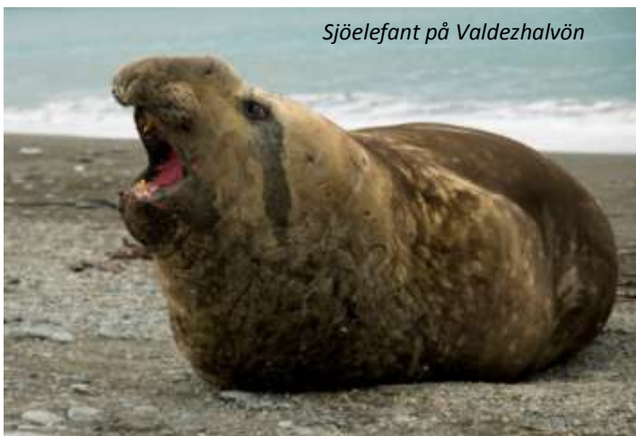
Sjöelefant på Valdezhavön

Idag väntar en heldagstur på den fantastiska Valdezhavön, uppsatt på Unescos världsarvslista för sitt enastående djurliv. Här har vi möjlighet att se sjölejon, sjöelefanter, guanacos, rhea (sydamerikansk strutsfågel), Magellanpingviner och mängder av annan sjöfågel. Mest imponerande av allt är kanske rätvalarna. Mellan juni och december kommer dessa gigantiska djur, de kan bli upp till 18 meter långa, in till kusten vid Valdez. Vi kommer under dagen att ta en båtutflykt för att se valarna på riktigt nära håll! Valdezhavön har också kontinentens enda sjöelefantkoloni. Dessa imponerande djur kan