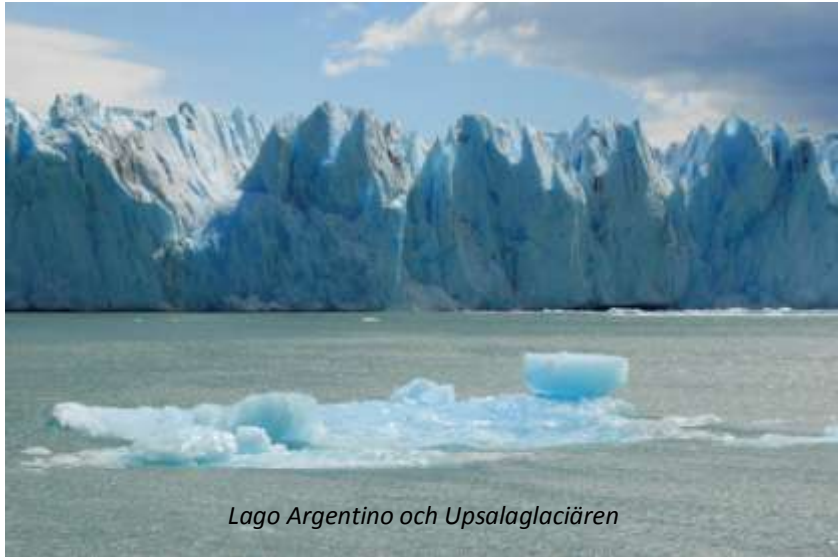
Lago Argentino och Upsalaglaciären

Efter frukost börjar vi utforska nationalparken Los Glaciares. Vi åker från hotellet ner till Puerto Banderas, där vi går ombord på en båt för att kryssa på den underbart vackra sjön Lago Argentino. Omgivningarna är storslagna och vi har goda möjligheter att se kondorer under dagen. I norra delen av sjön ligger Upsala, den största kontinentalt belägna glaciären på det södra halvklotet – tre gånger större än Buenos Aires. Den är 60 kilometer lång med en främre vägg som är hela fyra km bred! Det går inte att komma hela