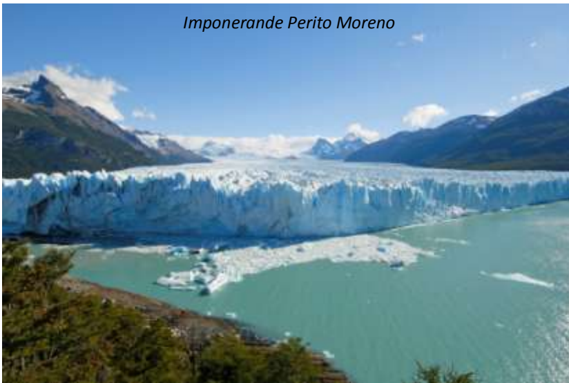
Imponerande Perito Moreno

Idag väntar Los Glaciares mest berömda attraktion; glaciären Perito Moreno, en av få glaciärer i världen som fortfarande växer. På grund av omgivningarna kan den dock inte avancera särskilt långt; ungefär 20 gånger har den nått ända fram till andra sidan av denna arm av Lago Argentino. Den stänger då av vattentillflödet och vattnet börjar långsamt urholka glaciären och bildar till slut ett valv som kollapsar under ett öronbedövande dån! Även om chansen att vi ska få uppleva detta idag är minimal, så kommer vi att se när glaciären