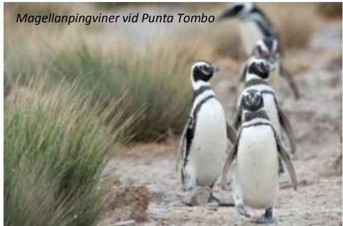
Magellanpingviner vid Punta Tombo

Hotel Dazzler Puerto Madryn (4*). Frukost.