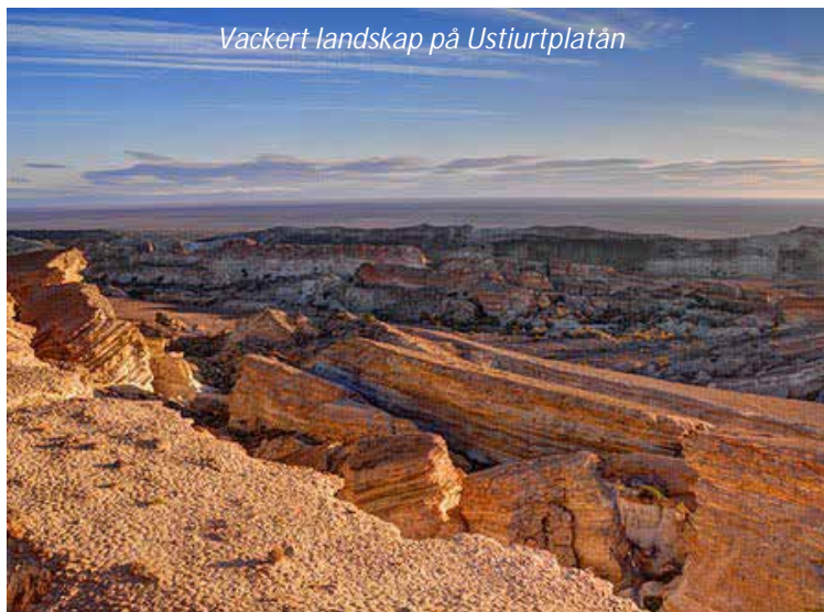
Vackert landskap på Ustiurtplatån

Tidigt på morgonen åker vi ut till flygplatsen för att flyga till Nukus i den västra delen av landet. Nukus är huvudstad i den autonoma republiken Karakalpakstan och har cirka 260 000 invånare. Nu väntar oss ett äventyr de närmaste dagarna när vi reser mot det som finns kvar av Aralsjön, som en gång var världens fjärde största insjö. Idag återstår endast cirka 10 % av den ursprungliga ytan fördelad på tre separata sjöar. Aralsjön har kallats för en av 1900-talets största miljökatastrofer - en jakt på allt större bomullsskördar ledde till att