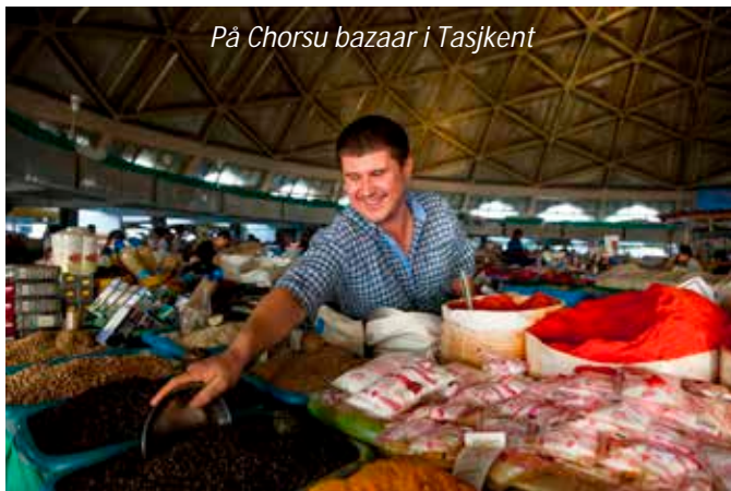
På Chorsu bazaar i Tasjkent

Vi landar på natten, möts vid ankomsten och körs till vårt hotell som ligger mycket centralt. Efter en ledig förmiddag för att vila ut efter den långa resan så ger vi oss ut på en stadsrundtur. Tasjkent är Centralasiens största stad och delar av staden byggdes upp under Sovjettiden efter den stora jordbävningen 1966, men det finns kvar en äldre stadsdel där livet påminner om det vi kommer att se på landsbygden under resan. Vi besöker bland annat den myllrande marknaden Chorsu bazaar och koranskolan Barak Khan