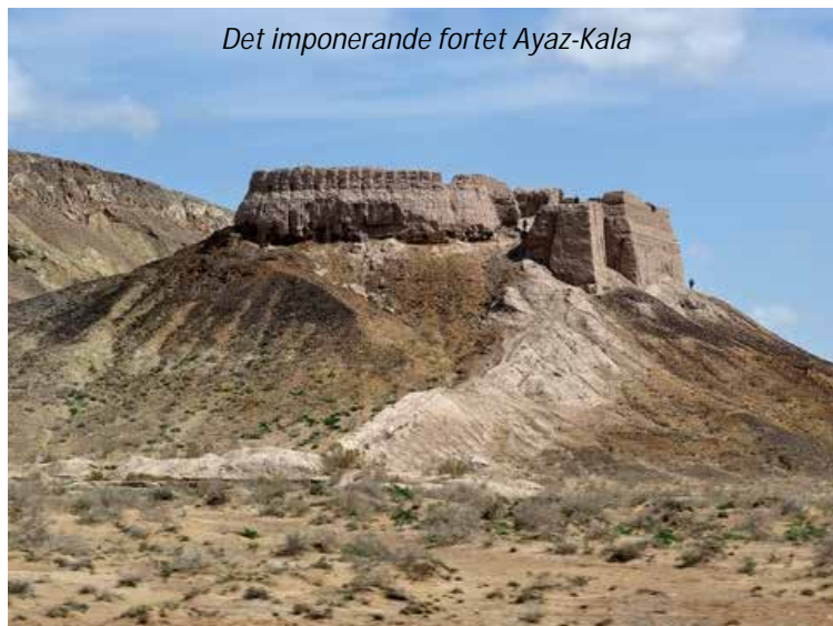
Det imponerande fortet Ayaz-Kala

Dagen börjar med ett besök på ett av Centralasiens främsta museer, Savitskymuseet, som är namngivet efter Igor Savitsky som var en rysk målare, arkeolog och samlare, framför allt av avantgardekonst. Idag finns här världens näst största samling av rysk avantgarde, men vi kan även bland mycket annat se artefakter från Khorezmriket och typiska hantverk från regionen Karakalpakstan. Vår stadsrundtur i Nukus fortsätter sedan med den äldre delen av staden innan vi lämnar Nukus bakom oss. Vi färdas genom Kyzyl Kumöknen och omges