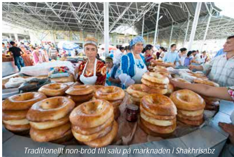
Traditionellt non-bröd till salu på marknaden i Shakhrisabz

Efter frukost lämnar vi Bukhara och reser österut mot Shakhrisabz, som sattes upp på Unescos världsarvslista år 2000. Shakhrisabz är framför allt känt som Timur Lenks födelsestad, även om han egentligen föddes i byn Hoja Ilghar, 13 km söder om staden. Timur kom till makten 1370 och härskade fram till sin död 1405. Shakhrisabz lydde på 1300-talet under khanen Tugluq som regerade från Kashgar i nuvarande Kina. Denne khan tillsatte Timur som guvernör över