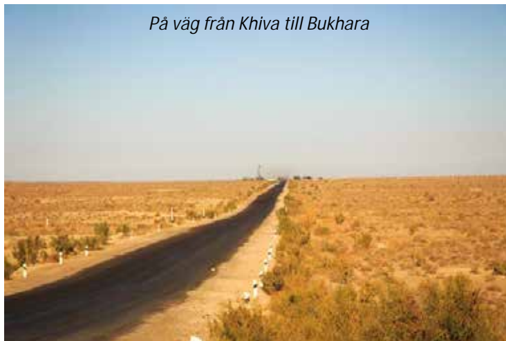
På väg från Khiva till Bukhara

Hotel Lyabi House (3*). Frukost, middag.