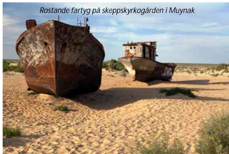
Rostande fartyg på skeppskyrkogården i Muynak

Vi går upp tidigt för att se solen gå upp över sjön och efter frukost fortsätter vi sedan till Muynak. Under resan kommer vi att färdas på Aralsjöns torkade tidigare botten och passerar flera övergivna och rostande gastorn. Efter cirka fyra timmar kommer vi fram till Muynak, som tidigare var ett blomstrande samhälle men som idag, mer än någon annan plats, bär spår efter den ekologiska katastrofen. Vi är nu cirka 100 km från sjön men att den en gång sträckte sig ända hit