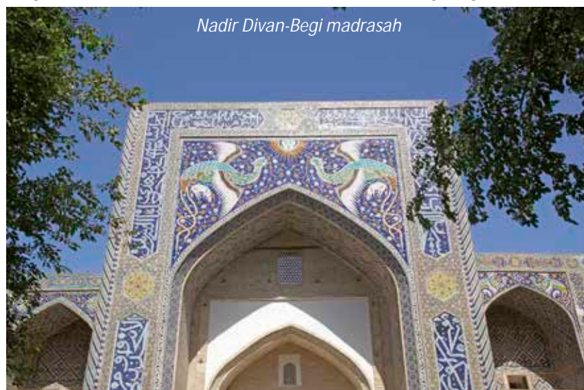
Nadir Divan-Begi madrasah