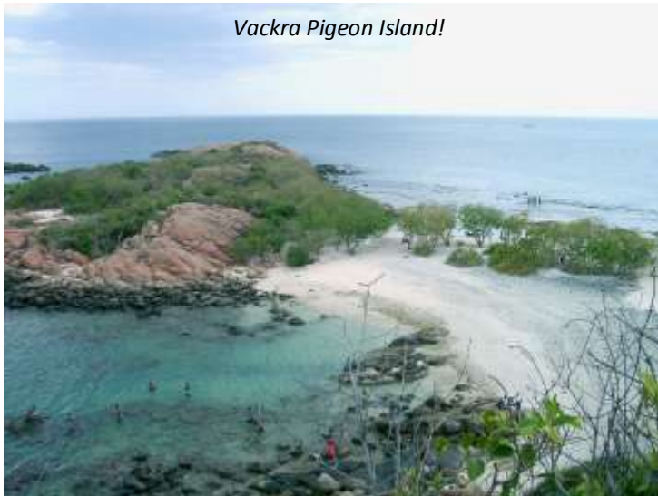
Vackra Pigeon Island!

Vi tar idag en båtutur ut till en av Sri Lankas två marina nationalparker, Pigeon Island. Namnet kommer från de klippduvor som häckar här, men den stora attraktionen är det kristallklara vattnet och de levande, färgsprakande korallreven! Vi har med oss snorkelutrustning så att ni kan utforska det närmare. Här finns mer än 100 korallarter och dryga 300 fiskarter har setts runt de två små öarna. Vi har goda möjligheter att se svartfenad revhaj och någon av de tre havssköldpaddsorter som finns i dessa vatten under vår snorkling, bland mycket annat. Under utflykten så har vi också möjlighet att slappna av på stranden. På eftermiddagen utforskar vi staden