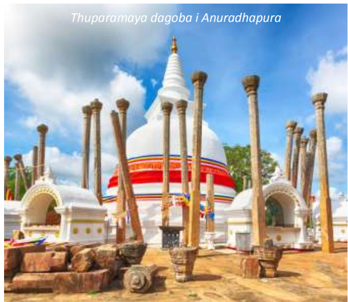
Thuparamaya dagoba i Anuradhapura

Vi börjar dagen med att besöka Anuradhapura. Denna gamla kungastad var Sri Lankas första huvudstad. Staden grundades på 400-talet f Kr men de första arkeologiska fynden kan dateras så långt bak som till 1000 år f Kr. Anuradhapura var en av de viktigaste platserna i den buddhistiska världen, ända tills staden i början av 1000-talet erövrades av den sydindiska Chola-dynastin och sedan började förfalla. Från 1200-talet låg staden dold under den täta skogen. Anuradhapurans många palats, kloster, stupor och stensulpturer återupptäcktes först i början av 1800-talet av engelsmän. Efter utgrävningar och restaureringar blev staden igen en vallfärdsort för buddhister som ville besöka de många stuporna, som enligt sägnen skulle innehålla relikier av Buddha själv. Staden är i dag