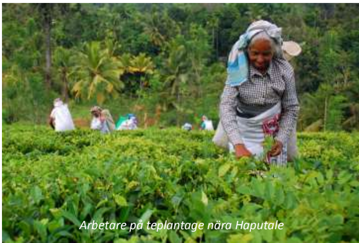
Arbetare på teplantage nära Haputale

På förmiddagen gör vi en utflykt till nationalparken Horton Plains, som tillsammans med Peak Wilderness Protected Area och Knuckles Conservation Forest utgör världsarvet The Central Highlands of Sri Lanka. De montana regnskogarna här anses som en så kallad superhotspot för biologisk mångfald - mer än hälften av Sri Lankas endemiska (det vill säga att de endast finns här) ryggradsdjur, hälften av landets endemiska blommande växter och mer än en tredjedel av dess endemiska träd, buskar och örter är begränsade till detta område! Vi gör här en vandring på cirka tio