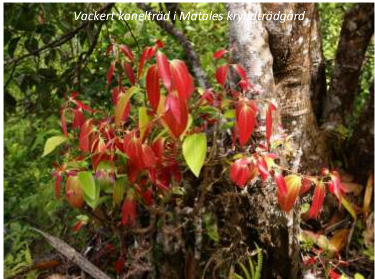
Vackert kanelträd i Matales kryddträdgård

Idag reser vi vidare söderut mot en av resans höjdpunkter, staden Kandy. På vägen stannar vi i Matale, där vi besöker en kryddträdgård. Här får vi en guidad rundvisning och ser de många olika kryddor som Sri Lanka är känt för, som till exempel kanel, muskotnöt, kardemumma, kryddnejlika med flera. Här får ni se hur de växer, odlas och skördas och naturligtvis ha möjlighet att köpa med er en påse eller två. Efter rundturen väntar något speciellt - vi ska få lära oss hur man lagar typisk lankesisk mat! Det lankesiska köket är nära besläktat med det indiska, men bär även spår av kolonialtiden. Ett exempel är den holländskinfluerade rätten lamprais , som