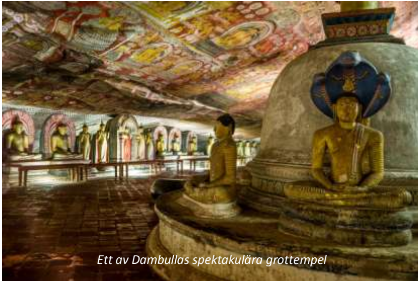
Ett av Dambullas spektakulära grottempel

Efter frukost lämnar vi Negombo och reser åt nordost mot Dambulla och resans första världsarv, de berömda grottemplen. Klippan som templen ligger i sträcker sig 160 meter över den omgivande slätten och i området finns mer än 80 grottor. Av dessa är det dock bara i fem som det finns heliga buddhistiska föremål och det är tre som utmärker sig lite extra, främst Den gudomlige kungens grotta. Denna grotta domineras av den drygt 14 meter långa liggande statyn av Buddha, en av de figurer som skulpterats fram direkt ur