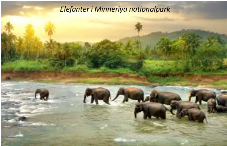
Elefanter i Minneriya nationalpark

väggmålningar som gestaltar kvinnor och på toppen av klippan har ni en imponerande utsikt över det vackra landskapet med djungel och berg. Även Sigiriya är naturligtvis uppsatt på Unescos världsarvslista. På eftermiddagen kommer vi att göra en game drive i nationalparken Minneriya, som framför allt är känt för sin stora population av lankesisk elefant. Denna är en underart till den asiatiska elefanten och är den största av de asiatiska elefanterna. Speciellt är även att mindre än var tionde hanne har betar. Faktiskt