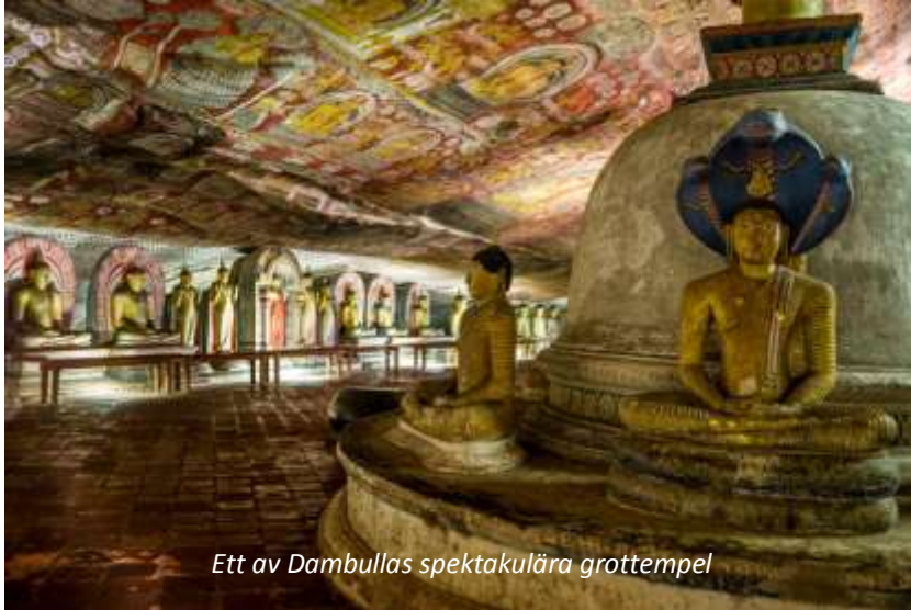
Ett av Dambullas spektakulära grottempel

Efter frukost lämnar vi Negombo och reser åt nordost mot Dambulla och resans första världsarv, de berömda grottemplen. Klippan som templen ligger i sträcker sig 160 meter över den omgivande slätten och i området finns mer än 80 grottor. Av dessa är det dock bara i fem som det finns heliga buddhistiska föremål och det är tre som utmärker sig lite extra, främst Den gudomlige kungens grotta. Denna grotta domineras av den drygt 14 meter långa liggande statyn av Buddha, en av de figurer som skulpterats fram direkt ur