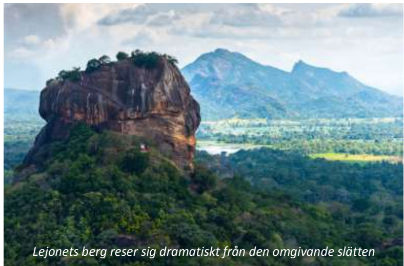
Lejonets berg reser sig dramatiskt från den omgivande slätten

På förmiddagen besöker vi det så kallade Lejonets berg som reser sig brant från det flacka landskapet. Berget är känt för ruinkomplexet på toppen, byggt av Kung Kashyapa på 400-talet. Kung Kashyapa flyttade år 477 från Anuradhapura till Sigiriya och gjorde platsen till huvudstad på grund av dess strategiska läge. Staden är ett fantastiskt exempel på tidig stadsplanering: kungen byggde ett enormt palats med omkringliggande trädgårdar, badbassänger och skulpturer på toppen av den ca 200 meter höga klippan, alltsamman utifrån geometriska system. Efter bara 20 år som kungasäte och huvudstad omvandlades Sigiriya till ett buddhistiskt kloster. På vägen upp till komplexet kan man se fantastiskt vackra, 1 500 år gamla, välbevarade