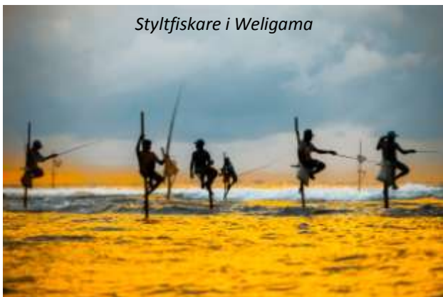
Styltfiskare i Weligama

Efter frukost reser vi västerut mot ännu ett av Sri Lankas världsarv, staden Galle. På vägen ser vi de berömda styltfiskarna i Weligama. Denna fiskemetod, där de för ner en smal påle i botten några meter ut från stranden och därifrån kastar ut sitt bete, har mycket gamla anor. Vi fortsätter sedan till Galle, som ligger vackert på en halvö. Holländarna gjorde staden till sin administrativa huvudstad på mitten av 1600-talet och anses idag vara en av de finast bevarade städer som byggts av européer i Syd- och Sydostasien. Särskilt fortet är mycket imponerande, det började byggas av portugiserna på slutet av 1500-talet, men utökades och förbättrades avsevärt under den holländska perioden. Cirkeln sluts när vi kommer fram till Negombo. Här bor vi precis vid stranden, en härlig plats att avsluta denna innehållsrika resa på!