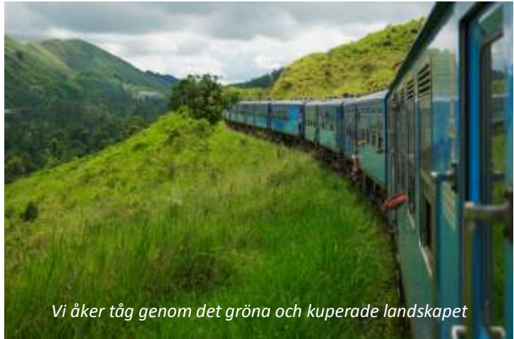
Vi åker tåg genom det gröna och kuperade landskapet