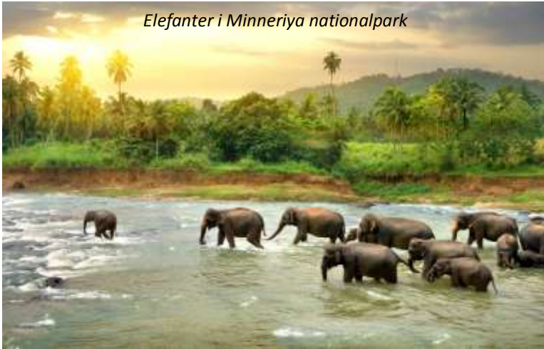
Elefanter i Minneriya nationalpark

väggmålningar som gestaltar kvinnor och på toppen av klippan har ni en imponerande utsikt över det vackra landskapet med djungel och berg. Även Sigiriya är naturligtvis uppsatt på Unescos världsarvslista. På eftermiddagen kommer vi att göra en game drive i nationalparken Minneriya, som framför allt är känt för sin stora population av lankesisk elefant. Denna är en underart till den asiatiska elefanten och är den största av de asiatiska elefanterna. Speciellt är även att mindre än var tionde hanne har betar. Faktiskt