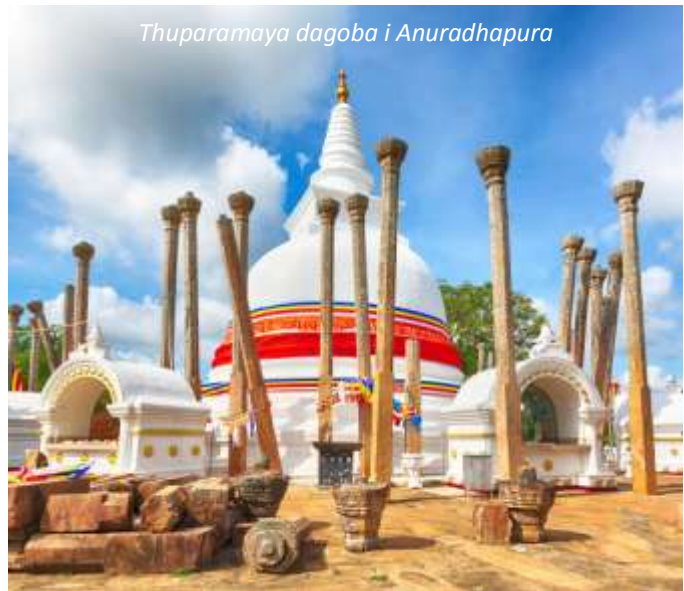
Thuparamaya dagoba i Anuradhapura

Vi börjar dagen med att besöka Anuradhapura. Denna gamla kungastad var Sri Lankas första huvudstad. Staden grundades på 400-talet f Kr men de första arkeologiska fynden kan dateras så långt bak som till 1000 år f Kr. Anuradhapura var en av de viktigaste platserna i den buddhistiska världen, ända tills staden i början av 1000-talet erövrades av den sydindiska Chola-dynastin och sedan började förfalla. Från 1200-talet låg staden dold under den täta skogen. Anuradhapurans många palats, kloster, stupor och stensulpturer återupptäcktes först i början av 1800-talet av engelsmän. Efter utgrävningar och restaureringar blev staden igen en vallfärdsort för buddhister som ville besöka de många stuporna, som enligt sägnen skulle innehålla relikier av Buddha själv. Staden är i dag