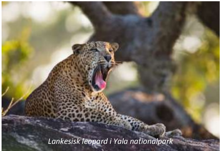
Lankesisk leopard i Yala nationalpark

Mest känd är Yala dock för att vara en av de bästa platserna i världen för att se leoparder. Vissa hävdar att Yala har den största leopardtätheten av alla nationalparker i världen, men detta är föremål för diskussion. Vad som dock gör Yala ovanligt är att här är leoparderna relativt lätta att se, även om det förstås aldrig finns några garantier. Förutom leoparder, den lankesiska leoparden är en egen underart ( Panthera pardus kotiya ), så finns här hela 44 däggdjursarter som till exempel läppbjörn, vattenbuffel, vildsvin, axishjort, sambarhjort och guldschakal. Yala har även ett mycket rikt fågelliv med 215 konstaterade arter av vilka kan nämnas indisk tofsörn, vitbukad havsörn, mindre flamingo, skedstorkar, svarthalsad stork och ormhalsfåglar. Sex fågelarter endemiska för Sri Lanka kan ses i nationalparken: Ceylontoko, Singalesisk bankivahöna, Ceylonduva, karmosinstrupig barbett (finns dock även i sydvästra Indien) och Sri Lankatrasttimalia. I parken finns också sumpkrokodil och saltvattenkrokodil. En spännande eftermiddag!