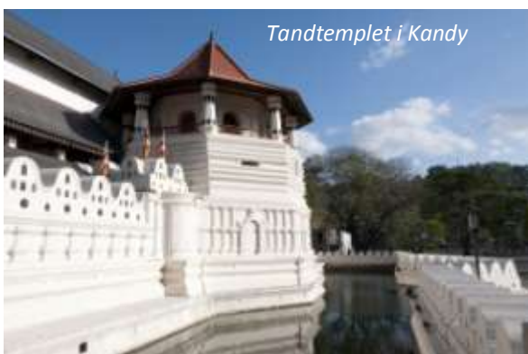
Tandtemplet i Kandy