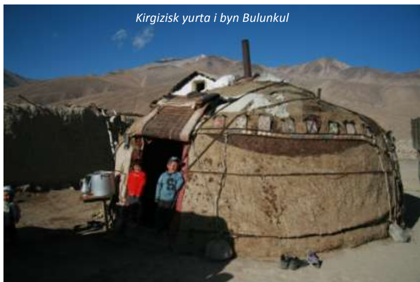
Kirgizisk yurta i byn Bulunkul

Från Langar åker vi norrut och klättrar kraftigt till en början innan vi passerar resans hittills högsta pass, Khargushpasset på 4 344 meters höjd. Här kommer vi sedan ut på den pamiriska högplatån med sitt närmaste månliknande, karga landskap flankerat av snöklädda toppar – en fantastisk syn! Vi kommer ut på Pamir Highway igen, åker västerut ett par kilometer och viker sedan av norrut på en dålig väg till det lilla