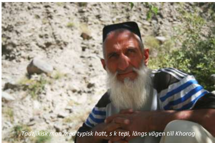
Tadjjikisk man med typisk hatt, s k tepi, längs vägen till Khorog

En mycket vacker dag väntar! Vi följer Panyi-floden hela dagen och kommer att ha gott om möjligheter till spektakulära stopp längs vägen. Människorna som lever här är pamirtadzjiker och talar pamiri, vilket skiljer sig mycket åt från tadjjikiskan. Faktiskt så har de små samhällena i denna bergiga region levt så isolerade att man i varje by har utvecklat sin helt egen dialekt av pamiri! På eftermiddagen kommer vi