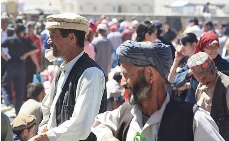
Lördagsmarknaden på ön mellan Tadzjikistan och Afghanistan

Pakistans mäktiga Hindukush är storslagen! Ni fortsätter till Vrang, där ni ser bevis på den smältdegel som Pamir utgör. Här finns såväl en buddhistisk stupa och lämningar efter zoroastriska kultplatser. I zoroastrismen utgör elden en central roll och vid kultplatserna brann alltid en evig låga. Vi kommer fram till Langar sent på eftermiddagen, där vi bor på en enkel men charmig homestay. Vi har dock inte tillgång till dusch här.