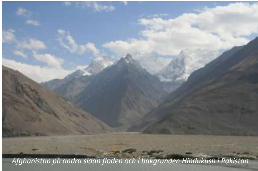
Afghanistan på andra sidan floden och i bakgrunden Hindukush i Pakistan

Från och med idag gör vi en avstickare från Pamir Highway och reser söderut mot Wakhankorridoren. Inte långt från Khorog dyker Hindukush mäktiga snöklädda, 7 000-8 000 meter höga, berg upp framför oss – en fantastisk syn. Hindukush ligger i Pakistan, på andra sidan den smala remsan av Afghanistan som utgör den så kallade korridoren. Wakhan är ett resultat av The Great Game, där ryssar och briter tävlade