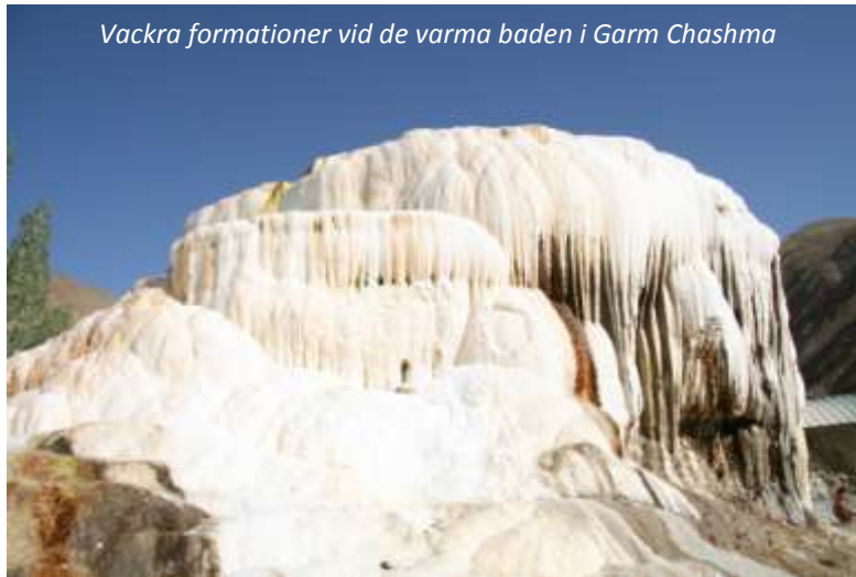
Vackra formationer vid de varma baden i Garm Chashma

Efter frukost beger vi oss ut på en stadsrundtur i Khorog. Vi besöker det intressanta regionala museet och den imponerande botaniska trädgården, som ligger fem kilometer öster om staden. Här finns över 3 000 arter av träd och växter och trädgårdens cirka 200 hektar sträcker sig hela vägen upp till 3 900 meters höjd (Khorog ligger på cirka 2 100 m ö h), vilket gör den till världens näst högst belägna botaniska trädgård! Efter lunch åker vi söderut till de varma källorna vid