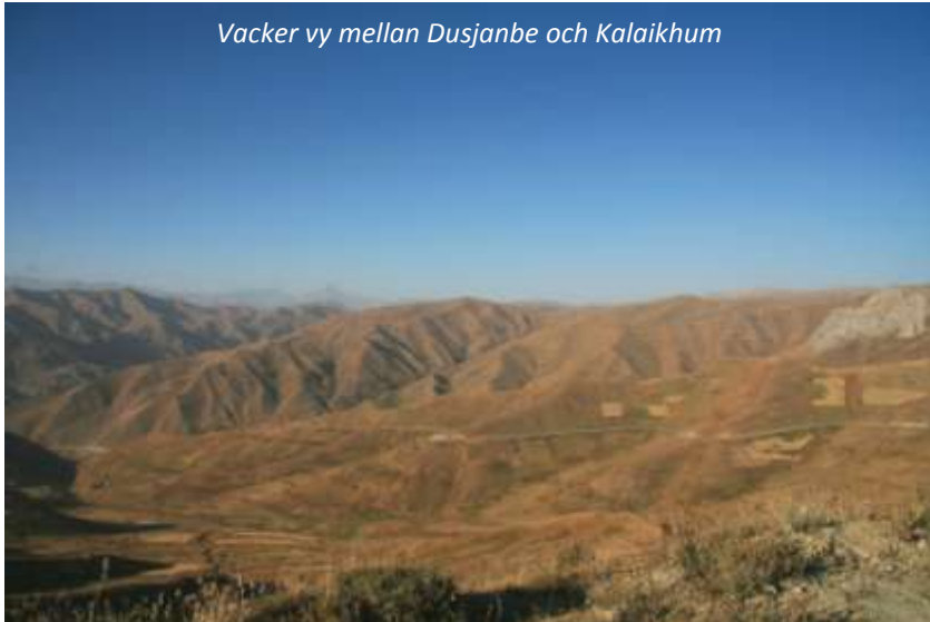
Vacker vy mellan Dusjanbe och Kalaikhum

Tadzjikistans främsta sevärdhet är dess berg; mer än 90 % av landet är berg och över 50 % ligger över 3 000 meters höjd! På morgonen ger vi oss ut på det som är en av världens vackraste resor, Pamir Highway. Pamir heter lokalt Bam-i-Danya, vilket betyder Världens tak , och är ett 120 000 km 2 stort bergslandskap som är uppdelat mellan Tadzjikistan, Kirgizistan, Kina och Afghanistan. Större