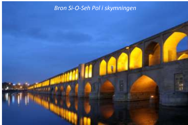
Bron Si-O-Seh Pol i skymningen

Totalt är det cirka 300 km mellan Yazd och dagens mål Isfahan, men det finns mycket intressant och vackert att se längs vägen. Drygt fem mil norr om Yazd ligger staden Meybod, som var huvudstad under Mozaffariddynastin (1314-1393). Här ser vi bland annat en gammal karavanserai samt en av Irans vackraste duvtorn. Detta torn byggdes under Qajardynastin (1794-1925) och var mycket viktigt då duvornas spillning var den enda gödning som fanns tillgänglig. I Nain, 170 km från Yazd, ser vi en