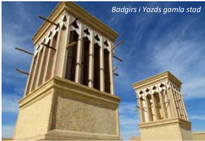
Badgirs i Yazds gamla stad

och får inte förorenas. Därför kan man inte heller begrava eller bränna de döda, utan de läggs istället på så kallade Tystnadens torn på höjder eller bergstoppar för att plockas rena av gamarna. Dessa torn finns fortfarande kvar, även om Iran nu har förbjudit deras traditionella användning. I utkanten av Yazd ligger ett av Irans mest kända Tystnadens torn och vi besöker naturligtvis detta under dagen. På kvällen gör vi ett besök på en traditionell zoorkhaneh , ett sportcentrum där man utövar Varzesh'e Bastani , en typ av