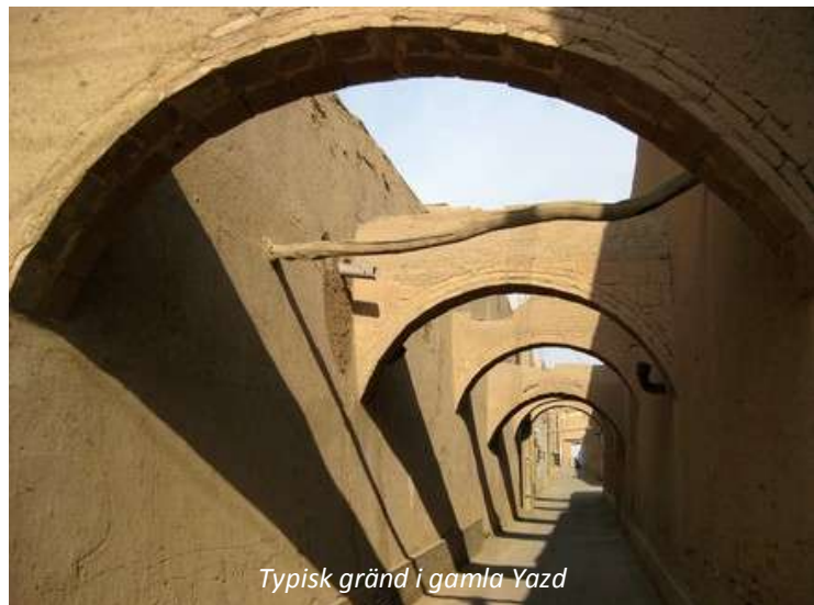
Typisk gränd i gamla Yazd

Yazd är den torraste staden i Iran och en av de absolut varmaste. De hårda förhållandena har hjälpt till att göra staden så intressant - att gå runt i den gamla stadsdelens vindlande gränder och njuta av de brunfärgade husen byggda av lera, de skimrande blå kupolerna och minareterna samt skogen av badgirs , vindtorn eller vindfångare, är verkligen en upplevelse, trots värmen! Badgirs är speciella för Yazdregionen - dessa tornliknande hus är byggda på detta sätt för att fånga upp även den minsta bris och leda den ner till rummen nedanför. En urgammal