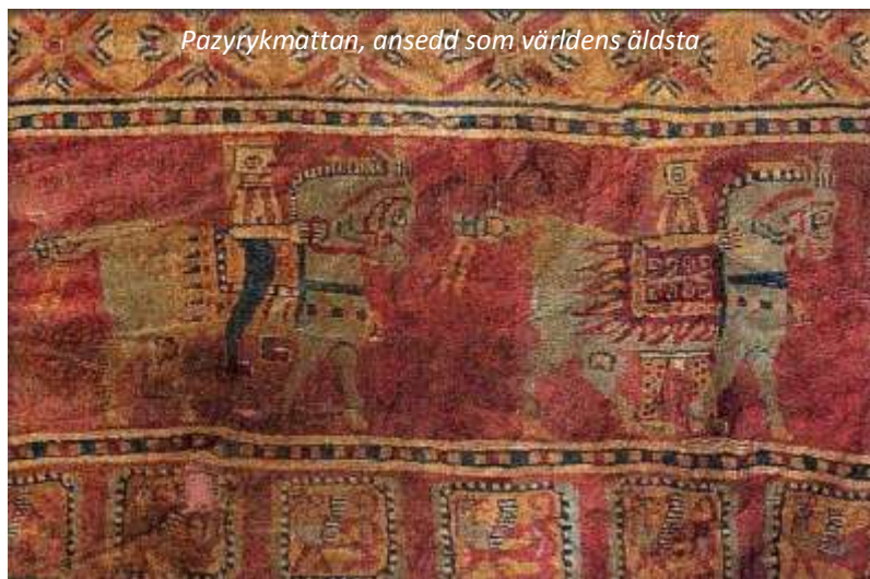
Pazyrykmattan, ansedd som världens äldsta

Efter frukost fortsätter vi att utforska huvudstaden. Vi åker först till det mycket intressanta Nationalmuseet. En stor del av den imponerande samlingen av antika föremål som kan skådas på museet är från det fjärde och femte århundradet f Kr. och innefattar utsökt bearbetade stenfigurer och kilskriftstavor, lergods, vackra keramikföremål och mycket mer. Vi fortsätter härifrån till det berömda mattmuseet, som designades av den forna drottningen Farah