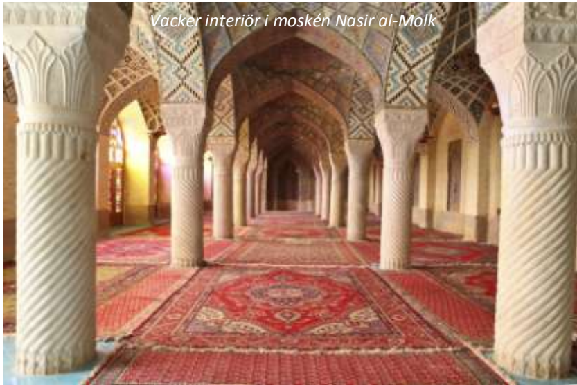
Vacker interiör i moskén Nasir al-Molk

som strömmar emot besökaren. Härifrån fortsätter vi till Karim Khan-borgen, som uppfördes 1766 under Zanddynastin och som fått sitt namn efter den dåtida härskaren. Detta imponerande medeltidsliknande byggnadsverk, med sina karaktäristiska fyra torn, fungerade som bostad för Karim Khan och arméförläggning. Efter Qajardynastins fall 1925 gjordes borgen om till fängelse. Moskén Nasir al-