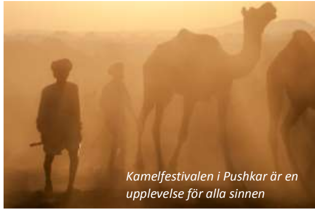
Kamelfestivalen i Pushkar är en upplevelse för alla sinnen