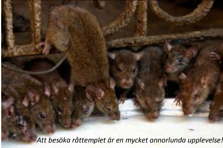
Att besöka råtttemplet är en mycket annorlunda upplevelse!

Vi inleder dagen med en halvdagstur som inkluderar besök på Junagarh Fort och vårt hotells museum. Junagarh Fort och murar är byggda under 1500-talet och innanför finns flera vackra palats och tempel. Den moderna staden Bikaner har byggts runt fortet. Härifrån åker vi till Karni Mata, det kända råtttemplet, utanför staden. Templet byggdes under tidigt 1900-tal av Maharaja Ganga Singh till minne av kvinnan Karni Mata. Legenderna berättar att denna kvinnas styvson drunknade