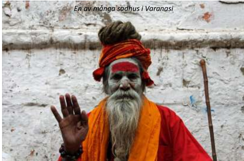
En av många sadhus i Varanasi

stad, som naturligtvis är uppsatt på världsarvslistan. Den mest spektakulära av stadens ghats är Marnikarnika, där döda insvepta kroppar bärs ner på bår och bränns på speciella vedbål innan askan sprids i Ganges. Ritualen utförs av familjen enligt bestämda steg och den döde når direkt brahman/himlen utan återfödelse på detta vis. Varanasi är verkligen en mycket annorlunda stad - var annars får man tränga sig