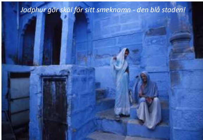
Jodhpur gör skäl för sitt smeknamn - den blå staden!

Efter frukost och drygt fem timmars färd (cirka 220 km) når vi Jodhpur, den blå staden, i utkanten av Tharöknen. Jodhpur är Rajasthans näst största stad och tillhörde kungadömet Marwar. Staden grundades på 1450-talet och över gamla staden tronar fortet Mehrangarh på en bergsklippa. De blåmålade husen har sitt ursprung i att brahminerna, prästerna, målade sina hus i blått för att markera sin status. I natt bor vi på ett charmigt heritage-hotell från 1800-talet med historisk interiör och fina innergårdar. På kvällen