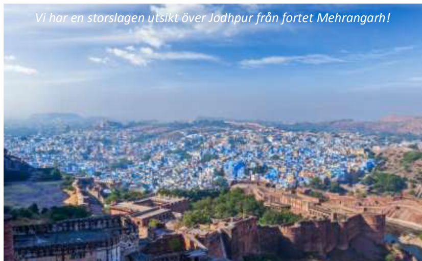
Vi har en storslagen utsikt över Jodhpur från fortet Mehrangarh!

På morgonen besöker vi ett av Indiens största fort, Mehrangarh, med en fantastisk utsikt över staden. Fortet byggdes under Rao Jodha, grundaren av Jodhpur, omkring 1460. Inuti fortet finns ett flertal palats, stora innergårdar och detaljrika sniderier. Vi fortsätter sedan till Jaswant Thada, en vacker begravningsplats för riket Marwars kungar, byggt i marmor. Därefter lämnar vi Jodhpur och reser cirka fem timmar nordöst (243 km) till ökenstaden och utposten Bikaner, belägen mitt i Tharöknen. Bikaner,