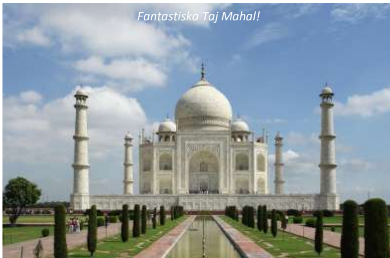
Fantastiska Taj Mahal!

Idag väntar oss något alldeles speciellt på förmiddagen: Taj Mahal! Detta fantastiska mausoleum, det byggdes av mogulhärskaren Shah Jahan åt sin älsklingshustru Mumtaz Mahal, är något alldeles speciellt med sina skimrande vita marmorväggar och vackra dekorationer. Taj Mahal togs redan 1983 upp på Unescos världsarvslista med motiveringen "ett universellt beundrat mästerverk bland världsarv". Den 7 juli 2007