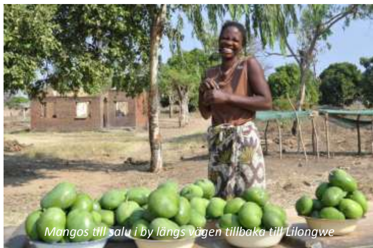
Mangos till salu i by längs vägen tillbaka till Lilongwe

Vi reser idag tillbaka till huvudstaden och passar på att stanna vid någon av de byar vi passerar längs