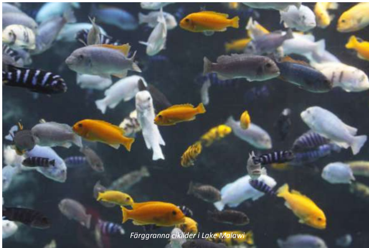
Färggranna ciklider i Lake Malawi