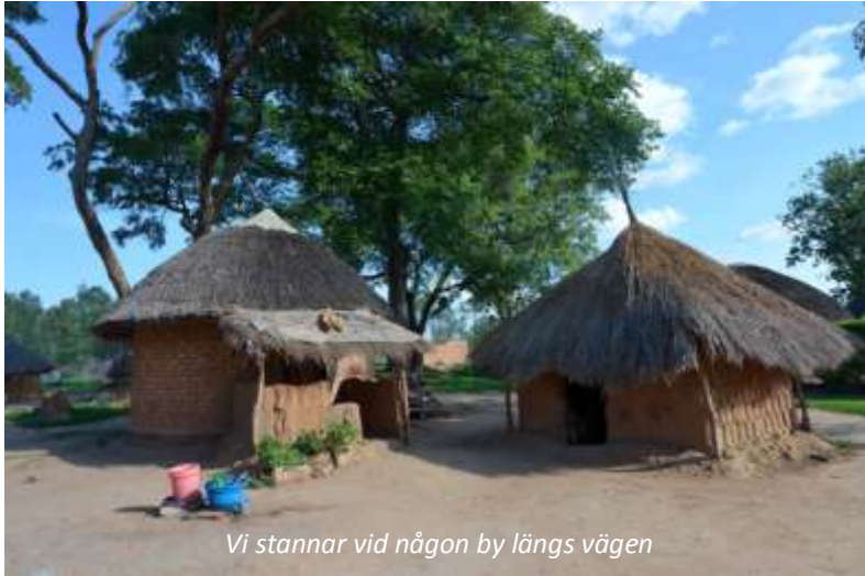
Vi stannar vid någon by längs vägen

På morgonen lämnar vi nationalparken, men passar förstås på att spana efter djur och fåglar på vägen ut. Vi reser sedan genom en vacker landsbygd, där vi passerar flera traditionella byar. Vi stannar vid någon av dessa för att lära oss mer om lokalbefolkningens seder och bruk. Så småningom når vi gränsen till Malawi och fortsätter mot huvudstaden Lilongwe. Malawi har fått smeknamnet Afrikas varma hjärta och detta, med afrikanska