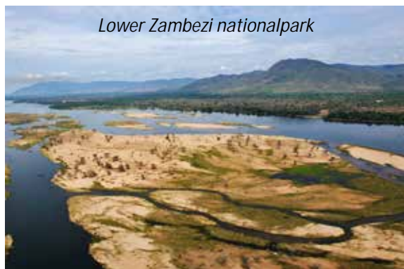
Lower Zambezi nationalpark

Vi landar i Addis Abeba tidigt på morgonen och fortsätter härifrån med Ethiopian Airlines till Lusaka, Zambias huvudstad, där vi landar på eftermiddagen. Lusaka har inga större sevärdheter så vi reser direkt härifrån österut mot nationalparken Lower Zambezi, en resa på cirka tre timmar. Denna nationalpark besöks av få resenärer, vilket är svårt att förstå - den är hela 4092 km 2 stor, men det som verkligen är den stora fördelen är att djuren samlas på slätten vid floden Zambezi. Lower Zambezi är framför allt känt för