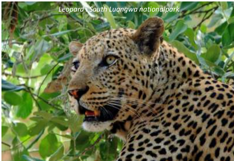
Leopard i South Luangwa nationalpark

Vid gryningen ger vi oss ut på en gamedrive, då djur och fåglar är som mest aktiva i gryning och skymning. Vi äter sedan frukost på lodgen innan vi reser tillbaka till Lusaka, varifrån vi flyger till Mfuwe, som ligger nära Zambias mest berömda, och en av Afrikas bästa, nationalparker - South Luangwa. Den är inte lika känd som till exempel Masai Marai eller Serengeti, vilket också bidrar till dess attraktion - här behöver man inte trängas med mängder med andra