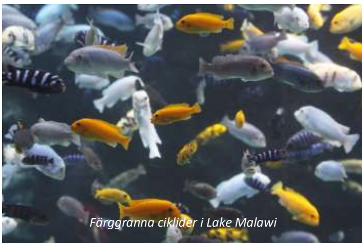
Färggranna ciklider i Lake Malawi

mausoleet Kamuzu. Här ligger Malawis "livstidspresident" Hastings Kamuzu begravd. Han regerade över landet från självständigheten 1961 fram till 1994 och införde ett antal mycket kontroversiella och konservativa lagar - bland annat förbjöd han långt hår för män, många var de som tvångsklipptes på plats om håret gick nedanför kragen, och korta kjolar för kvinnor. Vi fortsätter sedan vår resa genom en mycket grön och lummig landsbygd till landets främsta sevärdhet, Malawisjön. Här