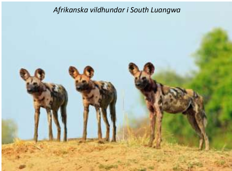
Afrikanska vildhundar i South Luangwa

Efter en tidig gamedrive och frukost på lodgen så byter vi miljö för att se en annan del av nationalparken. Zikomo Safari Camp har endast nio rum, så beroende på hur många enkelrum som önskas så kan ni vara tvungna att dela rum med annan ensamresenär av samma kön. Lodgen ligger i sektorn Nsefu, känt för att vara en av de minst besökta delarna av nationalparken och dessutom ha en av de största koncentrationerna av djurliv. På kvällen ger vi oss ut på en nattsafari för att spana efter