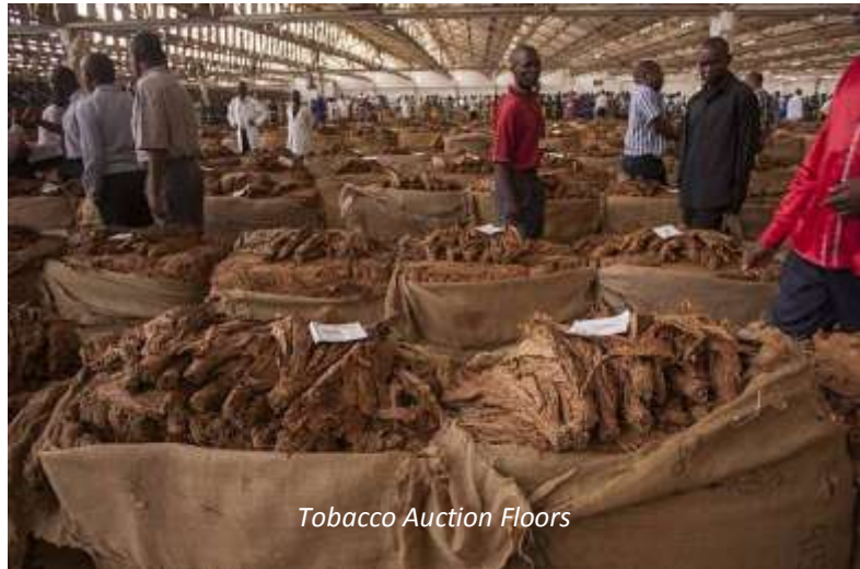
Tobacco Auction Floors

På förmiddagen gör vi en kortare stadsrundtur som vi börjar med Tobacco Auction Floors - en av Malawis främsta inkomstkällor är tobak och i denna marknadshall säljs skördarna, sorterade efter sort och kvalitet. Lukten av tobak hänger tung i magasinet och det är en upplevelse att se hur köparna går runt och bedömer buntarna av torkade tobaksblad! Vi fortsätter sedan in till staden där vi gör ett kort besök på den av liv och färger sprudlande marknaden innan vi fortsätter till mausoleet Kamuzu. Här ligger Malawis "livstidspresident" Hastings Kamuzu begravd. Han regerade över landet från självständigheten 1961 fram till 1994 och införde ett antal mycket kontroversiella och konservativa lagar - bland annat förbjöd han långt hår för män, många var de som tvångsklipptes på plats om håret gick nedanför kragen, och korta kjolar för kvinnor. Vi fortsätter sedan vår resa genom en mycket grön och lummig landsbygd till landets främsta sevärdhet, Malawisjön. Här kommer vi att bo på ett mycket charmigt hotell med en prunkande trädgård, beläget precis vid sjöns södra strand - kanske ett dopp i det klara vattnet lockar efter ankomsten? Här finns också en stor pool och ett spa.