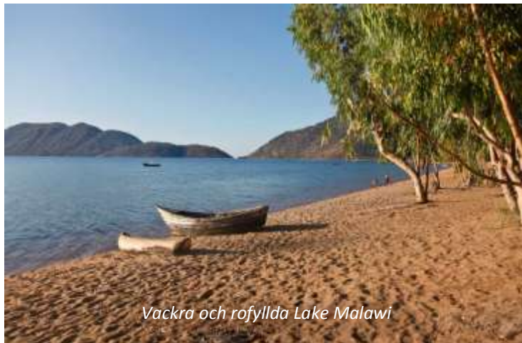
Vackra och rofyllda Lake Malawi

The Makokola Retreat (3*). Frukost, lunch, middag.