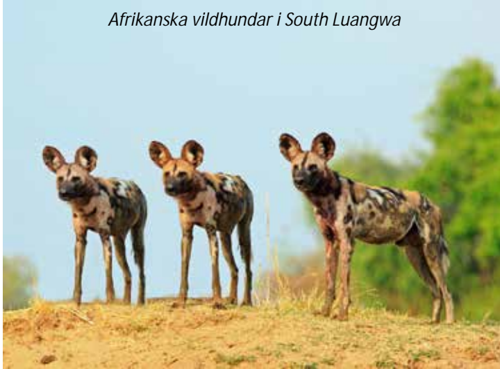
Afrikanska vildhundar i South Luangwa

Efter en tidig gamedrive och frukost på lodgen så byter vi miljö för att se en annan del av nationalparken. Zikomo Safari Camp har endast nio rum, så beroende på hur många enkelrum som önskas så kan ni vara tvungna att dela rum med annan ensamresenär av samma kön. Lodgen ligger i sektorn Nsefu, känt för att vara en av de minst besökta delarna av nationalparken och dessutom ha en av de största koncentrationerna av djurliv. På kvällen ger vi oss ut på en nattsafari för att spana efter nattaktiva djur och fåglar. South