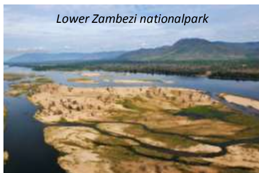
Lower Zambezi nationalpark

Vi landar i Addis Abeba tidigt på morgonen och fortsätter härifrån med Ethiopian Airlines till Lusaka, Zambias huvudstad, där vi landar på eftermiddagen. Lusaka har inga större sevärdheter så vi reser direkt härifrån österut mot nationalparken Lower Zambezi, en resa på cirka tre timmar. Denna nationalpark besöks av få resenärer, vilket är svårt att förstå - den är hela 4.092 km 2 stor, men det som verkligen är den stora fördelen är att djuren samlas på slätten vid floden Zambezi. Lower Zambezi är framför allt känt för sina enorma