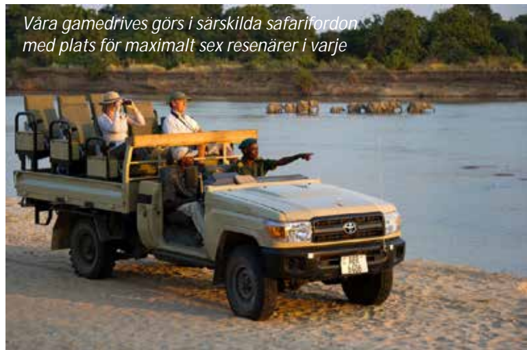
Våra gamedrives görs i särskilda safarifordon med plats för maximalt sex resenärer i varje

Zikomo Safari Camp (3*). Frukost, lunch, middag.