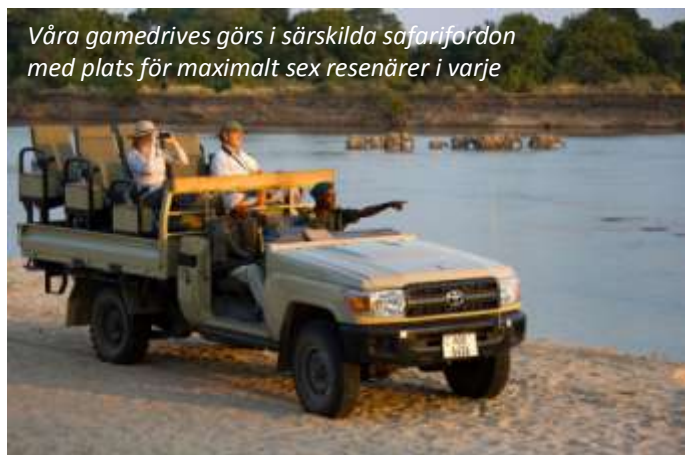
Våra gamedrives görs i särskilda safarifordon med plats för maximalt sex resenärer i varje

Flatdogs Camp (3*). Frukost, lunch, middag.