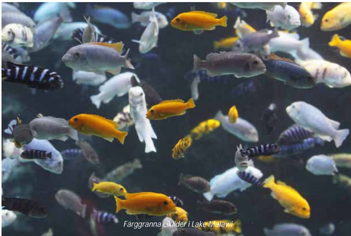
Färggranna ciklider i Lake Malawi