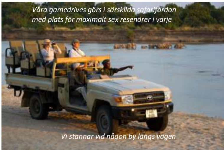
Våra gamedrives görs i särskilda safarifordon med plats för maximalt sex resenärer i varje

Zikomo Safari Camp (3*). Frukost, lunch, middag.