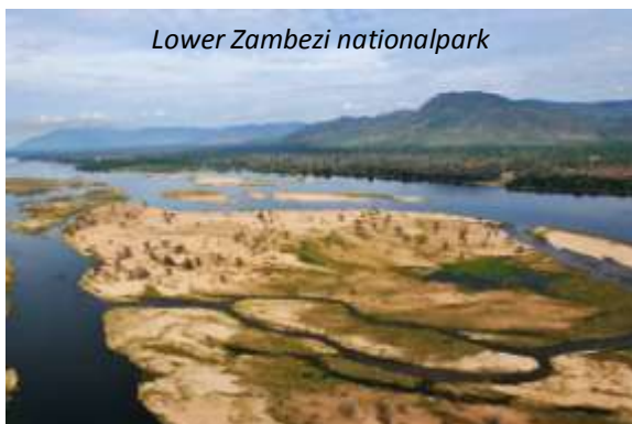
Lower Zambezi nationalpark