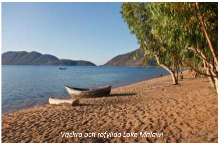
Vackra och rofyllda Lake Malawi

Det som Malawisjön framför allt är känt för är cikliderna. Sjön är hem för mer än 30 % av världens arter av dessa färggranna fiskar och de arter som lever här är endemiska (det vill säga de finns bara här) för sjön! Att ge sig ut med mask och snorkel och se dessa fantastiskt färgade fiskar känns som att snorkla vid ett korallrev - det är svårt att förstå att det är sötvatten och att det är en insjö vi befinner oss vid. Sjön är förklarad som nationalpark och är uppsatt på Unescos världsarvslista,