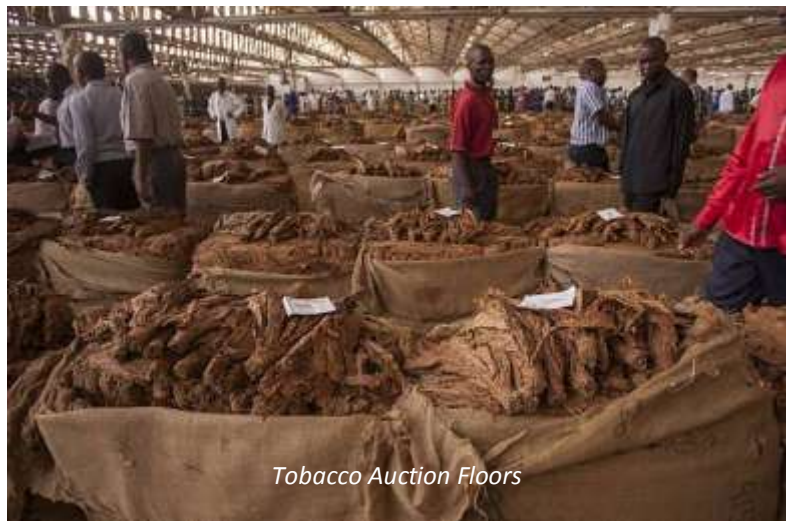
Tobacco Auction Floors

På förmiddagen gör vi en kortare stadsrundtur som vi börjar med Tobacco Auction Floors - en av Malawis främsta inkomstkällor är tobak och i denna marknadshall säljs skördarna, sorterade efter sort och kvalitet. Lukten av tobak hänger tung i magasinet och det är en upplevelse att se hur köparna går runt och bedömer buntarna av torkade tobaksblad! Vi fortsätter sedan in till staden där vi gör ett kort besök på den av liv och färger sprudlande marknaden innan vi fortsätter till