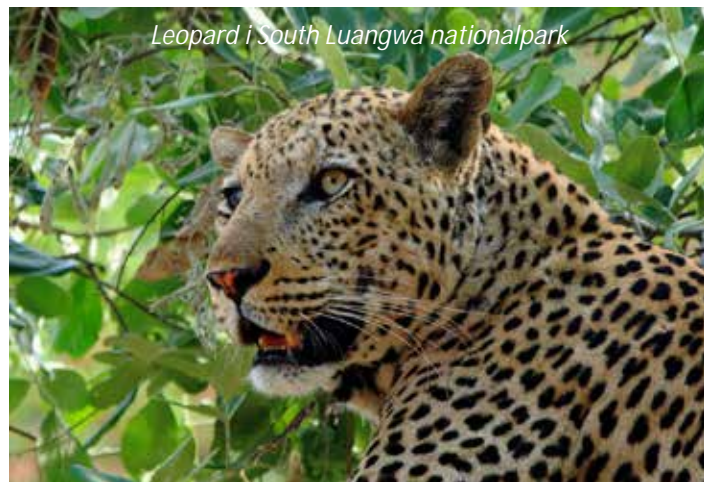
Leopard i South Luangwa nationalpark

Efter frukost åker vi tillbaka till Lusaka, varifrån vi flyger till Mfuwe, som ligger nära Zambias mest berömda, och en av Afrikas bästa, nationalparker: South Luangwa. Den är inte lika känd som till exempel Masai Marai eller Serengeti, vilket också bidrar till dess attraktion - här behöver man inte trängas med mängder med andra safarifordon. Här bor vi de första nätterna på en mycket charmig lodge som ligger mycket nära infarten till nationalparken. Redan denna eftermiddag ger vi oss ut på vår första game drive i South Luangwa.