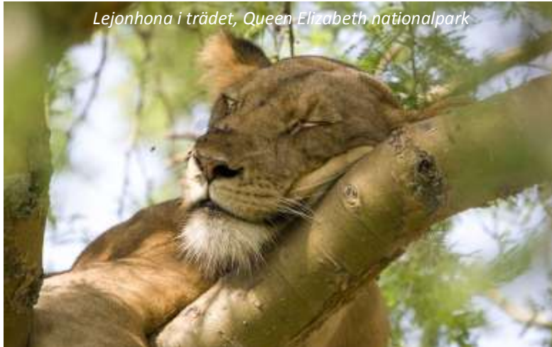
Lejonhona i trädet, Queen Elizabeth nationalpark

Efter en lång, men oförlömlig, dag igår kan det vara skönt med lite massage - chaufförer i Uganda brukar skämtsamt kalla behandlingen de dåliga vägarna ger för African massage! Under dagen förflyttar vi oss från den södra delen av Bwindi, åker runt och delvis genom parken och når så småningom staden Kihihi, som ligger mellan nationalparkerna Bwindi och Queen Elizabeth. Här sover vi inatt på ett hotell med relativt enkla rum, men med en