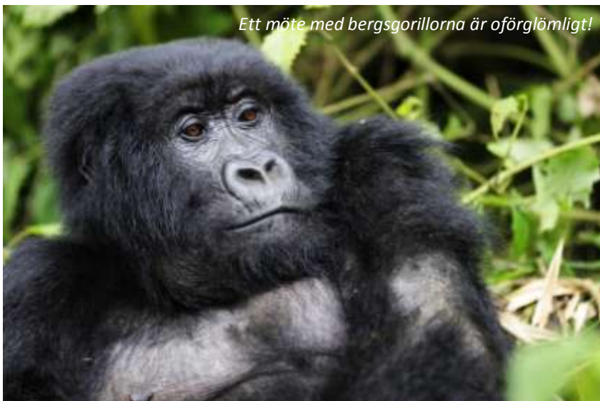
Ett möte med bergsgorillorna är oförglömligt!

En magisk dag väntar; vi ska möta bergsgorillorna! Det finns bara cirka 700 individer kvar av denna världens största primat och hälften av dessa lever just i Bwindi, som därför är uppsatt på Unescos lista över världsarv sedan 1994. Vi kommer att delas upp, då maximalt åtta besökare tillåts per dag till varje grupp. Hur långt vi kommer att behöva gå beror helt på var grupperna befinner sig, det kan krävas allt från en