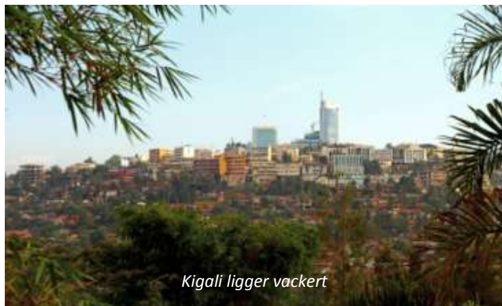
Kigali ligger vackert

Vi flyger tidigt på morgonen med KLM från Stockholm, Göteborg, Linköping eller Köpenhamn till Amsterdam. Efter ett par timmars väntan fortsätter vi med samma flygbolag direkt till Kigali, Rwandas huvudstad, där vi landar på kvällen. Våra chaufförer kommer att möta oss vid ankomsten och köra oss till hotellet, som är stadens mest anrika. Den dåvarande hotelldirektören Paul Rusesabagina lät öppna hotellets dörrar för flyende tutsier och moderata hutus under folkmordet 1994. Med sprit och cigaretter mutade han milisen Interahamwe för att få dem att låta bli att storma hotellet i sin jakt på tutsier. Genom sina livsavgörande val räddade han livet på tusentals människor. Han och hotellet var förebild för filmen Hotel Rwanda från 2004. Vi rekommenderar varmt att se denna film före resan!