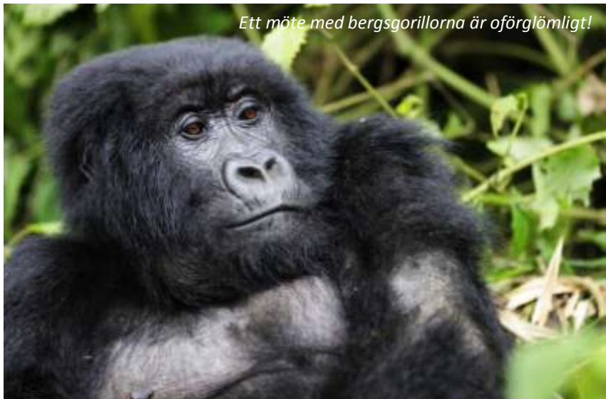
Ett möte med bergsgorillorna är oförglömligt!

En magisk dag väntar; vi ska möta bergsgorillorna! Det finns bara cirka 700 individer kvar av denna världens största primat och hälften av dessa lever just i Bwindi, som därför är uppsatt på Unescos lista över världsarv sedan 1994. Vi kommer att delas upp, då maximalt åtta besökare tillåts per dag till varje grupp. Hur långt vi kommer att behöva gå beror helt på var grupperna befinner sig, det kan krävas allt från en