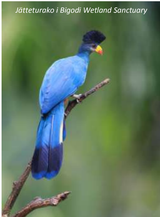
Jätteturako i Bigodi Wetland Sanctuary

På vägen ut genom nationalparken tidigt på morgonen gör vi en kortare game drive; om vi inte har sett leopard tidigare så finns fortfarande möjlighet idag! Vi fortsätter sedan norrut och på vägen till Kibale passerar vi ekvatorn. Vi stannar naturligtvis till för att kunna ta fotografier vid monumentet som markerar det exakta läget! Naturen är fortsatt väldigt vacker och från vägen har vi utsikt över flera kratersjöar. Efter cirka fyra timmars resa kommer vi fram till Kibale nationalpark. Vårt utforskande av denna berömda nationalpark börjar redan denna eftermiddag då vi gör en utflykt till Bigodi Wetlands Sanctuary. Här kommer vi att gå en guidad promenad i dessa vackra och mångskiftande våtmarker. Vi kommer att se många färggranna fjärilar och har goda möjligheter att se flera arter av apor, bland annat den endemiska och sällsynta Ugandaguerezan ( Procolobus tephrosceles ). Bigodi är dock framför allt känt för sitt fantastiska fågelliv, till exempel har vi mycket goda chanser att se den praktfulla jätteturakon ( Corythaelo cristata ).