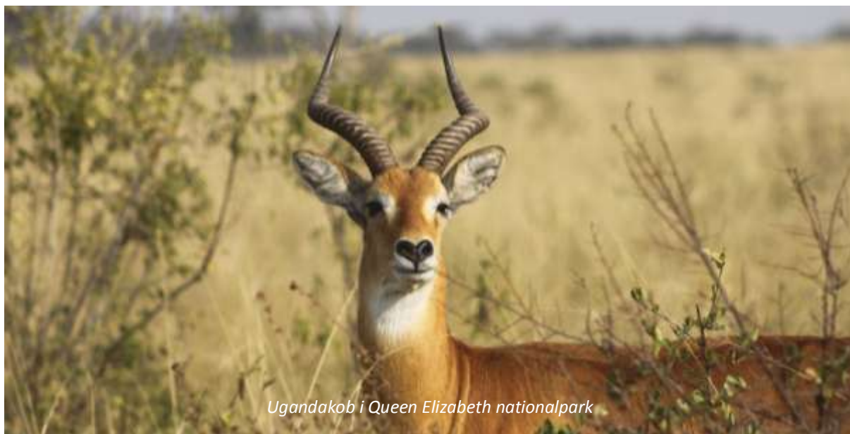
Ugandakob i Queen Elizabeth nationalpark