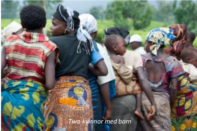
Twa-kvinnor med barn

Vi kommer att förstå varför Rwanda kallas för De tusen kullarnas land när vi idag reser norrut. Det är en vacker resa som tar oss genom ett kuperat och mycket grönt landskap. Ju längre norrut vi kommer desto närmare kommer de mäktiga Virungabergen som utgör Rwandas gräns mot grannländerna Demokratiska Republiken Kongo (Kongo-Kinshasa) och Uganda. På eftermiddagen gör vi en promenad till en twa-by i närheten. Twastammen är en av de stammar