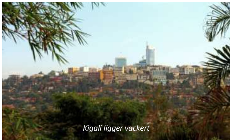
Kigali ligger vackert

Vi flyger tidigt på morgonen med KLM från Stockholm, Göteborg, Linköping eller Köpenhamn till Amsterdam. Efter ett par timmars väntan fortsätter vi med samma flygbolag direkt till Kigali, Rwandas huvudstad, där vi landar på kvällen. Våra chaufförer kommer att möta oss vid ankomsten och köra oss till hotellet, som är stadens mest anrika. Den dåvarande hotelldirektören Paul Rusesabagina lät öppna hotellets dörrar för flyende tutsier och moderata hutus under folkmordet 1994. Med sprit och cigaretter mutade han milisen Interahamwe för att få dem att låta bli att storma hotellet i sin jakt på tutsier. Genom sina livsavgörande val räddade han livet på tusentals människor. Han och hotellet var förebild för filmen Hotel Rwanda från 2004. Vi rekommenderar varmt att se denna film före resan!