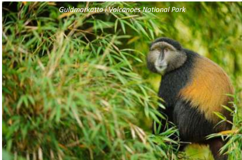
Guldmakatta i Volcanoes National Park

Vår dag i denna spektakulära nationalpark börjar efter frukost då vi ger oss ut för att söka upp de sällsynta guldmakattorna. Denna apa är endemisk för detta område och finns endast på lite högre höjd i Rwanda samt närliggande nationalparker i Uganda och Kongo-Kinshasa. Endast sex personer tillåts i grupperna, så vi kommer att delas upp och leta efter olika flockar av makattorna. Det är en vacker promenad vi gör, även om den stundtals kan