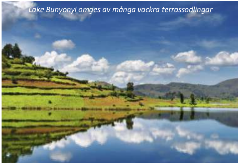
Lake Bunyonyi omges av många vackra terrassodlingar

Efter frukost reser vi norrut och korsar gränsen till Uganda. Landskapet är fortsatt bördigt och bergigt och vi gör stopp längs vägen för att fotografera vackra vyer och möten med människor. Uganda är ett land med många vackra sjöar och vi kommer fram till den vackraste av dem alla, Lake Bunyonyi, mitt på dagen. Detta är också Afrikas näst djupaste sjö och har 29 öar - vi bor på en av dessa och har sedan resten av dagen ledig för egna promenader på ön eller kanske ett dopp i det