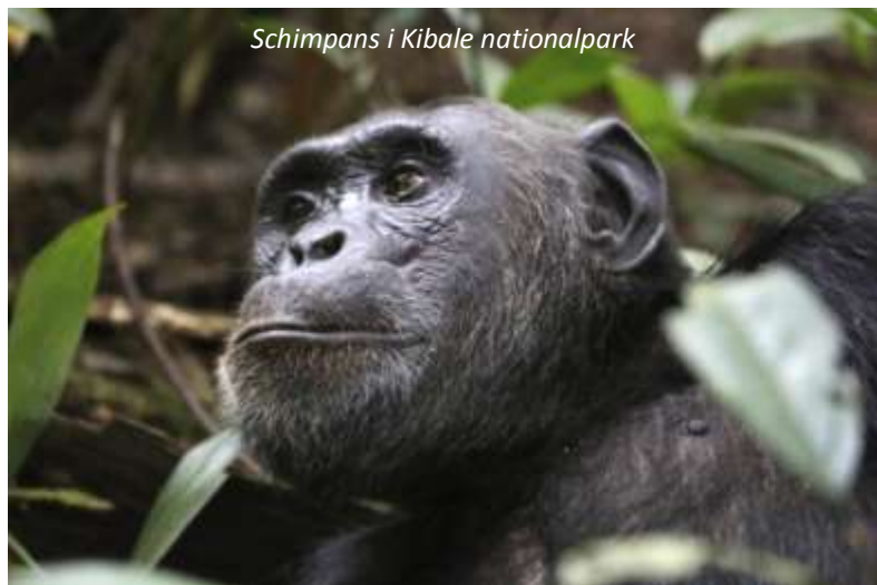
Schimpans i Kibale nationalpark

Denna nationalparks 795 km 2 är hem för hela 13 primatararter, men de mest välkända är förstås schimpanserna. Kibale är utan tvekan en av världens bästa platser för att se dessa fantastiska människoapor. Det ska sägas att det är betydligt svårare att få bra fotografier av schimpanserna än gorillorna, då de rör sig mycket snabbt och ofta håller till en bit upp i träden. Då maximalt sex personer tillåts till varje schimpansgrupp, så kommer vi även här att delas upp