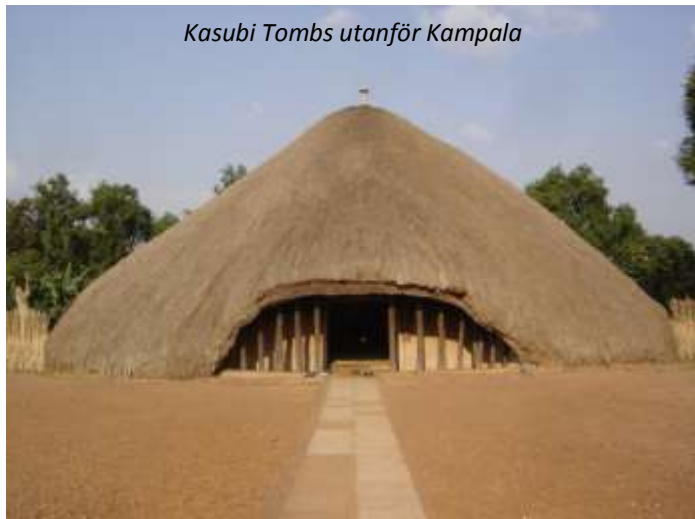
Kasubi Tombs utanför Kampala

härligt folkliv! Vi besöker bland annat det mycket intressanta Uganda Museum, den imponerande Namirembe-katedralen och parlamentshuset. Vi fortsätter sedan till Kasubi Tombs; denna plats är ett av Ugandas tre Unesco-världsarv. Tyvärr förstördes större delen av komplexet i en brand 2010 och återuppbyggnaden pågår men går långsamt. Kasubi byggdes 1882 som ett palats för kung Mutesa I, kung över Bugandariket som gett namn åt landet. När han dog två år senare gjordes palatset om till grav och även de tre nästföljande kungarna begravdes här. Runtom finns hus som fungerade som