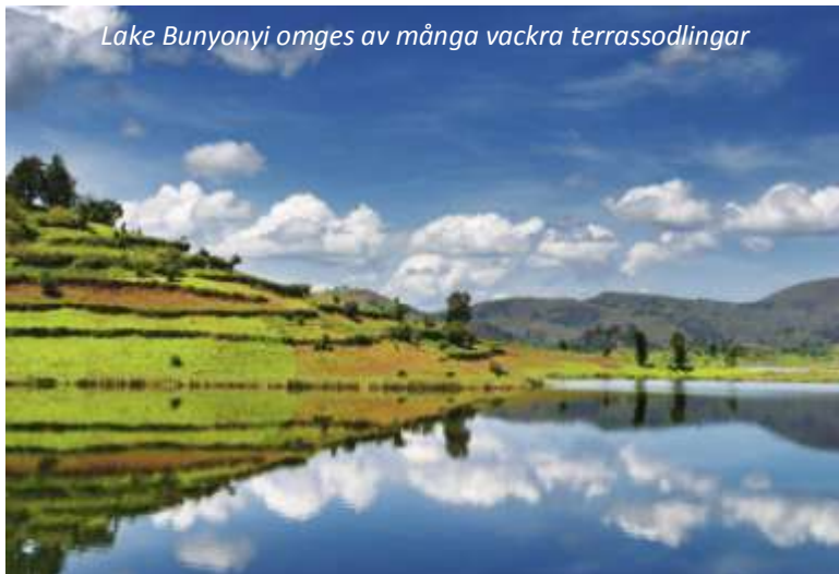
Lake Bunyonyi omges av många vackra terrassodlingar

Efter frukost reser vi norrut och korsar gränsen till Uganda. Landskapet är fortsatt bördigt och bergigt och vi gör stopp längs vägen för att fotografera vackra vyer och möten med människor. Uganda är ett land med många vackra sjöar och vi kommer fram till den vackraste av dem alla, Lake Bunyonyi, mitt på dagen. Detta är också Afrikas näst djupaste sjö och har 29 öar - vi bor på en av dessa och har sedan resten av dagen ledig för egna promenader på ön eller kanske ett dopp i det