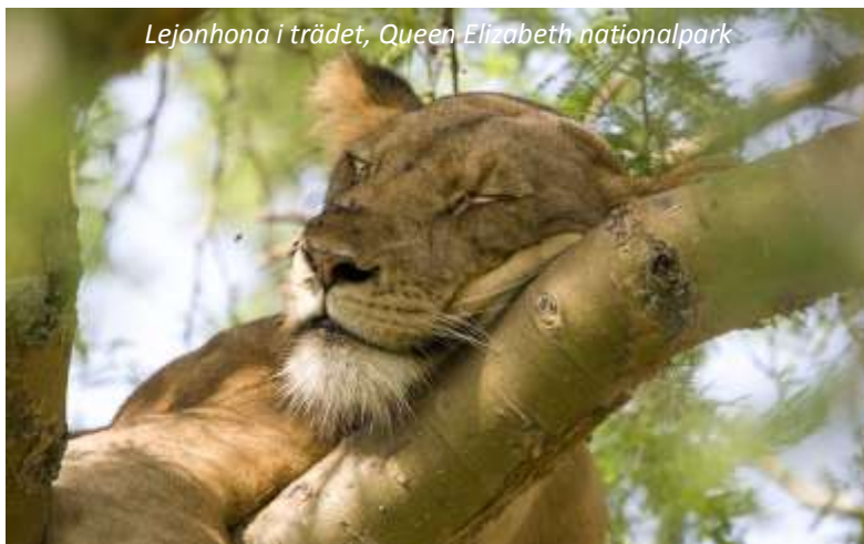
Lejonhona i trädet, Queen Elizabeth nationalpark

Efter en lång, men oförlömlig, dag igår kan det vara skönt med lite massage - chaufförer i Uganda brukar skämtsamt kalla behandlingen de dåliga vägarna ger för African massage! Under dagen förflyttar vi oss från den södra delen av Bwindi, åker runt och delvis genom parken och når så småningom staden Kihihi, som ligger mellan nationalparkerna Bwindi och Queen Elizabeth. Här sover vi inatt på ett hotell med relativt enkla rum, men med en