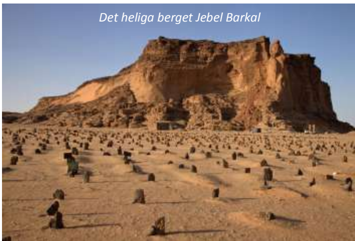
Det heliga berget Jebel Barkal

Efter frukost lämnar vi huvudstaden bakom oss och reser norrut genom Västra öknen. Under resorna delar vi upp oss i fyrhjulsdrivna fordon och alla kommer att få en fönsterplats. Vi gör flera stopp längs vägen och det första av dessa är vid den vackra oasen Wadi Muqaddam med sina många akaciaträd, där vi äter lunch på något av de traditionella tehusen. På eftermiddagen kommer vi fram till vårt charmiga hotell, byggt i traditionell stil, som ligger precis vid Nilen och vid foten av berget Jebel Barkal. Detta berg ansågs som heligt både av de gamla egyptierna och de nubiska faraonerna. Faktiskt ses berget