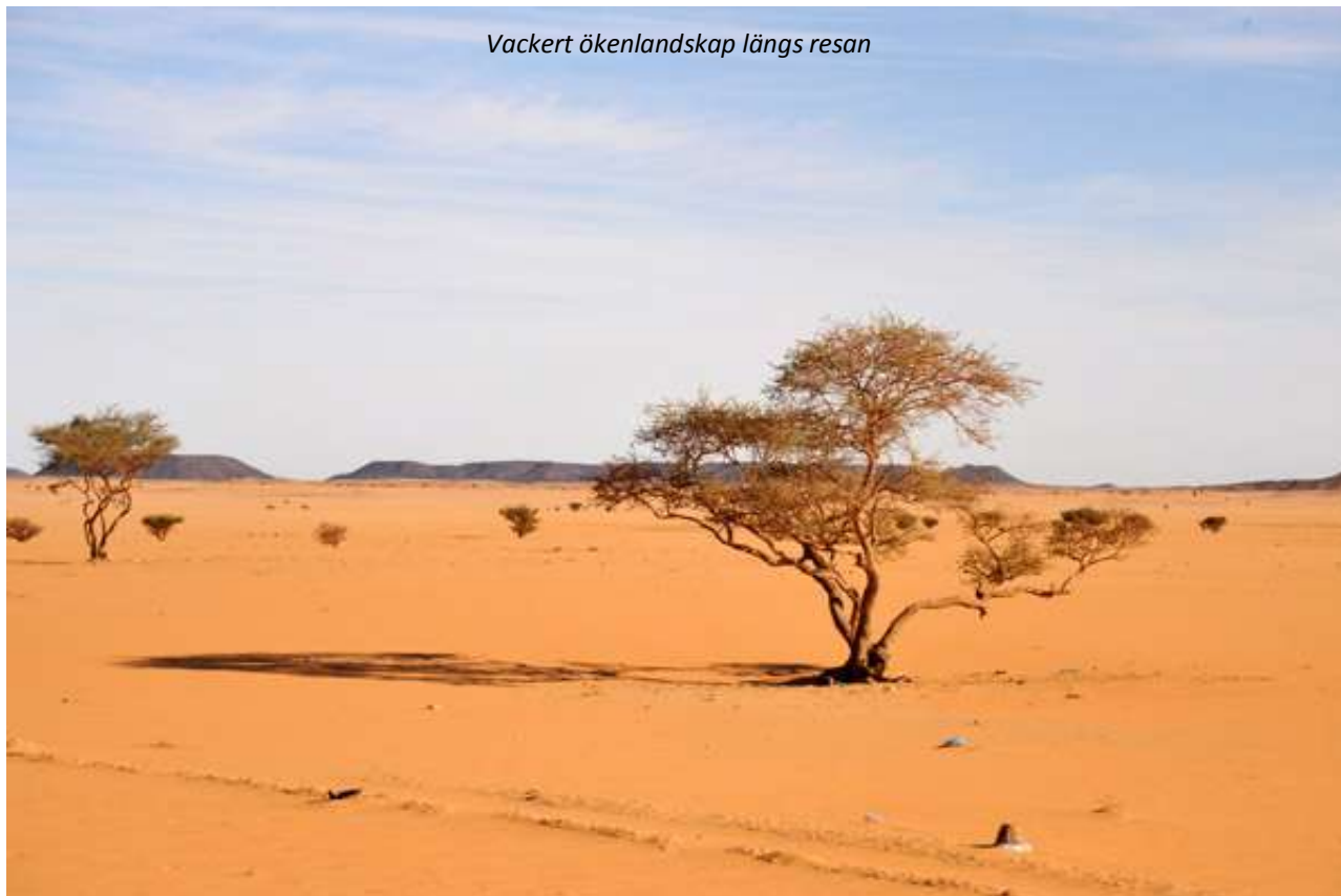
Vackert ökenlandskap längs resan