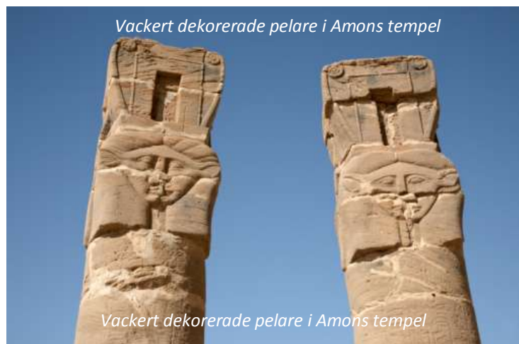
Vackert dekorerade pelare i Amons tempel

Jebel betyder berg på arabiska och Jebel Barkal har i årtusenden varit ett landmärke i detta annars så flacka område. Vid foten av detta vackra röda sandstensberg ligger lämningar efter ett mäktigt tempel tillägnat de nubiska faraonerna och deras beskyddare guden Amon. Från dessa ruiner står flera stora, skulpterade granitstycken som man antar skulle stå längsmed vägen ner till en hamn vid Nilen. Amons tempel tros vara från 1200-talet f Kr men förstörades och byggdes till under de århundraden som följde. När romarna erövrade Nubien 25-24 f Kr lät man förstöra