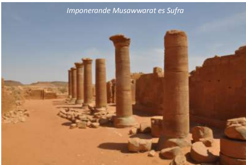
Imponerande Musawwarat es Sufra

Dagens resa går söderut tillbaka mot huvudstaden. Vi stannar och går runt i staden Shendis livliga marknad innan vi når Musawwarat es Sufra, en av resans största sevärdheter. Denna plats, liksom Naqa, ingår i världsarvet Meroë. Musawwarat es Sufra är ett stort meroitiskt tempelkomplex, vars huvuddel byggdes på 200-talet f Kr. Denna täcker en stor yta, cirka 45 000 m 2 och har ett nästan labyrintliknande upplägg. Här ser vi många skulpturer och figurer föreställande djur, bland annat många elefanter vilket visar på betydelsefulla dessa djur måste ha