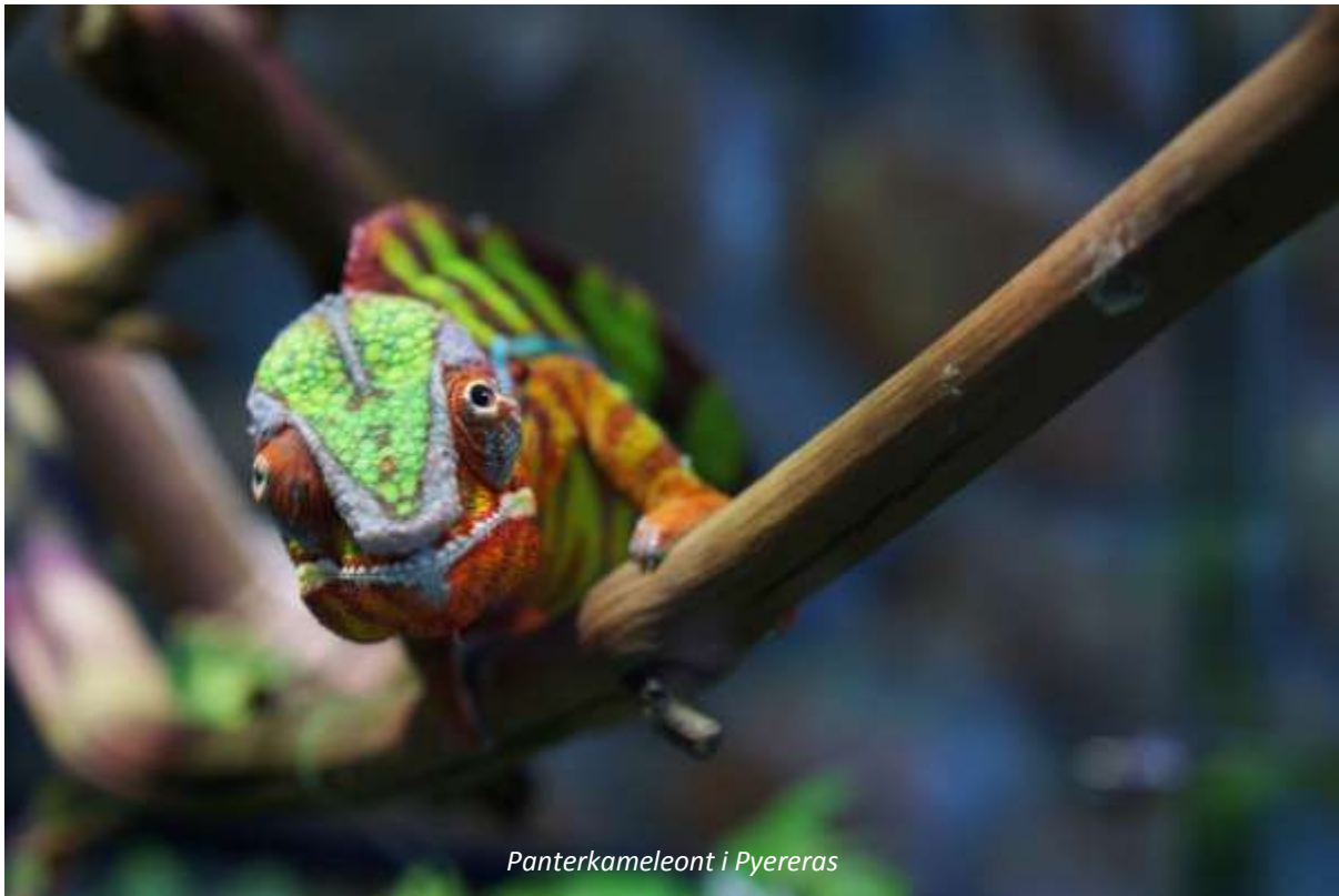
Panterkameleont i Pyereras