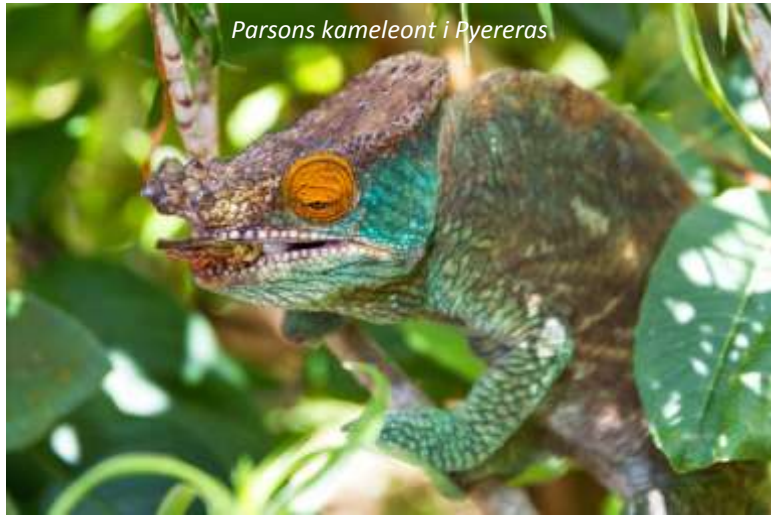
Parsons kameleont i Pyereras

Efter frukost reser vi österut genom ett grönt och lummigt landskap. Vi stannar vid Pyereras, ett litet men mycket välskött zoo som också föder upp bland annat kameleonten och lövsvarsgeckos. Här ser vi bland annat den fantastiskt färgade panterkameleonten, som kan gå i regnbågens alla färger, från knallblått till skinande rött! Denna region har det fuktigaste klimatet på ön, vilket vi kan se när vi kommer fram till Andasibe där vi möts av regnskog. På vägen