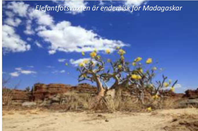
Elefantfotsväxten är endemisk för Madagaskar