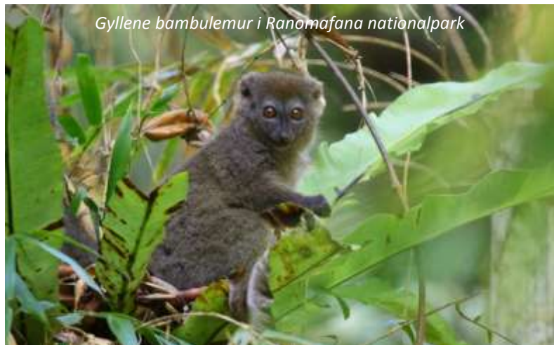
Gyllene bambulemur i Ranomafana nationalpark

Ranomafana nationalpark är 415 km 2 stor och är täckt av molnskog; ett namn som kommer sig av att lågländernas varma luft här möter högländernas kyligare och bildar kondens, vilket på morgnar och kvällar täcker in skogen i dimma. Här finns därför en mångfald av epifyter, det vill säga växter som växer på andra växter som till exempel orkidéer. Ranomafana är också känt för sitt fantastiska djurliv; här lever hela 12 arter av lemurer!