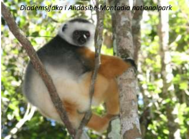
Diademsifaka i Andasibe-Mantadia nationalpark

Efter frukost börjar vi att utforska nationalparken Andasibe-Mantadia, som är en av de mest intressanta i Madagaskar. I parken finns elva lemurararter av vilka den mest berömda är Andasibes huvudattraktion, indrin . Denna svartvita lemur är den största lemurarten i världen och är framför allt känd, förutom för sitt charmiga yttre, för sina öronbedövande skrik! Det finns relativt gott om dem i Andasibe, så vi har mycket goda chanser att se dem. Andasibe är också den bästa nationalparken på ön för att se diademsifakan, som många anser vara den