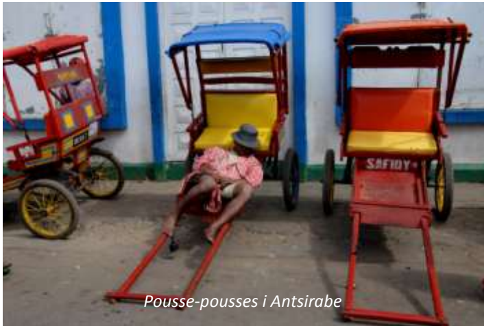
Pousse-pousses i Antsirabe

Efter frukost åker vi ut med så kallade pousse-pousse , handdragna rickshaws som finns i flera städer i Madagaskar. Vi ser bland annat de gamla baden som gjorde Antsirabe berömt på 1800-talet och hantverkskvarteren. Antsirabe är känt för sin tillverkning av aluminiumgrytor i olika storlekar, som tillverkas av kasserat material, och ädelstenar av olika slag. Vi fortsätter sedan söderut och viker så småningom av från huvudvägen. Sent på eftermiddagen kommer vi fram till Ranomafana. Denna nationalpark