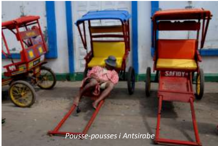
Pousse-pousses i Antsirabe

Efter frukost åker vi ut med så kallade pousse-pousse , handdragna rickshaws som finns i flera städer i Madagaskar. Vi ser bland annat de gamla baden som gjorde Antsirabe berömt på 1800-talet och hantverkskvarteren. Antsirabe är känt för sin tillverkning av aluminiumgrytor i olika storlekar, som tillverkas av kasserat material, och ädelstenar av olika slag. Vi fortsätter sedan söderut och viker så småningom av från huvudvägen. Sent på eftermiddagen kommer vi fram till Ranomafana. Denna nationalpark