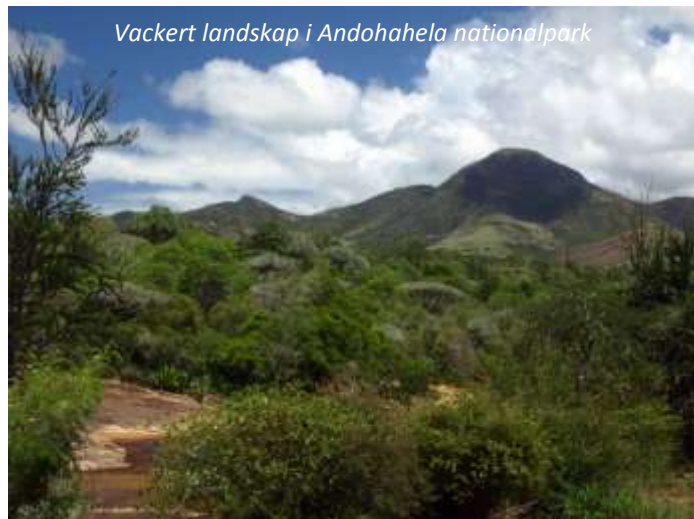
Vackert landskap i Andohahela nationalpark

emot 90 % av både flora och fauna finns endast i detta område av denna fascinerande ö. Andohahela är 760 km 2 stort och omfattar de sista kvarvarande tropiska skogarna i denna del av landet. Höjden i nationalparken sträcker sig från 100 till 2 000 meter över havet, så mångfalden här är imponerande. Här finns hela 130 fågelarter, 67 reptilarter (bland annat några mycket sällsynta arter av geckoödlor, sköldpaddor och ormar) och 50 arter amfibiedjur. Även floran är mycket rik och man hittar här bland mycket annat den för området endemiska trihedralpalmen. Vi kommer att gå en promenad i nationalparken och fortsätter sedan tillbaka till Tolanaro, dit vi kommer åter sent på eftermiddagen.