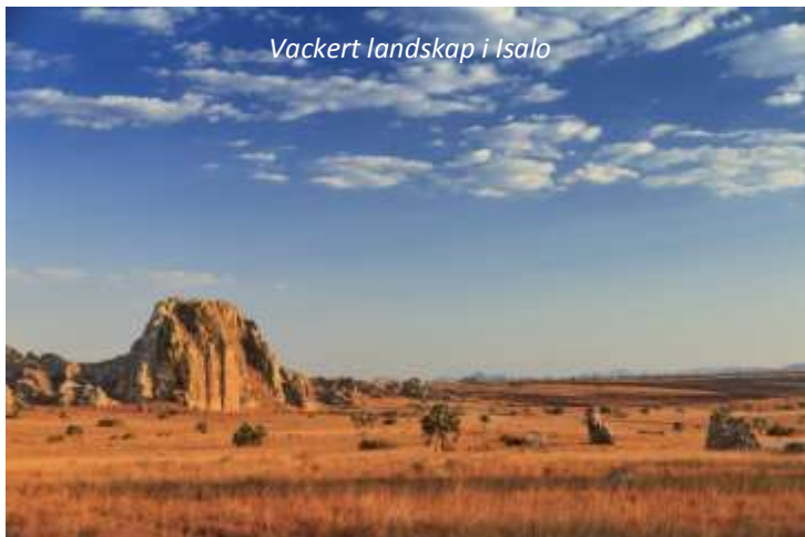
Vackert landskap i Isalo