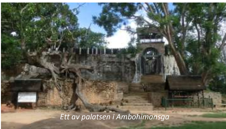
Ett av palatsen i Ambohimanga

På morgonen åker vi till ett annat av Madagaskars tre världsarv; den kungliga byn och begravningsplatsen Ambohimanga. Denna plats anses vara landets födelseplats och är därför mycket betydelsefull för den nationella identiteten. Ambohimanga grundades år 1700 av kung Andriatsmitoviamin-Andriandrazaka. I början av 1700-talet delade Merinakungen upp sitt rike och gav Ambohimanga åt en av sina söner,