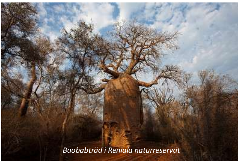
Baobabträd i Reniala naturreservat

Tidigt på morgonen gör vi en utflykt till det närbelägna naturreservatet Reniala, som är ett av de få skyddade områden som instiftats för att värna om den unika typ av växtlighet som sydvästra Madagaskar är ensamt om; taggskog. Var namnet kommer från är lätt att förstå, då många växter har utvecklat försvar i form av stora taggar. I Reniala så ser vi också en baobabart i många olika former; en ser ut som en flaska, en är delad i två stammar och den