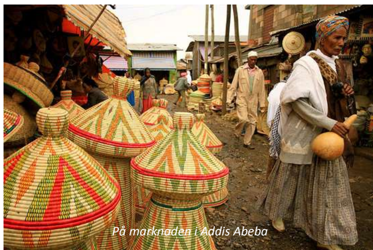
På marknaden i Addis Abeba

Vi flyger på kvällen från Arlanda med Ethiopian Airlines, som är ett av världens snabbast växande flygbolag och som 2015 fick pris som bästa flygbolag i regionen under den årliga branschgalan i Washington. Vi hjälper er gärna med att boka anslutningsflyg från andra orter. Detta ingår dock ej i