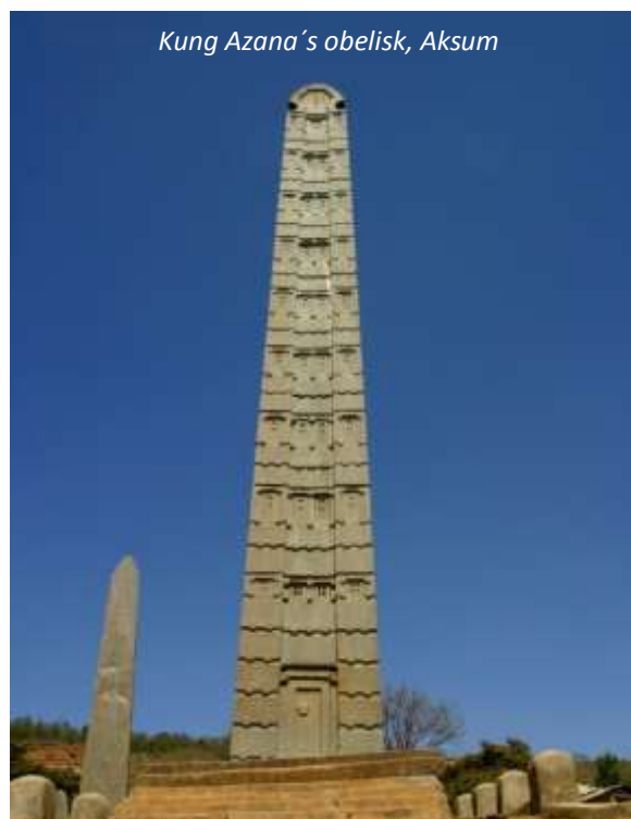
Kung Azana's obelisk, Aksum

Aksum, också ett av landets världsarv, var enligt legenden drottningen av Sabas huvudstad på 900-talet f Kr. Det var hit som denna berömda drottning och kung Salomon förde arken med Guds budord, och det sägs att den fortfarande finns bevarad här! Allt enligt lokal sägen; säkert är dock att Aksum var huvudstad för ett av Afrikas äldsta riken och var vida känt både bland greker och romare runt tiden för Kristi födelse som en stor och mäktig stad. Under nästan 1 000 år så dominerade Aksum handeln mellan Afrika och Asien, med sitt strategiskt viktiga läge nära Röda havet. På eftermiddagen besöker vi den imponerande obeliskparken, med sina enorma och rikt