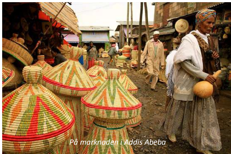
På marknaden i Addis Abeba

Vi flyger på kvällen från Arlanda med Ethiopian Airlines, som är ett av världens snabbast växande flygbolag och som 2015 fick pris som bästa flygbolag i regionen under den årliga branschgalan i Washington. Vi hjälper er gärna med att boka anslutningsflyg från andra orter. Detta ingår dock ej i