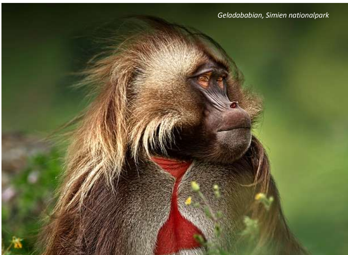
Geladababian, Simien nationalpark