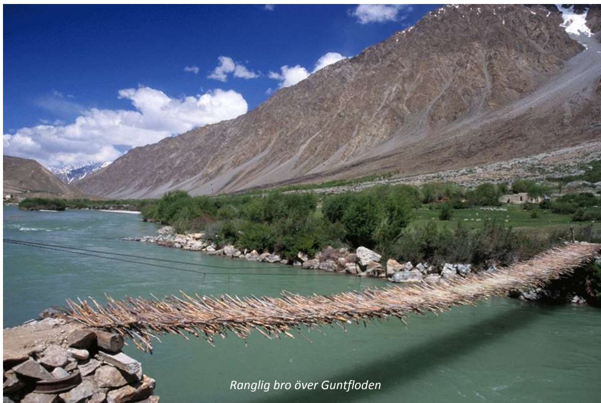
Ranglig bro över Guntfloden