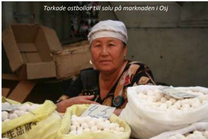
Torkade ostbollar till salu på marknaden i Osj

På förmiddagen gör vi en stadsrundtur i Osj. Stadens marknad, Jayma Bazaar, är en av Centralasiens bästa och största marknader. Som alltid är det härligt skådespel som väntar när vi går runt i de vindlande gränderna och ser allt som säljs; från dynor man använder till att göra mönster på bröd med till renoverade, gamla sovjetiska symaskiner i nyskick! Vi besöker också Kirgizistans enda världsarv, den 175 meter höga kullen Suleyman Too, även kallad