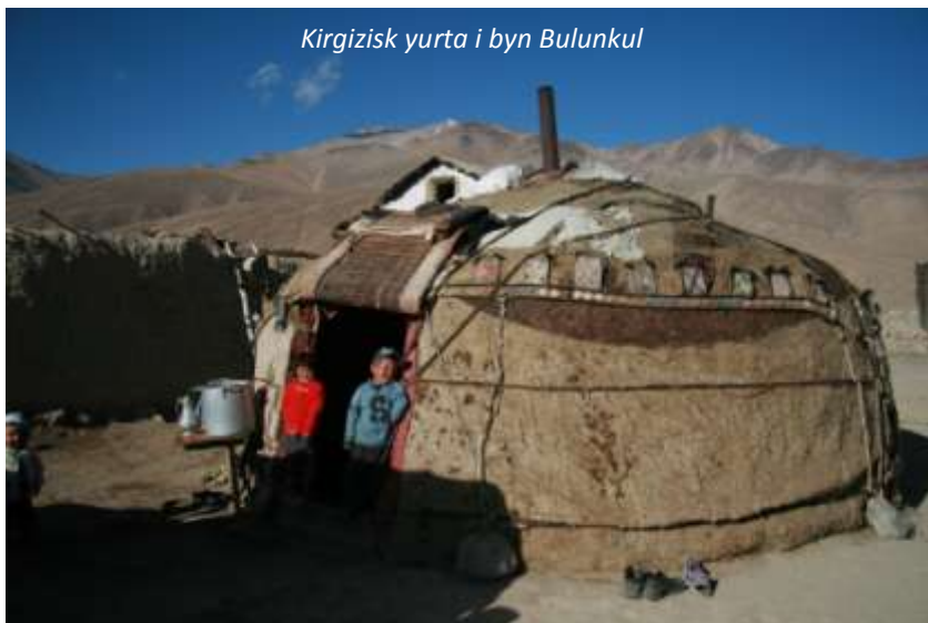
Kirgizisk yurta i byn Bulunkul

Från Langar åker vi norrut och klättrar kraftigt till en början innan vi passerar resans hittills högsta pass, Khargushpasset på 4 344 meters höjd. Här kommer vi sedan ut på den pamiriska högplatån med sitt närmaste månliknande, karga landskap flankerat av snöklädda toppar – en fantastisk syn! Vi kommer ut på Pamir Highway igen, åker västerut ett par kilometer och viker sedan av norrut på en dålig väg till det lilla