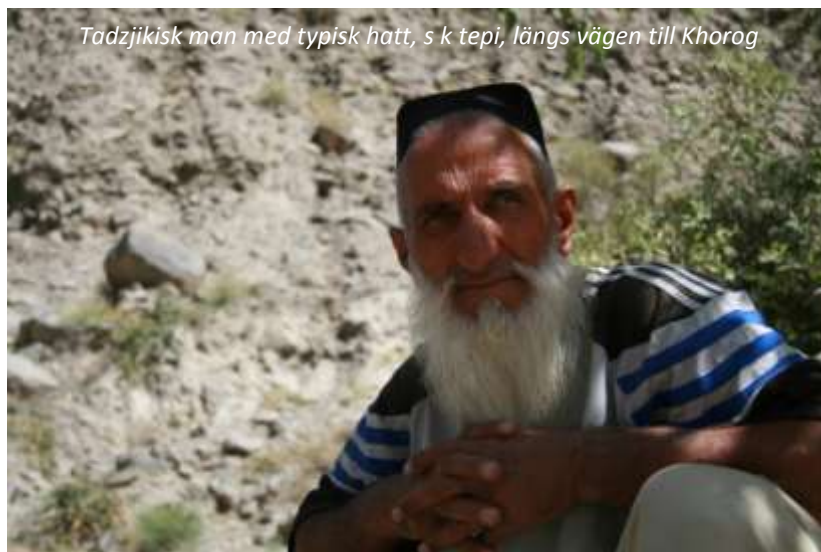
Tadjjikisk man med typisk hatt, s k tepi, längs vägen till Khorog

En mycket vacker dag väntar! Vi följer Panyifloden hela dagen och kommer att ha gott om möjligheter till spektakulära stopp längs vägen. Människorna som lever här är pamirtadzjiker och talar pamiri, vilket skiljer sig mycket åt från tadjjikiskan. Faktiskt så har de små samhällena i denna bergiga region levt så isolerade att man i varje by har utvecklat sin helt egen dialekt av pamiri! På eftermiddagen kommer vi