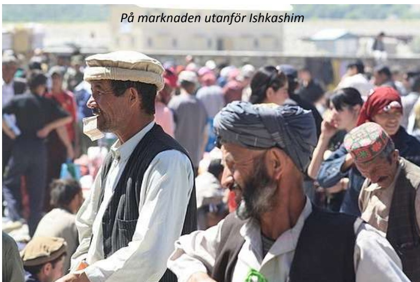
På marknaden utanför Ishkashim

befästning ligger vackert på ett bergskrön och utsikten härifrån över Afghanistans bruna berg och Pakistans mäktiga Hindukush är storslagen! Ni fortsätter till Vrang, där ni ser bevis på den smältdegel som Pamir utgör. Här finns såväl en buddhistisk stupa och lämningar efter zoroastriska kultplatser. I zoroastrismen utgör elden en central roll och vid kultplatserna brann alltid en evig låga. Vi kommer fram till Langar sent på eftermiddagen,