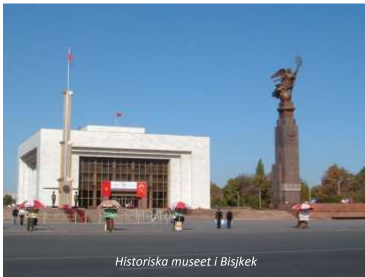
Historiska museet i Bisjkek

Även Bisjkek var en rastplats längs den förgrening av Sidenvägen som gick genom Tian Shan. Dagens stad är dock relativt modern med många exempel av typisk sovjetisk monumentalarkitektur, men det är en grön stad med många parker och läget är vackert; vid foten av Ala-Toobergen. Här finns även en av de få kvarvarande statyerna av Lenin, även om den numera står på en mer undanskymd plats tidigare! Under stadsrundturen idag går vi runt i de centrala delarna, ser parlamentshuset (mer känt som Vita huset), besöker stadens stora