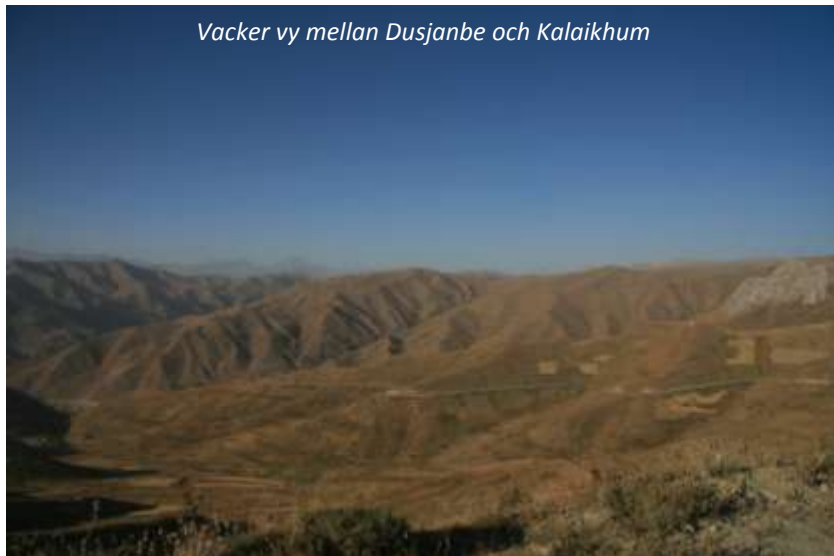
Vacker vy mellan Dusjanbe och Kalaikhum

Tadzjikistans främsta sevärdhet är dess berg; mer än 90 % av landet är berg och över 50 % ligger över 3 000 meters höjd! På morgonen ger vi oss ut på det som är en av världens vackraste resor, Pamir Highway. Pamir heter lokalt Bam-i-Danya, vilket betyder Världens tak , och är ett 120 000 km 2 stort bergslandskap som är uppdelat mellan Tadzjikistan, Kirgizistan, Kina och Afghanistan. Större delen, och den mest spektakulära