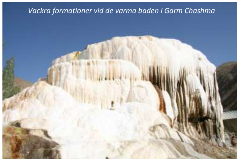
Vackra formationer vid de varma baden i Garm Chashma

Efter frukost beger vi oss ut på en stadsrundtur i Khorog. Vi besöker det intressanta regionala museet och den imponerande botaniska trädgården, som ligger fem kilometer öster om staden. Här finns över 3 000 arter av träd och växter och trädgårdens cirka 200 hektar sträcker sig hela vägen upp till 3 900 meters höjd (Khorog ligger på cirka 2 100 m ö h), vilket gör den till världens näst högst belägna botaniska trädgård! Efter lunch åker vi söderut till de varma källorna vid