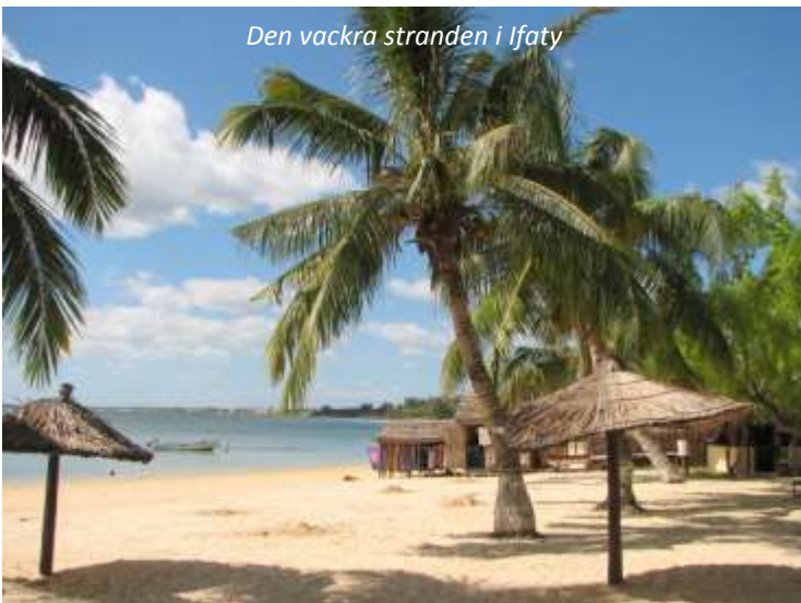
Den vackra stranden i Ifaty

Resan går idag från Isalo sydväst mot staden Toliara (även kallad Tulear, de flesta städer i Madagaskar har två namn, ett på malagassiska och ett på franska), dit vi kommer fram vid eftermiddagen. Vi befinner oss nu i den torraste delen av Madagaskar där stammen Vezo är i majoritet, som huvudsakligen lever av fiske. I takt med att det blir torrare så gör också de underligt formade baobabträden sitt intåg. Dessa träd har i alla tider varit viktiga för folktron och många byar har ett heligt baobabträd i mitten av byn. Från Toliara åker vi norrut längs en