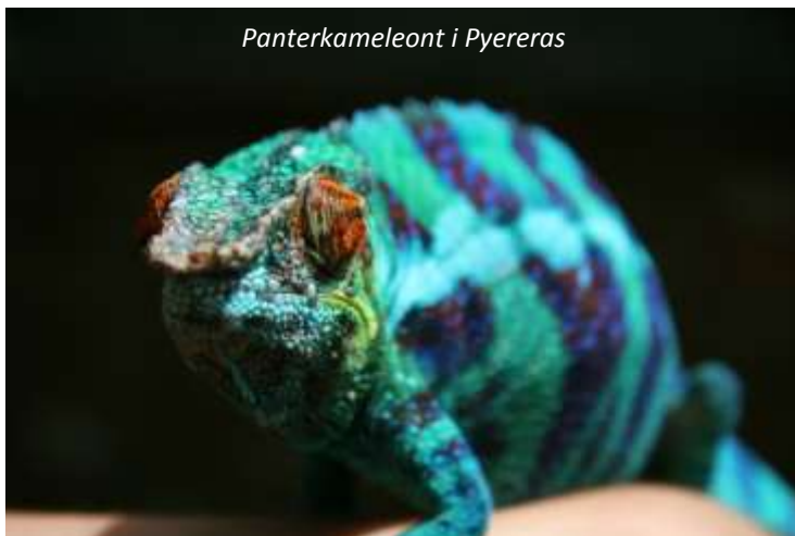
Panterkameleont i Pyereras

lövsvansgeckos. Här ser vi bland annat den fantastiskt färgade panterkameleonten, som kan gå i regnbågens alla färger, från knallblått till skinande rött! Från huvudstaden fortsätter vi söderut genom ett högländslandskap med terrasserade risfält och typiska eroderade kullar, som kallas lavaka . Sent på eftermiddagen kommer vi fram till Antsirabe, vars namn betyder Saltets plats , en modern stad som grundades av en norsk missionär 1856 då klimatet här var mer lämpligt för de