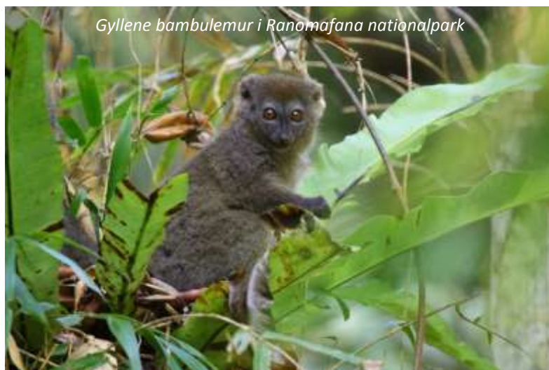
Gyllene bambulemur i Ranomafana nationalpark

Ranomafana nationalpark är 415 km 2 stor och är täckt av molnskog; ett namn som kommer sig av att lågländernas varma luft här möter högländernas kyligare och bildar kondens, vilket på morgnar och kvällar täcker in skogen i dimma. Här finns därför en mångfald av epifyter, det vill säga växter som växer på andra växter som till exempel orkidéer. Ranomafana är också känt för sitt fantastiska djurliv; här lever hela 12 arter av lemurer! Efter frukost börjar vi