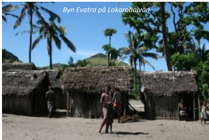
Byn Evatra på Lokarohalvön

Vi gör idag en utflykt till halvön Lokaro. Vi kör först till sjön Lanirano, där vi går ombord på en båt som kör oss längs smala kanaler till den större sjön Ambavarano som kantas av en ymnig vegetation med ett rikt fågelliv. Vi går iland här och gör en promenad genom den charmiga byn Evatra till en bukt där en vacker strand väntar. Om vi har tur så har vi möjlighet att se knölval och delfiner från en höjd i närheten! Vi går sedan tillbaka och äter vår medhavda lunch i närheten av Evatra, innan vi åker åter till Tolanaro.