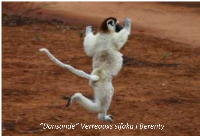
"Dansande" Verreauxs sifaka i Berenty

Hotel Croix du Sud (3*). Frukost, middag.