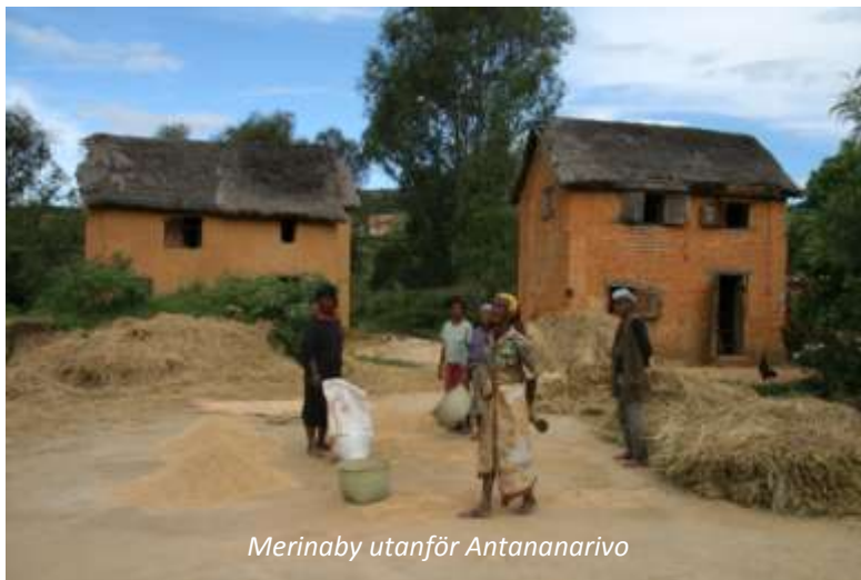
Merinaby utanför Antananarivo

Högst upp i den gamla staden ligger Rova, mer känt som drottningens palats. Tyvärr förstördes huvuddelen av denna byggnad i en brand 1995, men en del finns kvar och det går att få en bild av hur drottningarna styrde härifrån. Vi besöker också den lägre staden, med nyare bebyggelse, vars centrum utgörs av sjön Lac Anosy och monumentet mitt i sjön. Efter lunch kör vi österut genom ett grönt och lummigt landskap. Denna region har det fuktigaste klimatet på ön, vilket vi kan se när vi kommer fram till Andasibe där vi möts av regnskog. På vägen kommer vi att se Merinabyar; Merina är den största stammen på Madagaskar och har indonesiskt ursprung. Sent på eftermiddagen kommer vi fram till vår charmiga lodge, Vakona, vars restaurang ligger i en liten lagun där man ofta kan se Madagaskarkungsfiskare, med sin vackra blå fjäderdräkt. Vakona Lodge (3*). Frukost, middag.