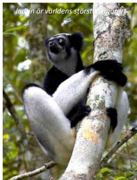
Indri är världens största lemurart

Efter frukost börjar vi att utforska nationalparken Andasibe-Mantadia, som är en av de mest intressanta i Madagaskar. I parken finns elva lemurarter av vilka den mest berömda är Andasibes huvudattraktion, indrin . Denna svartvita lemur är den största lemurarten i världen och är framför allt känd, förutom för sitt charmiga yttre, för sina öronbedövande skrik! Det finns relativt gott om dem i Andasibe, så vi har mycket goda chanser att se dem. Andasibe är också den bästa