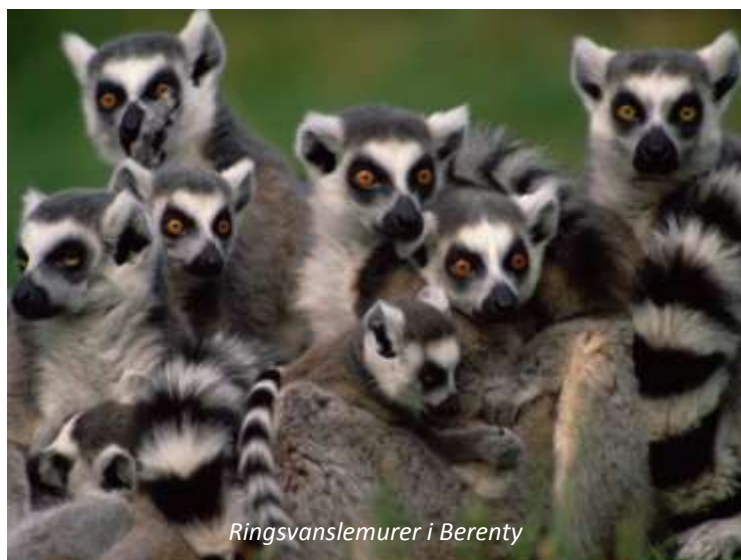
Ringsvanslemurer i Berenty

Vi lämnar Tolanaro och kör längs en dålig väg till det privata reservatet Berenty, som vi tåls lova blir en av resans höjdpunkter! Berenty brukar kallas för Lemurernas kungadöme och gör verkligen skäl för namnet. Runt våra hyddor har vi ringsvanslemurer och man kan ofta se Verrauxs sifakas i närheten. De sistnämnda brukar kallas för "de dansande lemurererna" för sitt lustiga sätt att ta sig över öppna markområden mellan träden. Den tredje arten av dagaktiv lemur man kan se här är brun maki. På kvällen gör vi en promenad i reservatet för