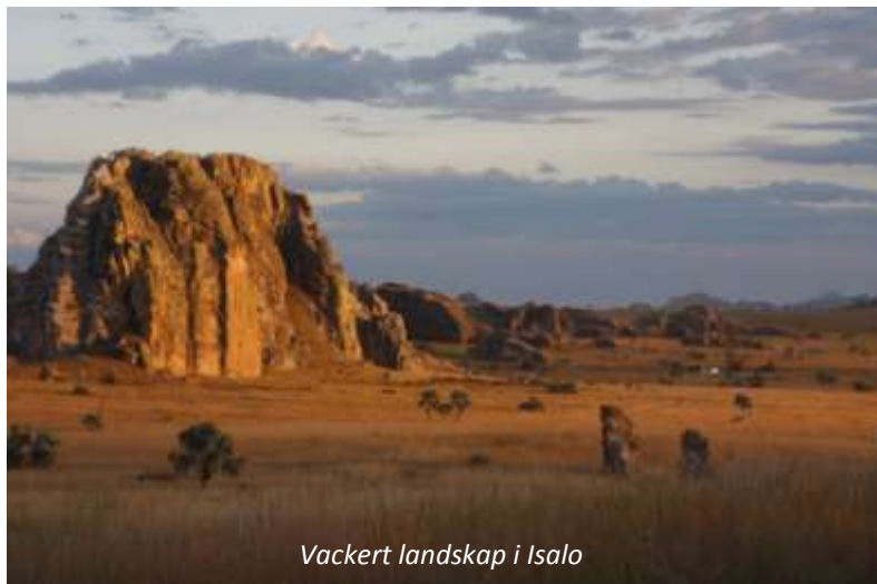
Vackert landskap i Isalo