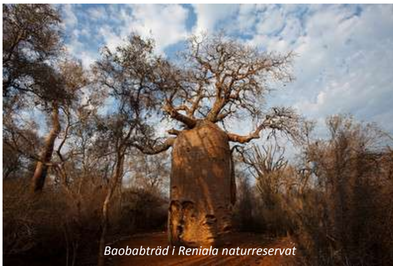
Baobabträd i Reniala naturreservat

Dagen är ledig för sol och bad eller egna promenader. Sent på eftermiddagen så gör vi en utflykt till det närbelägna naturreservatet Reniala, som är ett av de få skyddade områden som instiftats för att värna om den unika typ av växtlighet som sydvästra Madagaskar är ensamt om; taggskog. Var namnet kommer från är lätt att förstå, då många växter har utvecklat försvar i form av stora taggar. I Reniala så ser vi också en baobabart i många olika former;