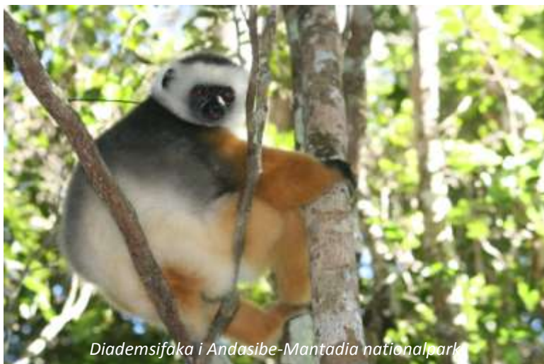
Diademsifaka i Andasibe-Mantadia nationalpark

nationalparken på ön för att se diademsifakan, som många anser vara den vackraste lemurarten. Det är lätt att hålla med när man ser den med sin päls i vitt, silvergrått och orange. Annat vi med största sannolikhet kommer att se är fantastiskt välkamouflerade lövsvansgeckos, trädgrodor och flera olika arter av kameleonter, bland annat den största av dem alla, Parsons kameleont, som kan bli nästan 70 cm lång inklusive svans. På eftermiddagen besöker vi Lemurön; här har tidigare infångade lemurer fått ett nytt hem och vi kommer att ha med oss bananer för att mata dem. Charmiga bruna makier kommer ofta och sätter sig på axeln, medan diademsifakan och den svartvita varin är lite skyggare! Vi avslutar dagen med en promenad på kvällen för att spana efter nattaktiva djur.