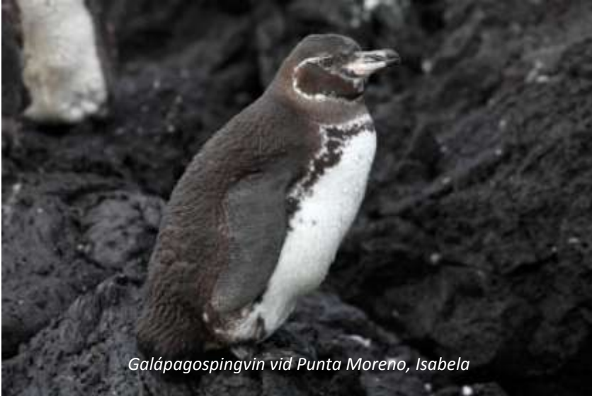
Galápagospingvin vid Punta Moreno, Isabela

Ett surrealistiskt landskap väntar oss när vi vaknar på morgonen utanför Punta Moreno på Isabelas västra sida. Här har lavan runnit hela vägen ner till havet och sedan här och var brutits upp när gasbubblor i lavan kollapsat, vilket bildat diken och pölar. I dessa pölar frodas livet och vi har möjlighet att se havsleguaner, sjölejon, flamingos, hägrar och annan sjöfågel. Efter lunch fortsätter vi norrut till Elizabeth Bay, där det inte är tillåtet att gå iland utan vi gör en utflykt i landstigningsbåtarna genom den