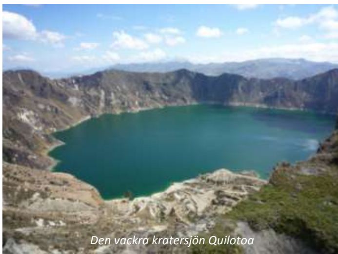
Den vackra kratersjön Quilotoa

Vi flyger på morgonen med KLM från antingen Stockholm, Göteborg, Linköping eller Köpenhamn till Amsterdam, där vi byter plan. Härifrån går sedan flyget direkt till Quito, där vi landar på eftermiddagen lokal tid, möts vid ankomsten och körs till vårt hotell som ligger mycket centralt i den nya delen av staden.