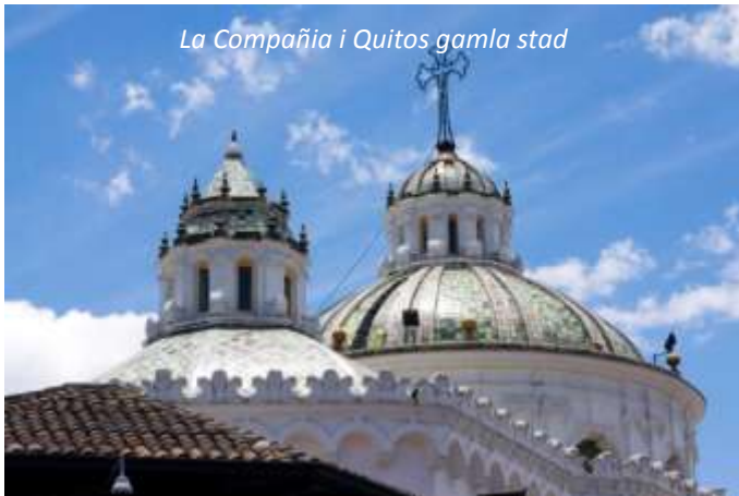
La Compañía i Quitos gamla stad

Quito: Stadsrundtur och ekvatormonumentet