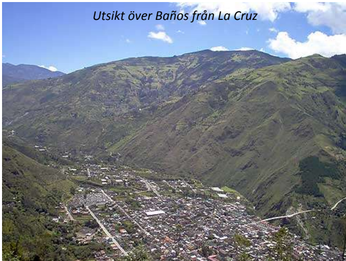
Utsikt över Baños från La Cruz

Naturen runt Baños är grön och kuperad och i bakgrunden ligger den snöklädda vulkanen Tungurahua och vakar över den lilla staden. Vi kommer idag att åka mot Puyo längs Ecuadors kanske allra vackraste väg, där vattenfall kantar vägen. Från Baños 1 800 meter klättrar vi ner till cirka 800 meter på en dryg timme! Här stannar vi och går genom det som blivit regnskogsliknande vegetation till ett vackert vattenfall, Pailon del Diablo. Denna promenad tar cirka en timme, men vyerna längs vägen och framme vid vattenfallet gör att det är värt det! Vi fortsätter hela vägen ner till Puyo, som är inkörsporten till det mäktiga Amazonas, världens största regnskog. Här är växtligheten