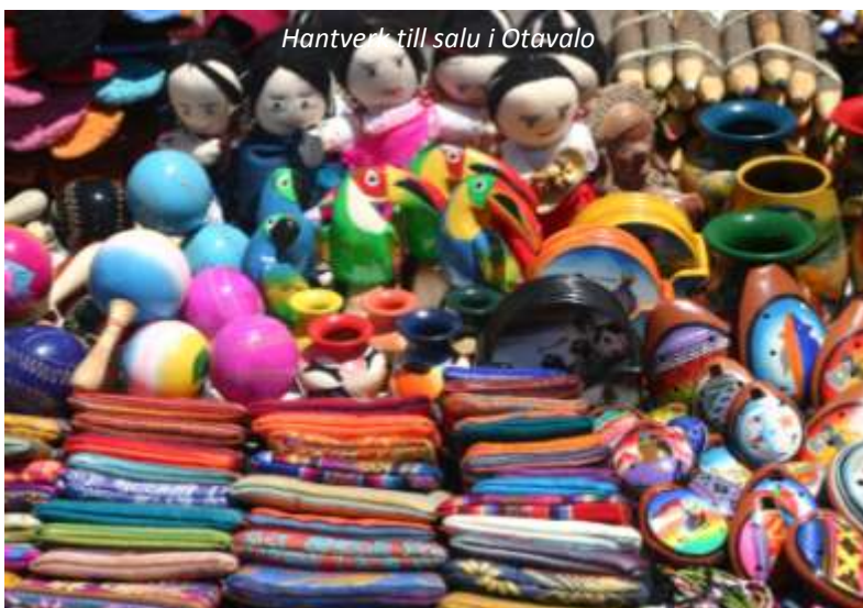
Hantverk till salu i Otavalo

Den mest berömda marknaden i Ecuador bjuder på en mängd attraktioner. Dels de traditionellt klädda Otavaloindianerna och dels den mängd kläder, väggbonader, instrument mm som finns att köpa. Det är en njutning för alla sinnen att gå omkring i detta enorma vimmel. Vi börjar med att besöka djurmarknaden och går sedan tillsammans den korta sträckan till huvudmarknaden, där vi har förmiddagen ledig för att på egen hand gå runt på denna färgsprakande marknad. På eftermiddagen åker vi tillbaka till Quito.