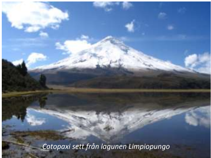
Cotopaxi sett från lagunen Limpiopungo