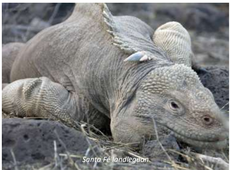
Santa Fé landleguan

När vi vaknar på morgonen så ligger vi för ankar i en underbart vacker bukt utanför den lilla ön Santa Fé, en spektakulär ö där vi hittar en fantastisk snorkling och en promenad som bjuder på ögruppens största opuntiakaktusar och Galápagos största leguanart, Santa Fé landleguan. Som namnet antyder så lever den endast på denna lilla ö! Efter promenaden så har vi tid för bad och snorkling i det klara och azurblå vattnet. Det finns goda möjligheter att se såväl havssköldpaddor som