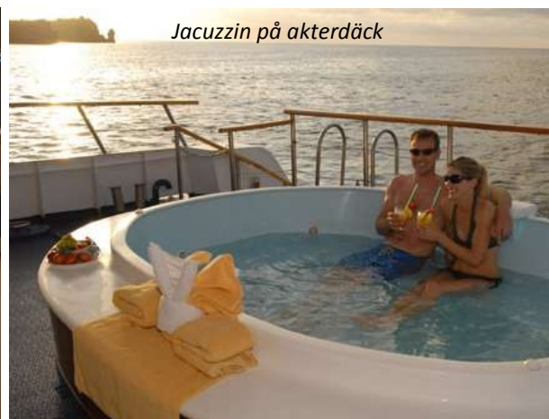
Jacuzzin på akterdäck

Standard Plushytterna är 11-12 m 2 stora och har två enkelsängar som kan göras om till en dubbelsäng. Dessa hytter ligger på nedre däck och har så kallade port holes som fönster. Juniorhytterna är lika stora, det vill säga 11-12 m 2 , men har större fönster och ligger på mellersta och övre däck.