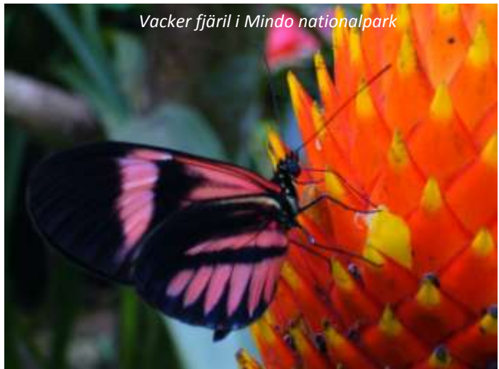
Vacker fjäril i Mindo nationalpark

Efter frukost besöker vi ett barnhem i utkanten av den gamla stadsdelen. Kon-Tiki Resor stödjer detta barnhem, som är Quitos största, vid varje resa till Ecuador, antingen genom direkta pengabidrag eller genom material som behövs, som till exempel mediciner, köksutrustning, kläder och skolmaterial. Om du också vill hjälpa till så berättar vi gärna hur! Efter besöket här så åker vi västerut mot Mindo nationalpark. Resan tar bara cirka 1½ timme, men landskapet förändras dramatiskt under resans gång. Från högländerna åker vi nu neråt i höjd och når så småningom molnskogen i Mindo. Denna klimatzon kallas för molnskog då högländernas kalla luft möter