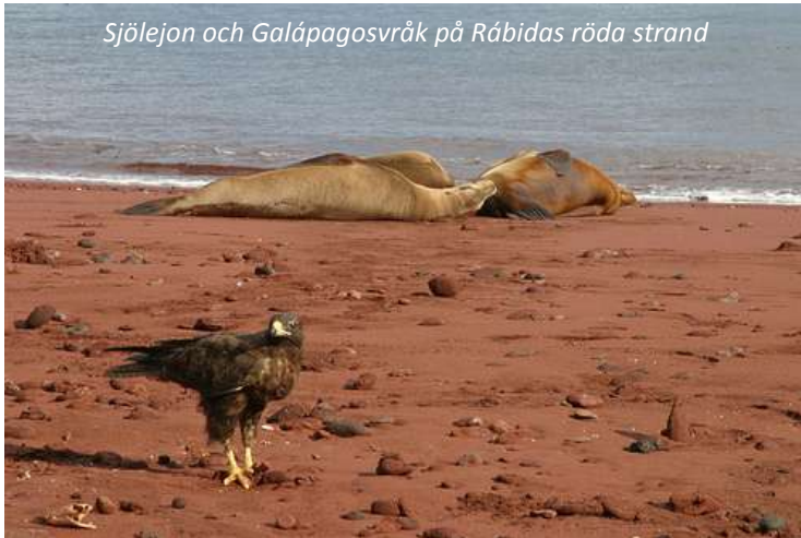
Sjölejon och Galápagosvråk på Rábidas röda strand

Vi börjar dagen vid en roströd sandstrand på ön Rabida. Färgen kommer sig av den höga järnhalten i sanden, som sedan har oxiderats. Här ligger alltid sjölejon och vilar och vi har möjlighet till mycket bra snorkling utanför, där vi har goda chanser att se Galápagospingviner. Vi går också en promenad på ön och njuter av vacker utsikt över grannön Santiago och de imponerande opuntiakaktusarna. Rabida är också en av de bästa öarna för att se Galápagoshöken, en endemisk rovfågel för öarna. På eftermiddagen besöker vi den norra delen av Santa Cruz och går en promenad längs