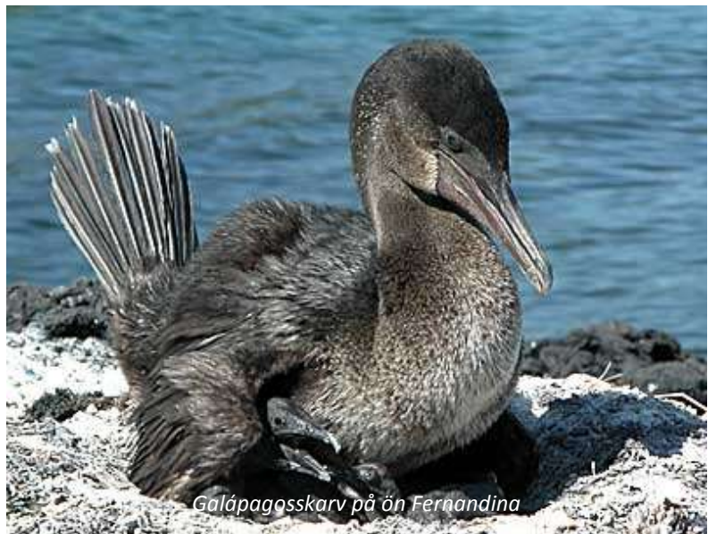
Galápagosskarv på ön Fernandina

En av kryssningens höjdpunkter blir utan tvekan denna dag, då vi kommer att utforska ögruppens västligaste och nyaste ö, Fernandina, samt Isabelas västra kust. Då Fernandina är en så pass ny ö, endast cirka 700 000 år gammal, så ändras landskapet ständigt. Så sent som 1968 så kollapsade kratern och sjönk med över 300 meter! Västra Isabela och Fernandina är de enda platserna på Galápagos där man kan se den unika Galápagosskarven, som har förlorat sin flygförmåga eftersom naturliga fiender har saknats. Här finns även goda bestånd av Galápagospingviner. Vattnet mellan Fernandina och Isabela är mycket näringsrika och vi har goda möjligheter att se såväl val som delfiner och djävulsrockor. Naturligtvis kommer vi ha möjlighet att snorkla i det fantastiskt klara vattnet där sikten normalt är runt 30 meter – en härlig dag!