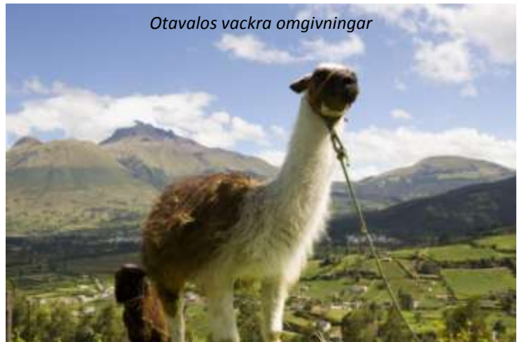
Otavalos vackra omgivningar