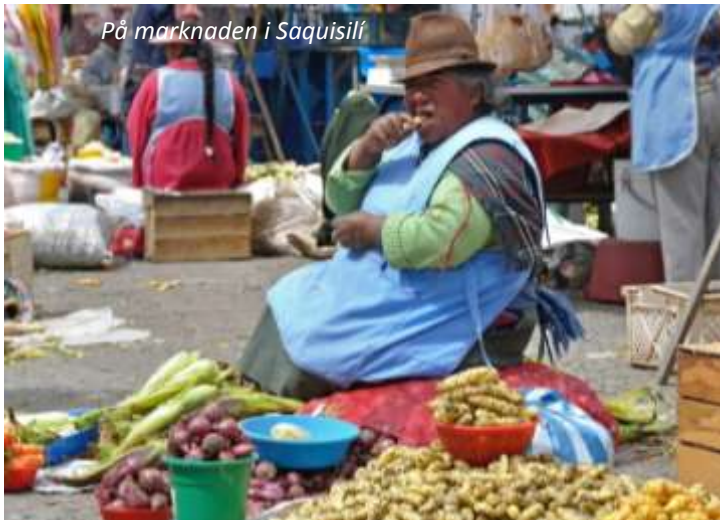
På marknaden i Saquisilí

Roligast av allt är ändå att se hur ursprungsbefolkningen köpslår och handlar som de alltid har gjort, långt före någon europé satte sin fot här! Vi fortsätter på eftermiddagen till Otavalo, som ligger ett par timmars resa norr om Quito som vi passerar på vägen. Nu befinner vi oss i provinsen Imbabura och ursprungs-befolkningen här är de som lyckats bäst av alla Latinamerikas indiagrupper. Detta på grund av deras skicklighet i vävning och annat hantverk, vilket verkligen märks på den lilla stadens gator och, framför allt, på lördagsmarknaden. Otavaloindianerna reser både till Nordamerika och Europa och säljer