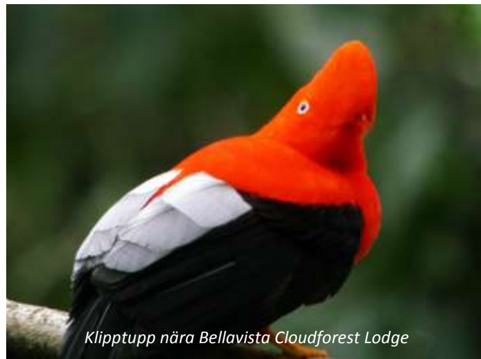
Klipptupp nära Bellavista Cloudforest Lodge

Bellavista Cloudforest Lodge (3*). Frukost.