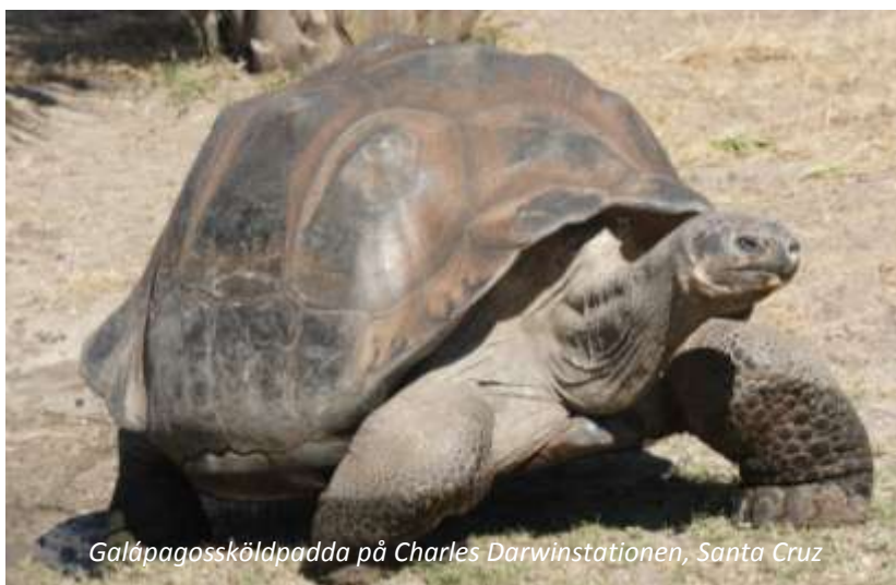
Galápagosköldpadda på Charles Darwinstationen, Santa Cruz